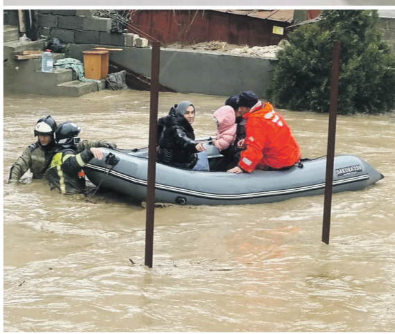
Уровень воды на улицах пострадавших посёлков Дагестана превышал метр

Как Кавказ справляется с последствиями непогоды — режим ЧС сохраняется в Махачкале, Буйнакске, Каспийске и других городах и районах Дагестана