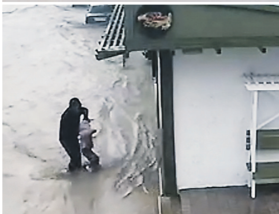
Мужчине удалось спасти девочку, которую нёс бурный поток