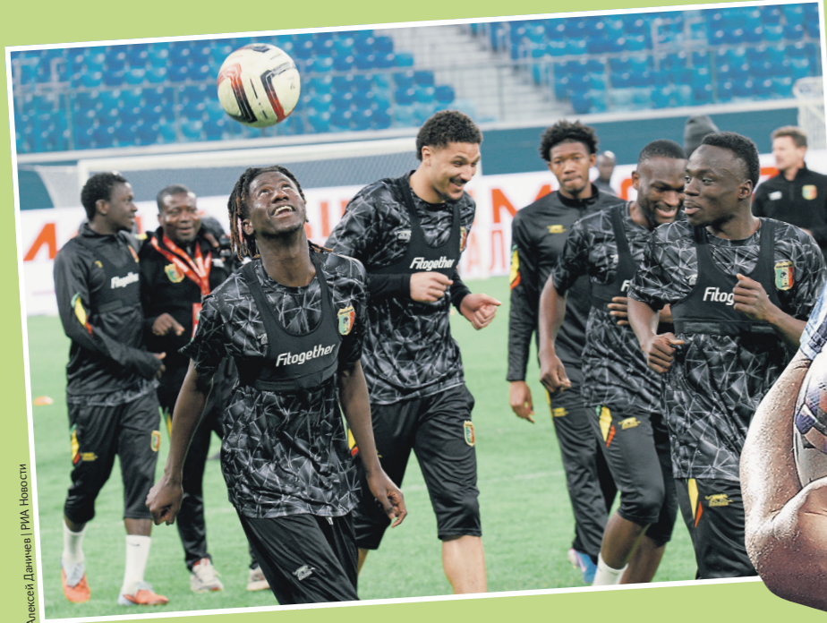
Алексей Давыдов / РИА Новости