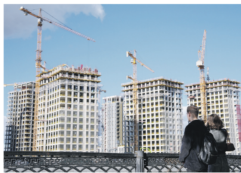
Дмитрий Корнеев / Иллюстрация

По данным ЦБ за девять месяцев 2025 года, подобной деятельностью без соответствующего статуса на системной основе занимаются около 100 организаций и физлиц. Правительство предлагает внести изменения в федеральный закон о госу-