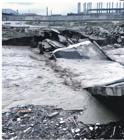
Стихия разрушила несколько мостов

Аллергикам не следует долго находиться на улице в сухую ветреную погоду, а также гулять в парках. Дома необходимо проводить влажную уборку, вместо проветривания пользоваться кондиционером — так воздух будет циркулировать внутри квартиры и пыльца не попадёт с улицы. После прогулки необходимо переодеваться в домашнюю одежду, мыть лицо и руки, мыть голову каждый день, потому что на волосах мы приносим пыльцу домой, рекомендовал врач.