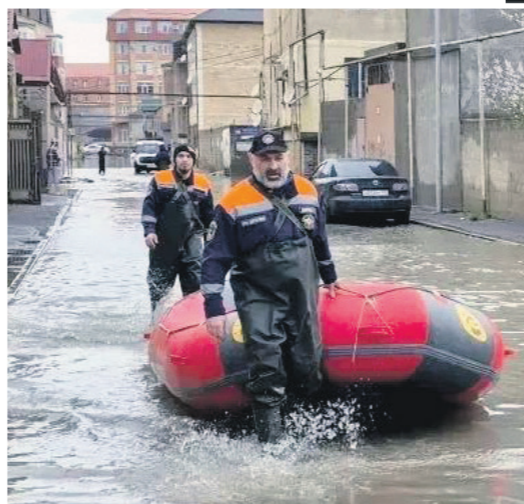
Дороги превратились в реки — по ним можно было передвигаться только на лодках