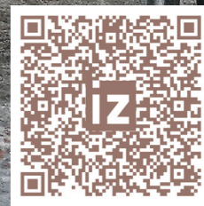
Павел Виноградов / Иллюстрация