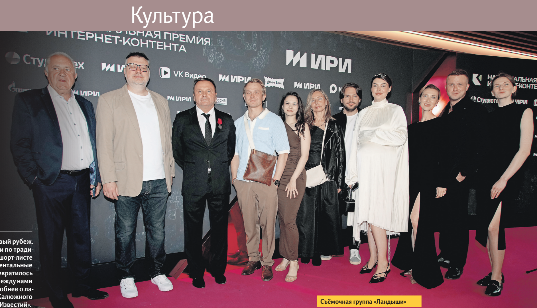
Съёмочная группа «Ландыши»

Национальная премия интернет-контента преодолела новый рубеж. 28 мая во Дворце Ирины Винер она отметила пятилетие и по традиции назвала лучшие социально ориентированные проекты. В шорт-листе 75 проектов в 15 номинациях. В их числе — сериалы, документальные ленты, анимация, вирусный контент, блоги, музыка. Шоу превратилось в трекатное действие, героями которого стали «Три кота», «Между нами химия», Александр Овечкин, группа «Бонд с кнопкой». Подробнее о лауреатах, а также о первом выходе в свет после армии Глеба Калужного и юмористическом стендапе от священника — в репортаже «Известий».