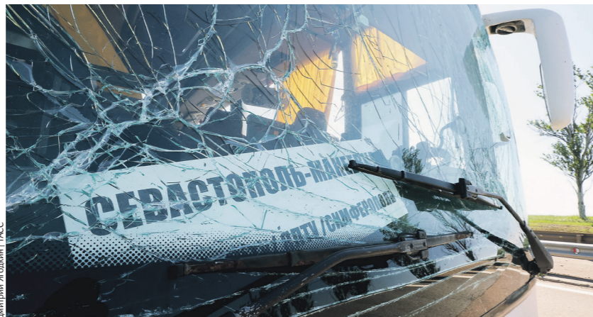
Пассажирам и водителю чудом удалось уцелеть после удара украинского дрона по рейсовому автобусу

В Луганской народной республике 27 мая очередной мишенью террористи-