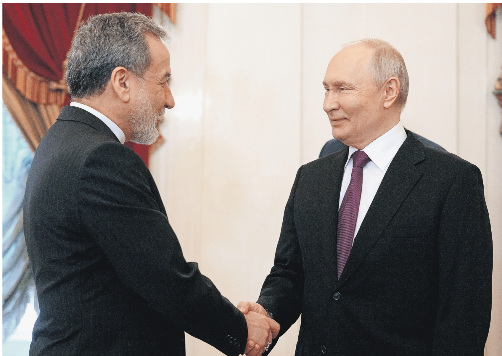
Владимир Путин заверил Аббаса Аракчи, что Москва сделает всё для достижения мира на Ближнем Востоке