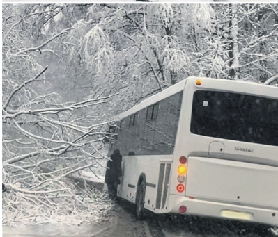
Упавшие деревья мешали проезду общественного транспорта

Там также отметили, что бригады и спецтехника ГУП «Мосводосток» дежурят круглосуточно, в местах возможных временных скоплений воды дежурит откачивающая техника.