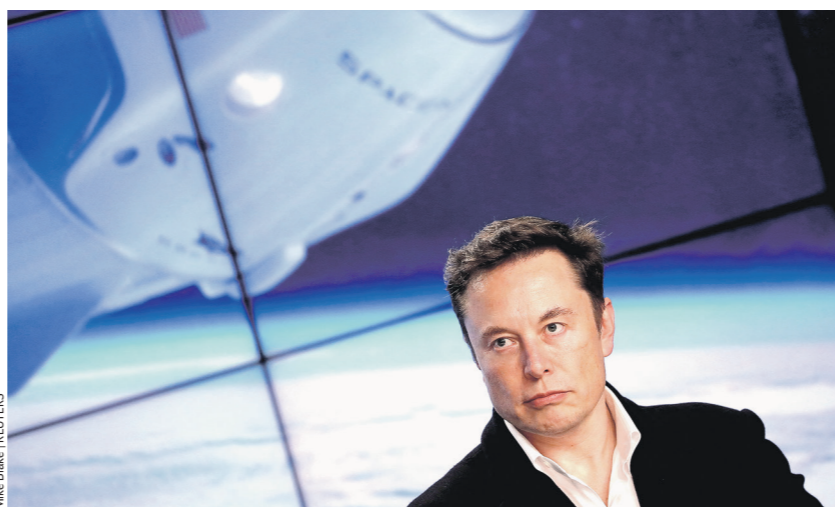
Доводы Илона Маска о рисках искусственного интеллекта звучат всё менее альтруистично