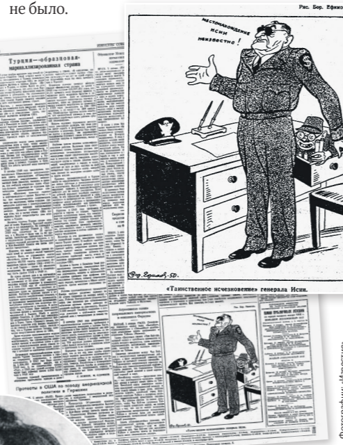
Номер «Известий» от 6 января 1950 года, где опубликована заметка о том, как США укрывают военного преступника Исии Сиро

Японские истязатели изучали пределы выносливости человеческого организма. Людей помещали в барокамеры, фиксировали на киноплёнку их агонию, искусственно обмораживали конечности, наблюдая за развитием гангрены. Если заражённый подопытный каким-то образом выживал, его подвергали новым испытаниям, неизбежно заканчивавшимся смертью. Выжи и в ших не было.