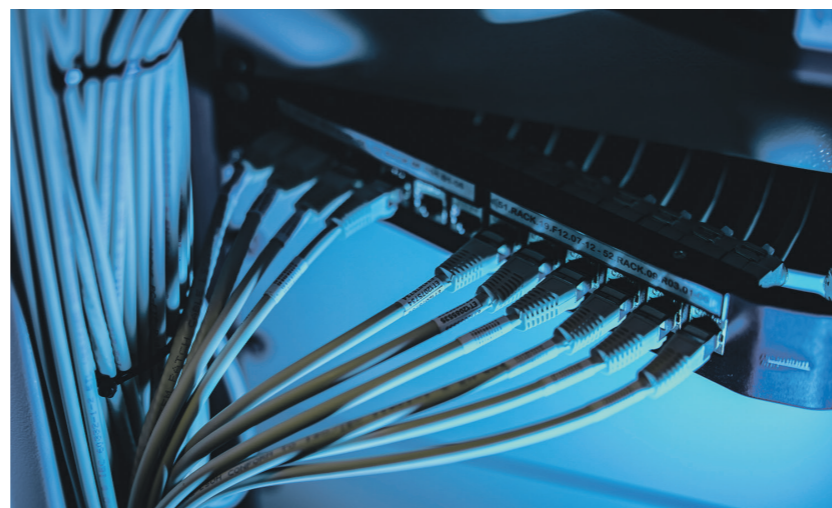
Сергей Ланцов | Известия