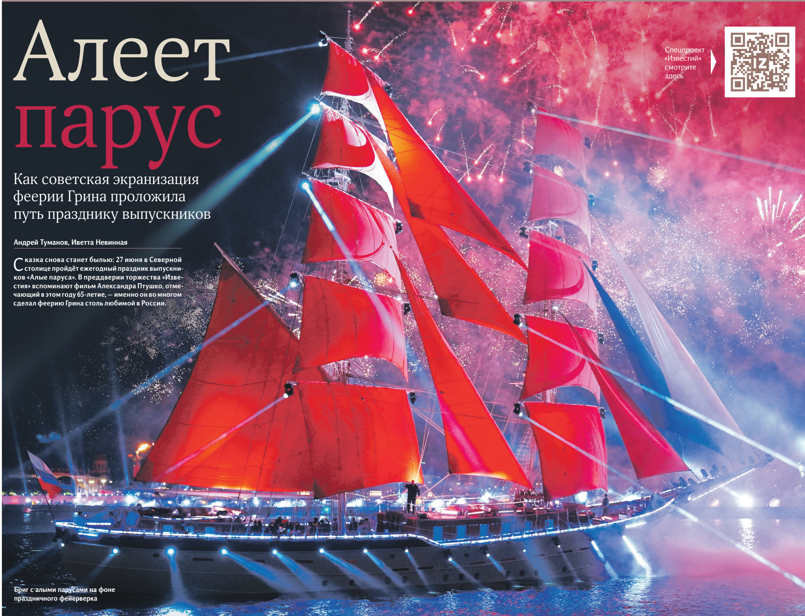
Бриг с алыми парусами на фоне праздничного фейерверка

Сказка снова станет былью: 27 июня в Северной столице пройдёт ежегодный праздник выпускников «Алые паруса». В преддверии торжества «Известия» вспоминают фильм Александра Птушко, отмечающий в этом году 65-летие, — именно он во многом сделал феерию Грина столь любимой в России.