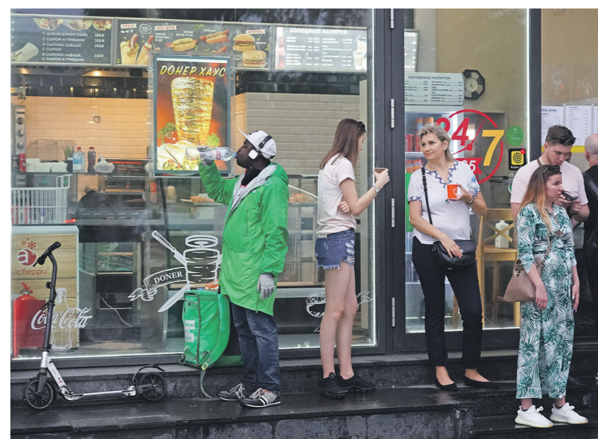
Татьяна Савицкая / Иллюстрация

Риски сохраняются и для потребителей, отметила эксперт. При обращении к нелегальным мастерам, перевозчикам или арендодателям