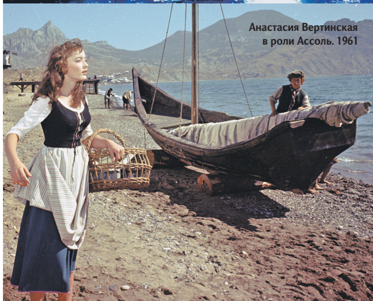
Анастасия Вертинская в роли Ассоль. 1961

ХОДЯТ ЛЕГЕНДЫ. КАК НАСТО ПЕРЕОДЕВАЛИ И ГРИМИРОВАЛИ, ИСКАЛИ ДЛЯ НЕЁ ПАРИК, ЧТОБЫ ОНА ПОСТЕПЕННО ПРЕВРАТИЛАСЬ В АССОЛЬ, — И ПТУШКО ЕЁ НАКОНЕЦ УТВЕРДИЛ. ЧУДО ПЕРЕОПЛОЩЕНИЯ ДЕЙСТВИТЕЛЬНО СЛУЧИЛОСЬ