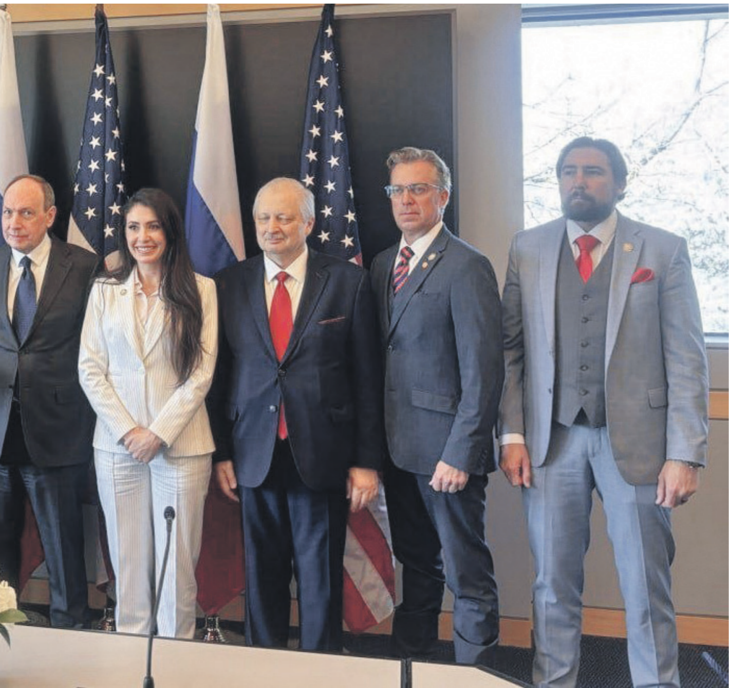
В марте делегация Госдумы посетила США с официальным визитом впервые за 12 лет

ют место, и каждое новое продвижение вперёд даётся ценой значительных усилий. У нас по мелочам тоже продвижение есть, — пояснил он.