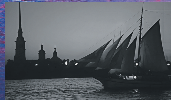
В первых «Алых парусах» участвовала яхта «Металлист» из Центрального яхт-клуба Ленинграда

В 2005 году благодаря усилиям Акционерного Банка «РОССИЯ», правительства Санкт-Петербурга и Пятого канала началась новая глава его истории. Особое место в ней занимает белоснежный бриг «Россия», впервые появившийся на Неве в 2019 году. Он несёт 17 алых парусов общей площадью около 900 кв. м. Его мачты поднимаются на высоту 30 м, а скорость достигает 16 узлов (или 30 км/ч) на парусном снаряжении — впечатляющий показатель для парусника такого класса. Именно появление «России» под залпы фейерверков и музыку, разливающуюся над Невой, стало кульминацией праздника, который сегодня ежегодно собирает миллионы зрителей.