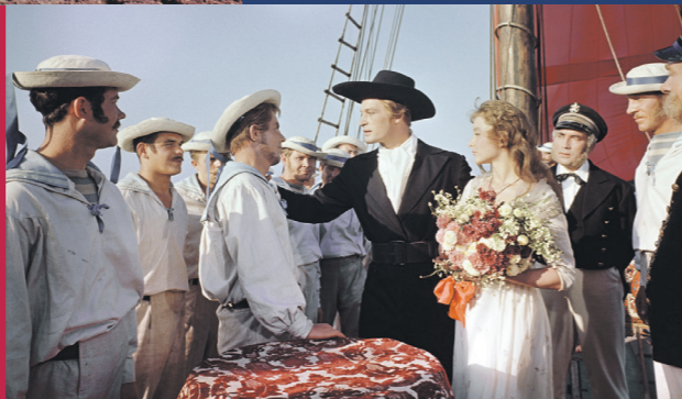
Свадьба Ассоль и Грея на палубе корабля «Секрет». 1960

Но главным испытанием для режиссёра стали, разумеется, те самые алые паруса. У Грина в повести был трёхмачтовый галиот «Секрет» — его нельзя было просто построить в студии как декорацию. Это должен был быть величественный корабль, который эффектно смотрелся бы на широкоформатном экране. Такой корабль нашёлся в мореходном училище Ростова-на-Дону. Учебная баркентина «Альфа» была полигоном для будущих моряков и украшением города: галиоты в длину редко были больше 30 м, а длина «Альфы» — 40 м. Судно переименовали в «Секрет» и забрали из Ростова для съёмки на целых полгода.