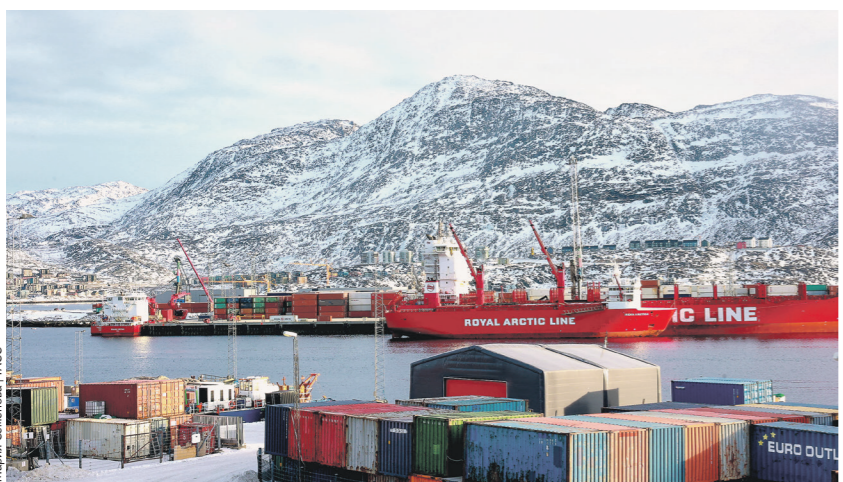
Из-за агрессивной политики Трампа Дания вот-вот может лишиться Гренландии (на фото), однако главным врагом считает Россию

В Дании прошли выборы в парламент. После подсчёта голосов левоцентристский блок во главе с премьером Метте Фредериксен побеждает. На втором месте — Социалистическая народная партия (SF, или «Зелёные левые») с 11,6% голосов, на третьем — партия министра обороны «Венстре» с 10,1%. Но кто бы сформировал новое правительство, лояльность Копенгагена к Москве ждать не стоит. А вот недооценивать опасность, идущую от этого вроде бы небольшого королевства, нельзя. Скандинавы демонстрируют просто фанатичность в отношении противостояния с нашей страной.