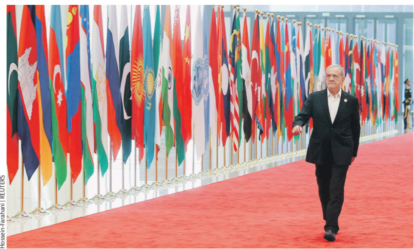
Израиль и США уничтожили более 85 тыс. гражданских объектов Ирана — страна нуждается в помощи (на фото — президент Масуд Пезешкиан на саммите ШОС)