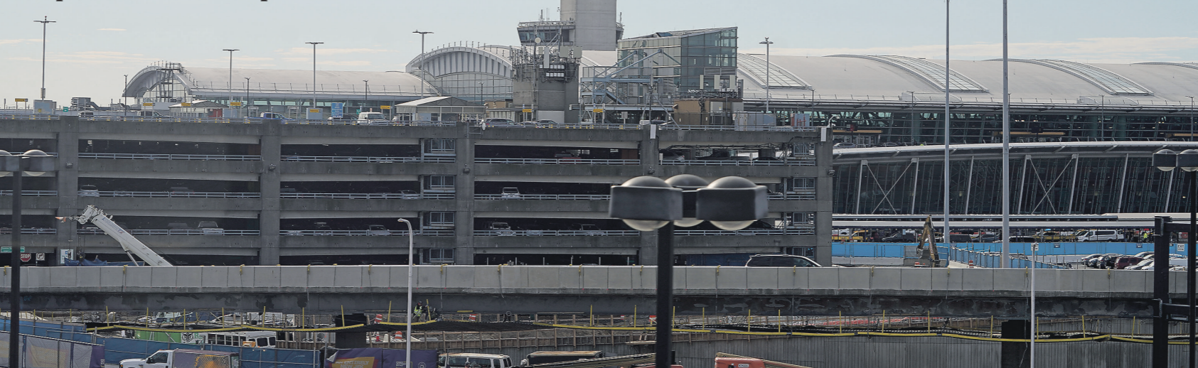
Аэропорт имени Джона Кеннеди, где приземлилась российская делегация (Нью-Йорк)

Парламентарии РФ и США пробуют наладить регулярный диалог — что будут обсуждать политики на первой за восемь лет встрече в Нью-Йорке