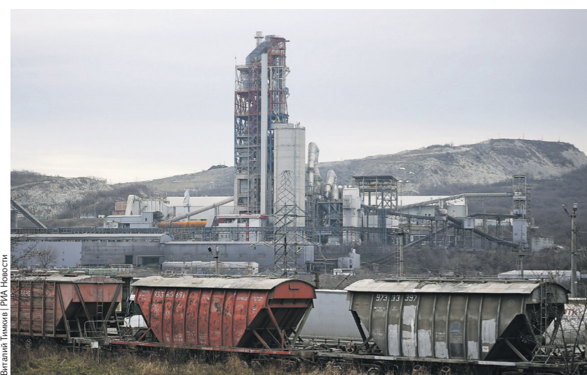
За годы, прошедшие со времени приватизации, имущество предприятия может стать заметно дороже (на фото — завод ОАО «Новоросцемент» в Новороссийске, акции и имущество которого были арестованы)

Лишь 7% такси соответствует требованиям локализации — бизнес считает, что выбор разрешённых и недорогих моделей ограничен