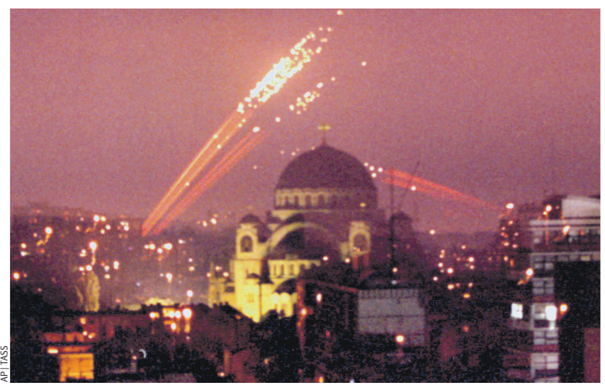
Бомбардировки Югославии (на фото) проводились без санкций СБ ООН, что многие расценивали как агрессию против суверенного государства. В случае с Ираном действия США и Израиля также нарушили Устав ООН и принцип суверенитета

Одновременно американская администрация могла преследовать цель