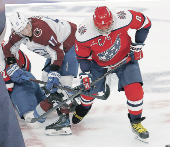
Между этими фотографиями Александра Овечкина 20 лет и тысяча шайб

Тот матч был первым в НХЛ для 19-летнего Коула Хатсона, младшего брата прошлогоднего обладателя «Колдер Трофи» из «Монреалья». Также защитника, такого же дерзкого и атакующего. Он стал первым хоккеистом в истории «Кэпиталз», ридившимся после того, как Овечкин дебютировал и, более того, провёл первый полный сезон в лиге. И в конце того же матча с «Сенаторами» соперник при 1:3 снял вратаря,