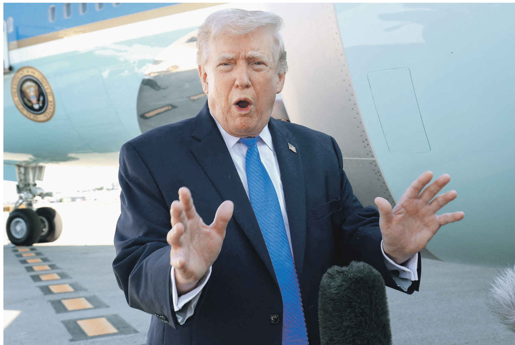
Трампа назвали переговоры с иранскими официальными лицами «глубокими и конструктивными» — официальные лица об этом, впрочем, не знают