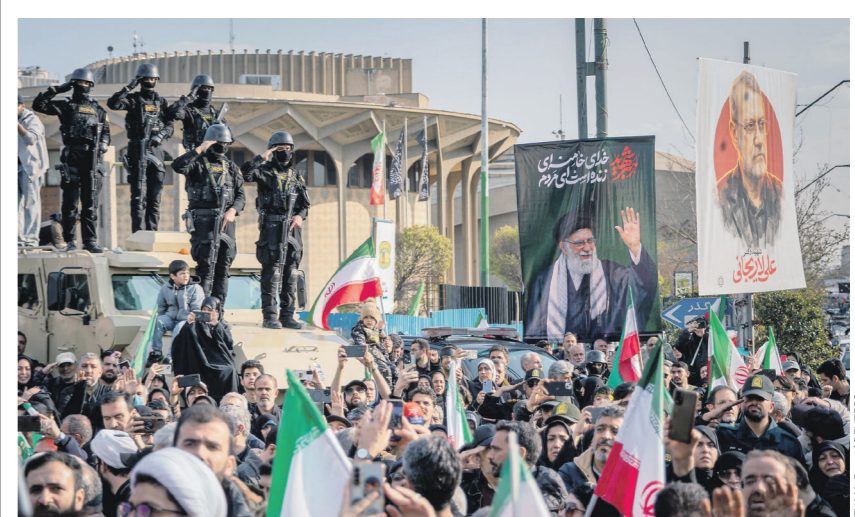
Вашингтону пока не удастся добиться разлада в иранском обществе

В обоих конфликтах применялись массированные авиаудары, которые приводили к жертвам среди мирного населения и разрушению гражданской инфраструктуры. В Югославии НАТО использовало касетные бомбы и снаряды с обеднённым ураном. Во время операции против Ирана также фиксировались удары по гражданским объектам, например по школе в Минабе, где погибли более сотни учеников.