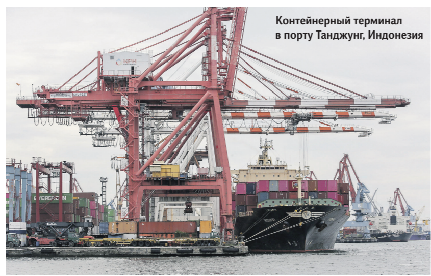
Контейнерный терминал в порту Танджунг, Индонезия