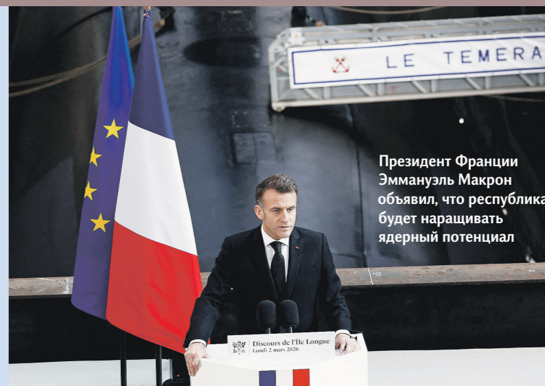
Президент Франции Эммануэль Макрон объявил, что республика будет наращивать ядерный потенциал

Скенис относительно перспектив дипломатического урегулирования сохраняется и среди союзников США. Израильская сторона допускает, что соглашения достичь не удастся, и параллельно в Вашингтоне готовится к возобновлению боевых действий. При этом серьёзным вызовом остаётся ливанский вопрос. В начале апреля Израиль и Ливан впервые за десятилетия провели прямые переговоры в Вашингтоне при посредничестве США и договорились о кратком перемирии, которое пытаются продлить. Однако даже после этого Израиль и «Хезболла» обменивались ударами. Новые переговоры на уровне послов намечены на 23 апреля в США.