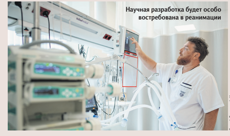
Научная разработка будет особо востребована в реанимации