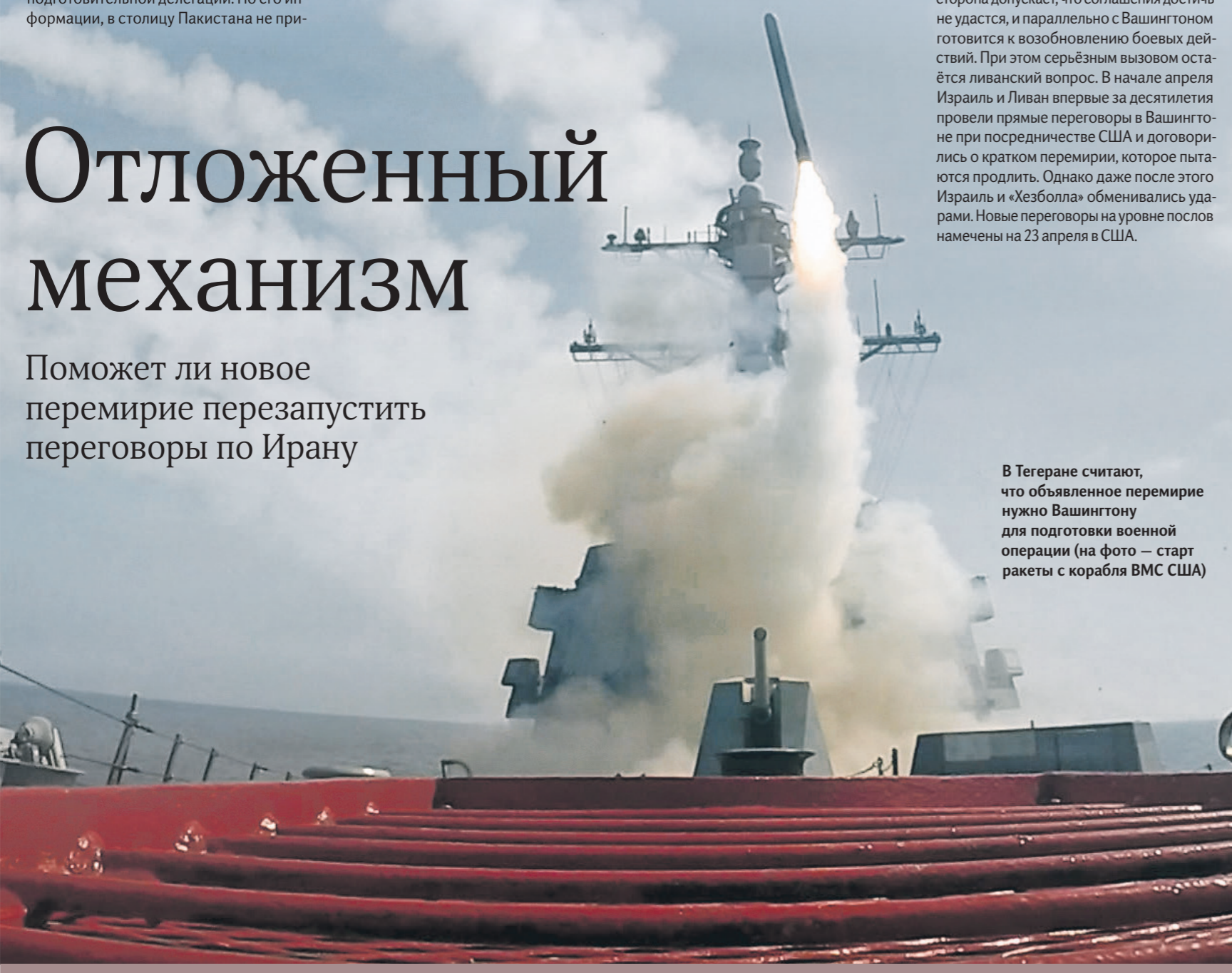
В Тегеране считают, что объявленное перемирие нужно Вашингтону для подготовки военной операции (на фото — старт ракеты с корабля ВМС США)

Поможет ли новое перемирие перезапустить переговоры по Ирану