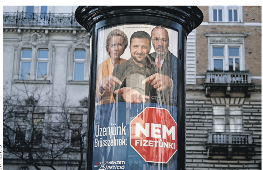
В некоторых европейских странах не скрывают нежелания финансировать киевский режим (на фото — агитационный плакат в Будапеште, Венгрия)

Именно поэтому переговоры в Пекине важны не только для России и КНР. Они показывают, что дальнейшее устройство международных отношений всё чаще будет обсуждаться в треугольнике Россия — Китай — США. Если ноябрьский саммит АТЭС действительно соберёт Путина, Си и Трампа на одной площадке, это даст мощный импульс этому пока необычному, но многообещающему политическому трио.