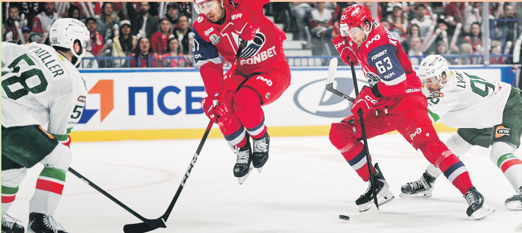
Алексей Фомин / РИА Новости

Во многом на исход двухматчевого противостояния может по-