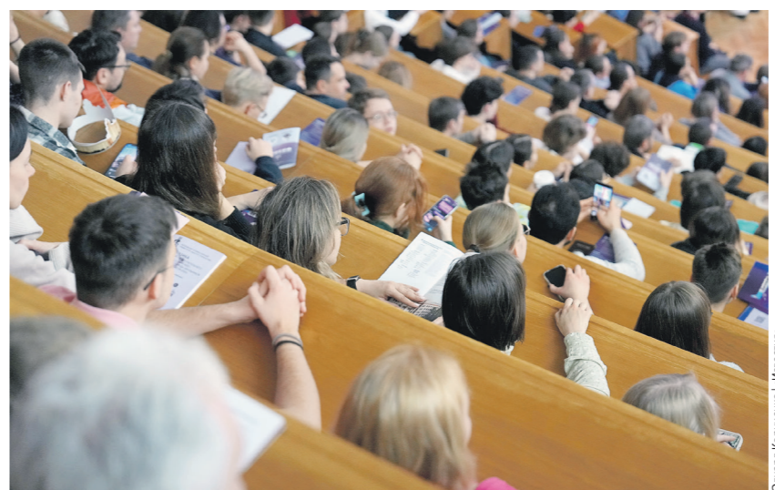
Полный текст читайте на iz.ru

Чтобы понять масштаб сегодняшних потерь в сфере образования, достаточно взглянуть на то, как система российско-американских обменов работала ещё 10–15 лет назад. Это была разветвлённая, эффективная работающая сеть, поддерживаемая на самом высоком государственном уровне.