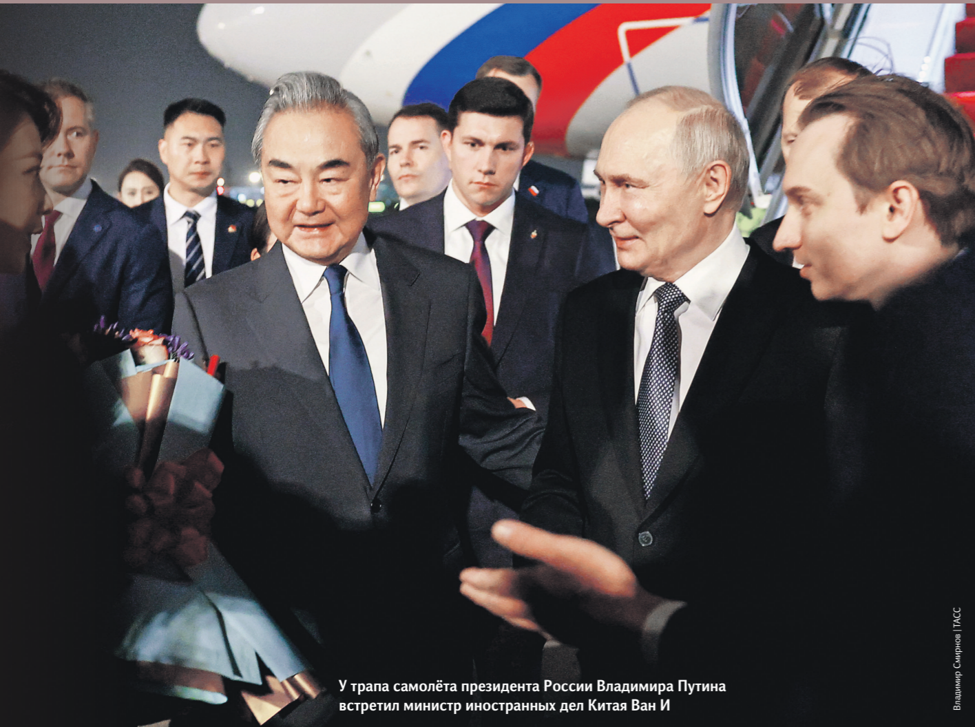
У трапа самолёта президента России Владимира Путина встретил министр иностранных дел Китая Ван И