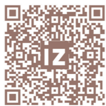
Полный текст читайте на iz.ru

Примечательно, что ранее Зелёнский публично отстрелился от Миндича, заявив, что «у президента воюющей страны не может быть друзей», ввёл против него санкции и поддержал расследование. Но в этот раз, в связи с делом Ермака, глава киевского режима молчит.