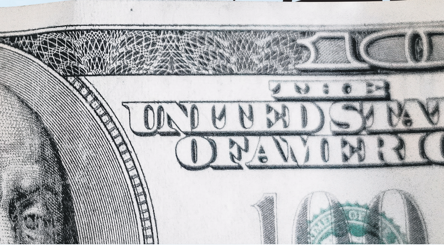
Павел Бушков / Иллюстрация