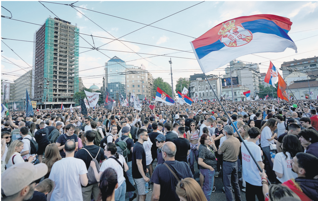
Студенческая антиправительственная акция в Белграде