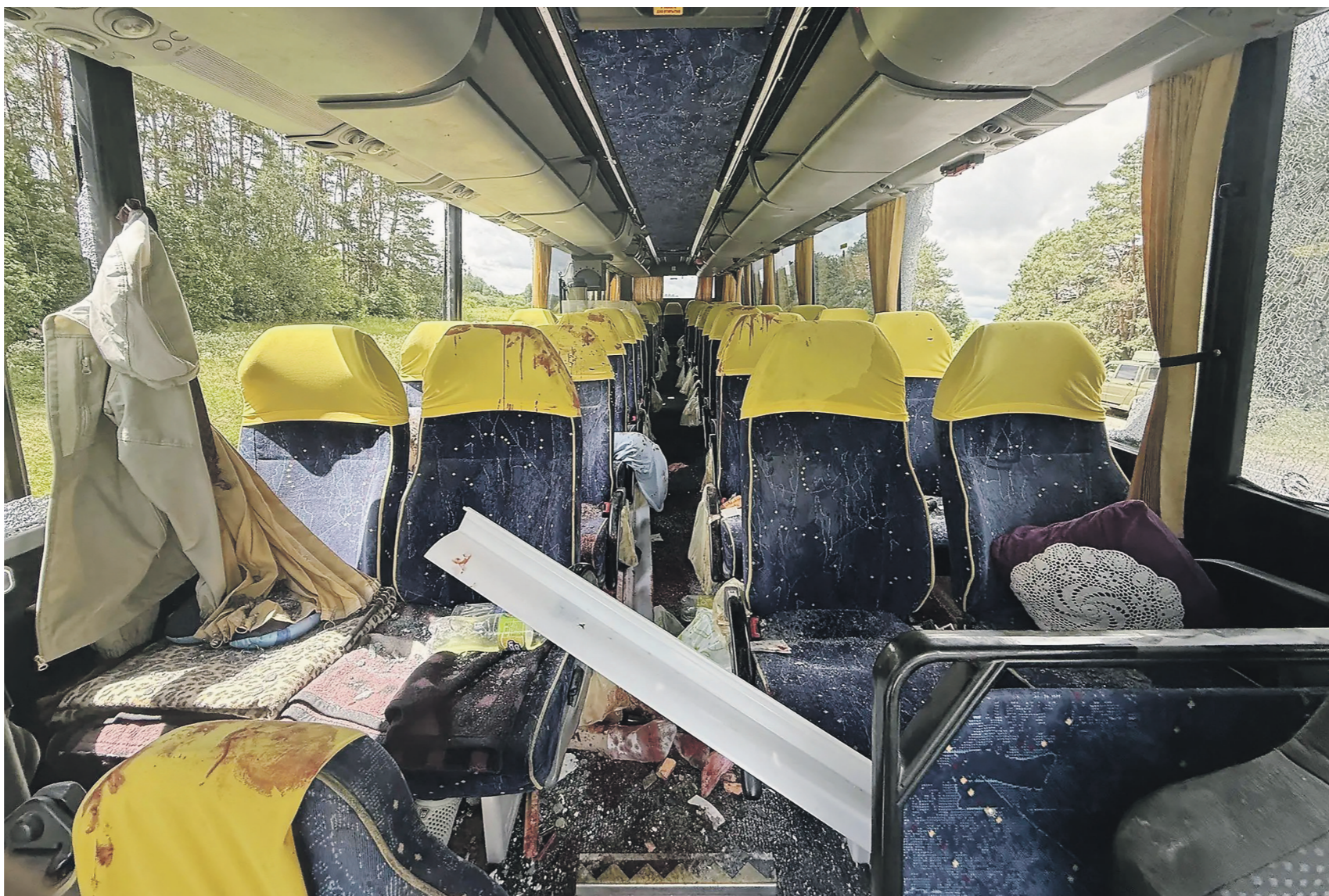
В результате атаки украинскими террористами автобуса с детьми погиб один человек, семеро ранены

Днём 17 июня на трассе А240 дрон ВСУ атаковал автобус, в котором в Геленджик ехала детская футбольная команда из Белоруссии. В результате удара погибла женщина, сопровождавшая команду. По последним данным минздрава Белоруссии, пострадали восемь человек, в том числе шестеро детей.