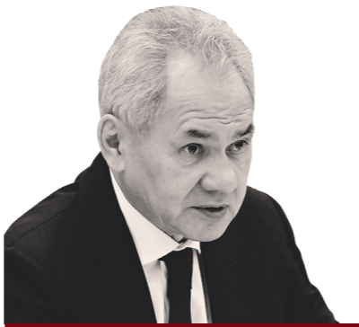
Сергей Шойгу Секретарь Совета безопасности России

По своей сути «цветные революции», которые в первой четверти XXI века существовали в виде изменений и продолжают менять расстановку сил на карте мира, являются совокупностью координируемых извне действий, направленных на смену неугодных политических режимов и дегуманизацию целей государств без прямого использования вооружённых сил. Подобные технологии и инструменты постоянно развиваются и адаптируются Западом под современные реалии.