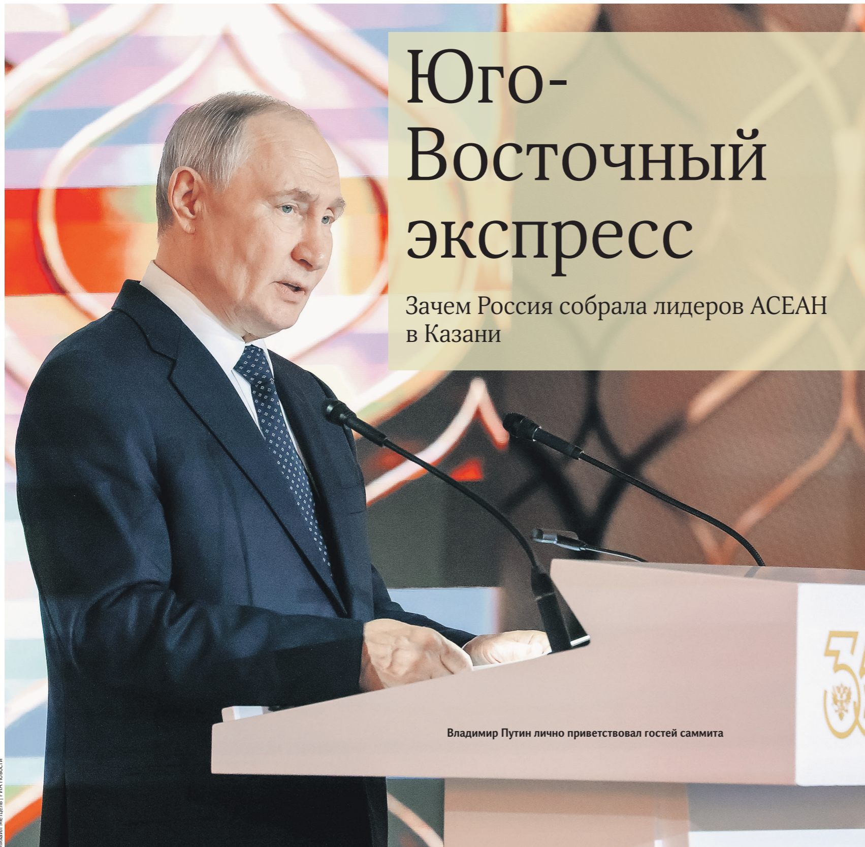
Владимир Путин лично приветствовал гостей саммита

Зачем Россия собрала лидеров АСЕАН в Казани