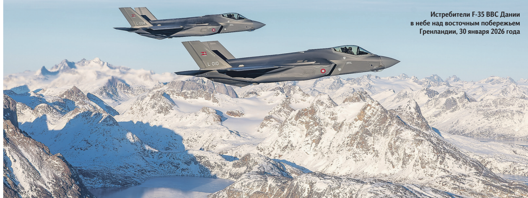
Истребители F-35 ВВС Дании в небе над восточным побережьем Гренландии, 30 января 2026 года

Второй уровень — военно-технический. Речь может идти об укреплении группировки Северного флота, развитии арктических аэродромов, систем ПВО и ПРО, усилении патрулирования в Северной Атлантике и Арктике, а также развёртывании дополнительных средств разведки, РЭБ и контроля над акваториями, где возможна активность сил НАТО, включая Баренцево и Норвежское моря.