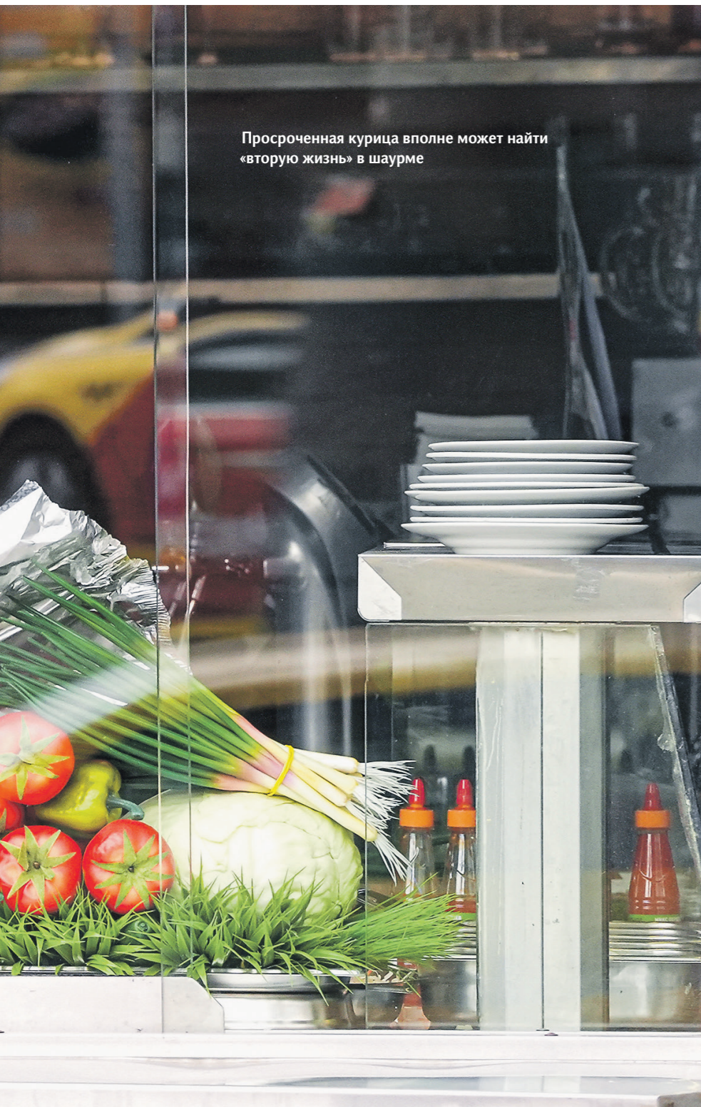
Просроченная курица вполне может найти «вторую жизнь» в шашурме

мана клиента киоскёру и баристе за работать непросто.