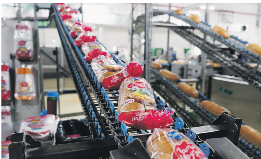
Завода Кориньяно | Известия

Из-за подорожания нефти в России произошло повышение цен на полиэтилентерефталат (или ПЭТ, из него изготавливают бутылки, контейнеры) и полистирол (целлофановые и вакуумные пакеты, плёнка). Об этом «Известиям» рассказали представители бизнеса. По словам источника на рынке готовой еды, стоимость такой тары увеличилась на треть. 06 →