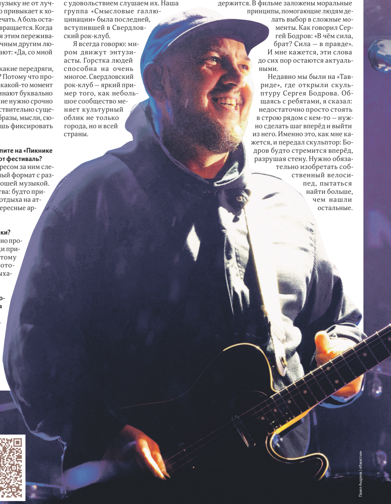
Павел Андреев / Иллюстрация

А со сцены в Вене в финале конкурса заявили, что новое «Евровидение Азия» запланировано на 14 ноября 2026 года в Бангкоке.