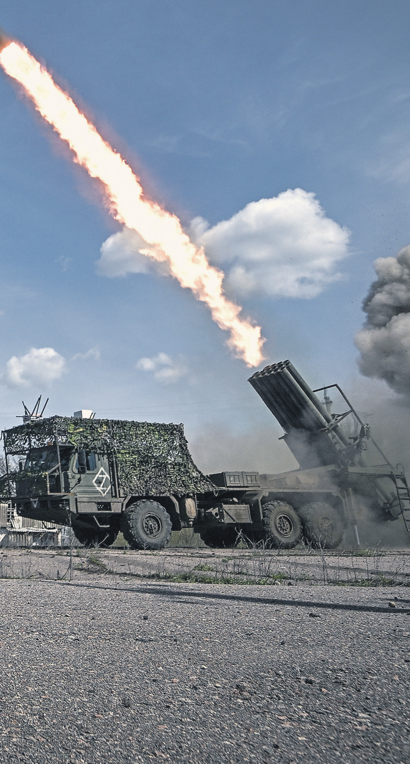
Сергей Федосеев / РИА Новости