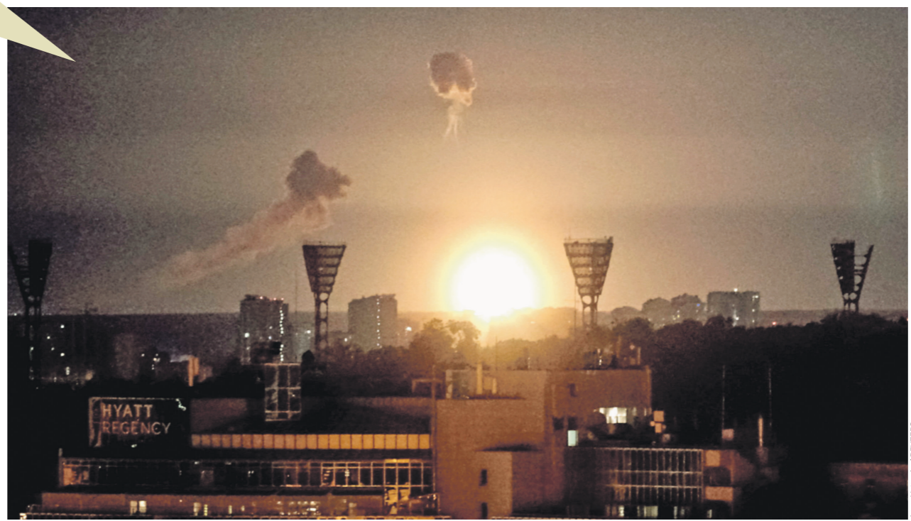
Киев, Украина.

Таким образом, беспилотники не просто наносят удары по целям, но и «расчищают» небо для последующих пусков ракет, создавая критический дефицит средств перехвата у ВСУ. Нынешняя интенсивность атак — это прямое подтверждение того, что ставка на развитие беспилотной авиации, сделанная руководством страны, даёт свои плоды на практике.