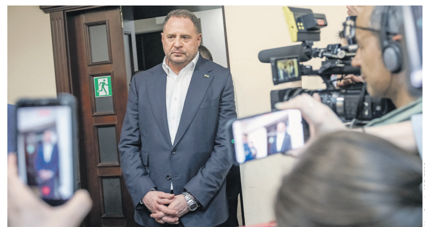
Бывшего главу офиса Зеленского Андрея Ермака отправили в СИЗО на два месяца

Но пока скандал не оказал существенного влияния на поддержку Киева ни со стороны Еврокомиссии, ни со стороны ведущих государств — членов ЕС, заметил Гуннар Бек. Вместе с тем ранее в СМИ сообщалось: Европейский союз затягивал выделение финансовой помощи Украине на сумму €90 млрд, в том числе требуя ужесточить борьбу с коррупцией.