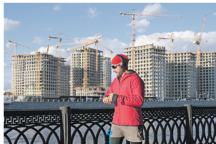
Александр Копылов / Иллюстрация

— Количество «пьяных» ДТП остаётся высоким: 196 аварий с участием нетрезвых водителей в 2025 году, в которых погибли 63 человека, — сообщил он.