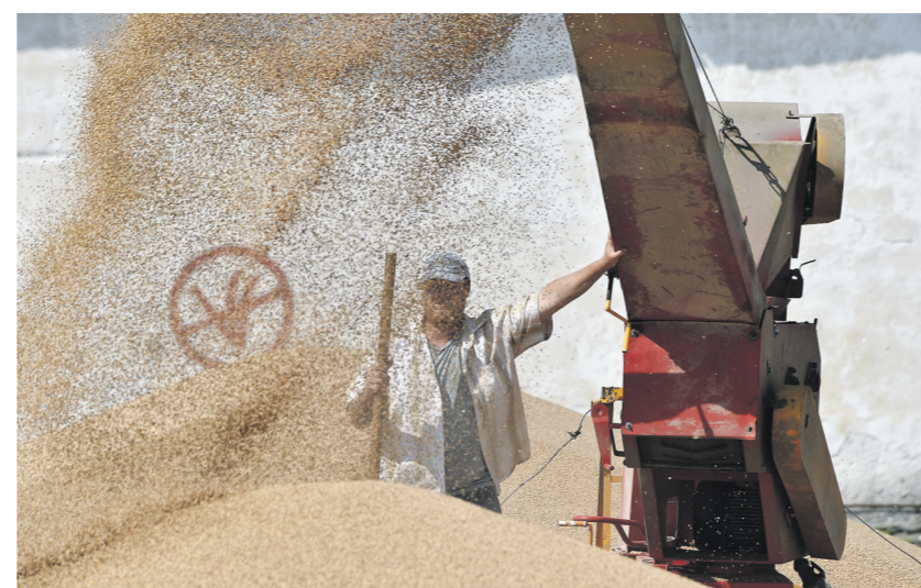
Александр Полягоцкий | «Известия»