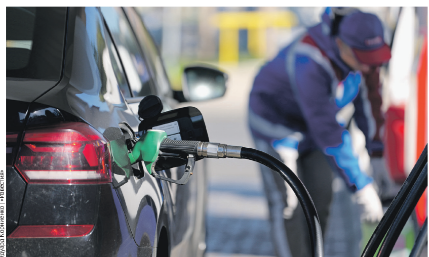
Эдуард Кореньков / Известия