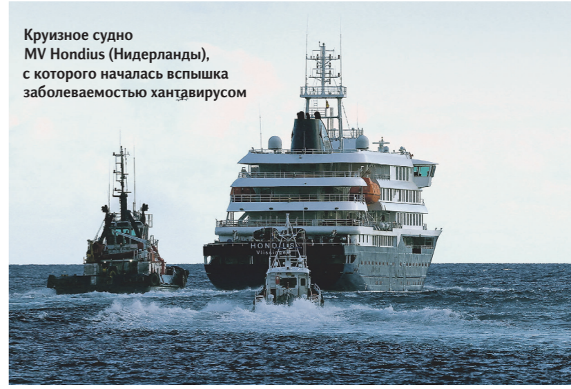
Круизное судно MV Hondius (Нидерланды), с которого началась вспышка заболеваемости хантавирусом