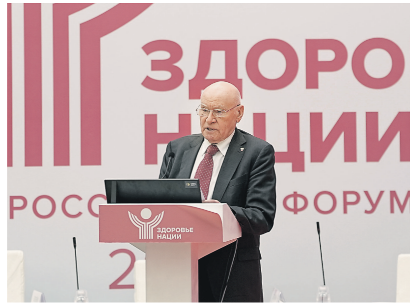
Главная задача — предупреждать болезни и продвигать ЗОЖ, заявил президент Лиги здоровья нации Лео Бокерия

Причины роста уровня ожирения среди населения России — высокая калорийность рациона, недостаточное употребление витаминов и минеральных веществ, овощей и фруктов, а также избыточное использование соли, констатировал и научный руководитель Федерального исследовательского центра питания и биотехнологии, главный внештатный специалист-диетолог Минздрава России, академик РАН Виктор Тутельян.