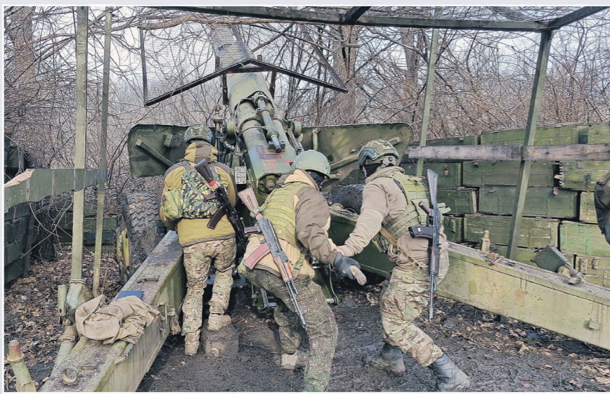
2А36 «Гиацинт-Б» — 152-мм буксируемая пушка

Тяжёлая артиллерия остаётся незаменимой против укреплений и техники — как работают расчёты «Гиацинтов» под Добропольем