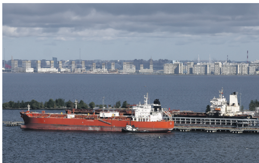
2 трлн рублей могут достичь сверхдоходы от продажи российской нефти в 2026 году