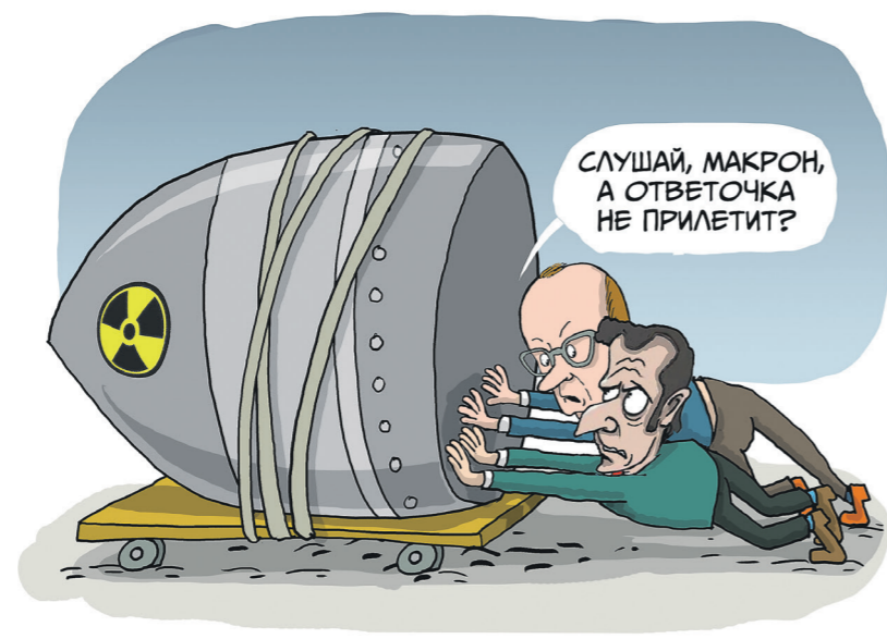
Николай Крутиков / «Известия»

Однако Париж и Лондон не намерены брать на себя ограничения в модернизации своих ядерных арсеналов. К слову, другая растущая ядерная держава — КНР — тоже не планирует присоединяться к возможному соглашению. Аргументы Франции, Великобритании и Китая схожи: их ядерные возможности серьёзно уступают по количеству российским и американским. Поэтому перспективы создания нового документа по стратегическим вооружениям пока крайне малы.