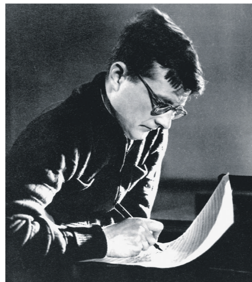
Дмитрий Шостакович всегда сочинял за столом, без фортепиано