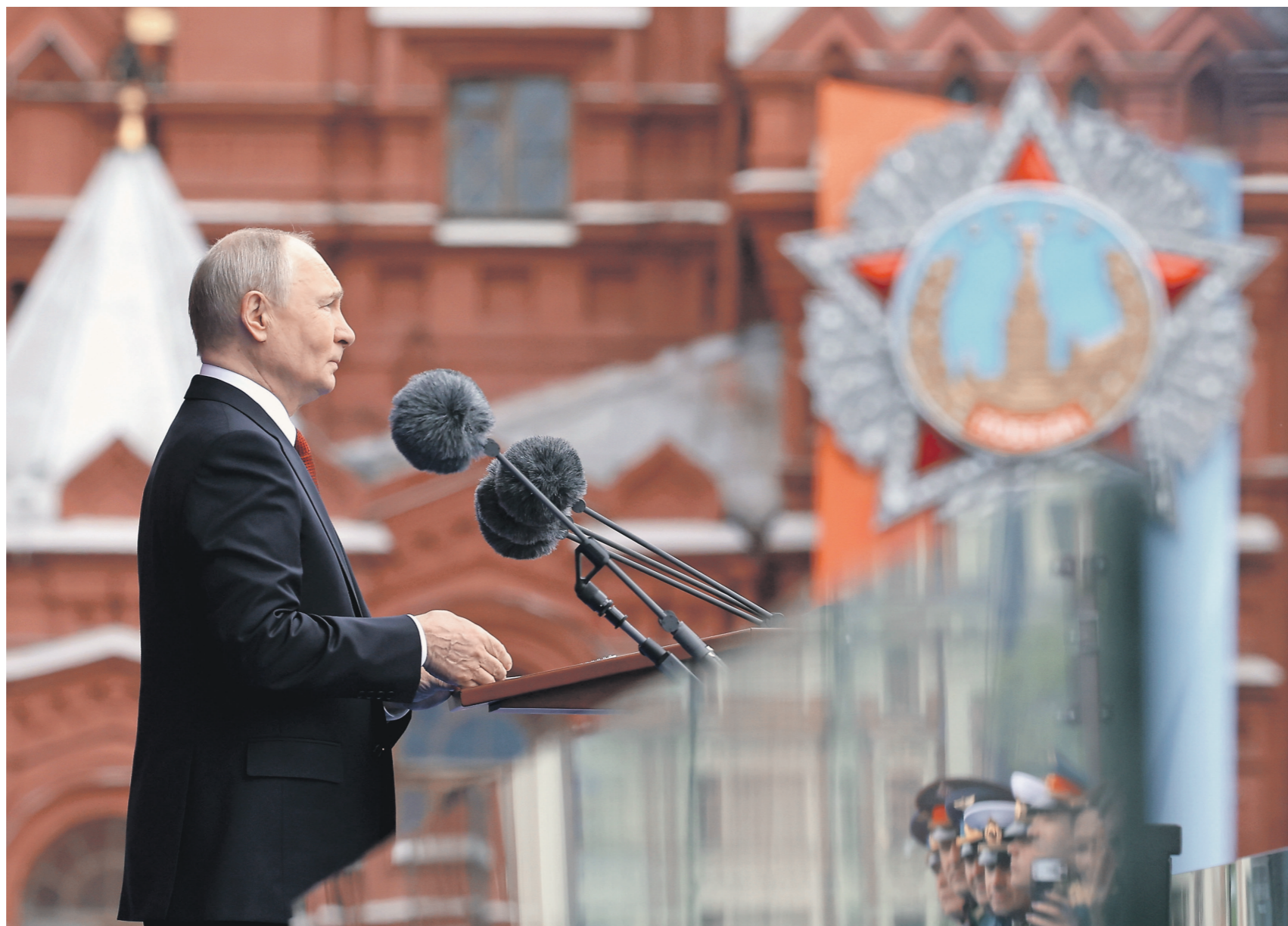
Киевский режим услышал предупреждение Кремля — провокаций во время парада не было