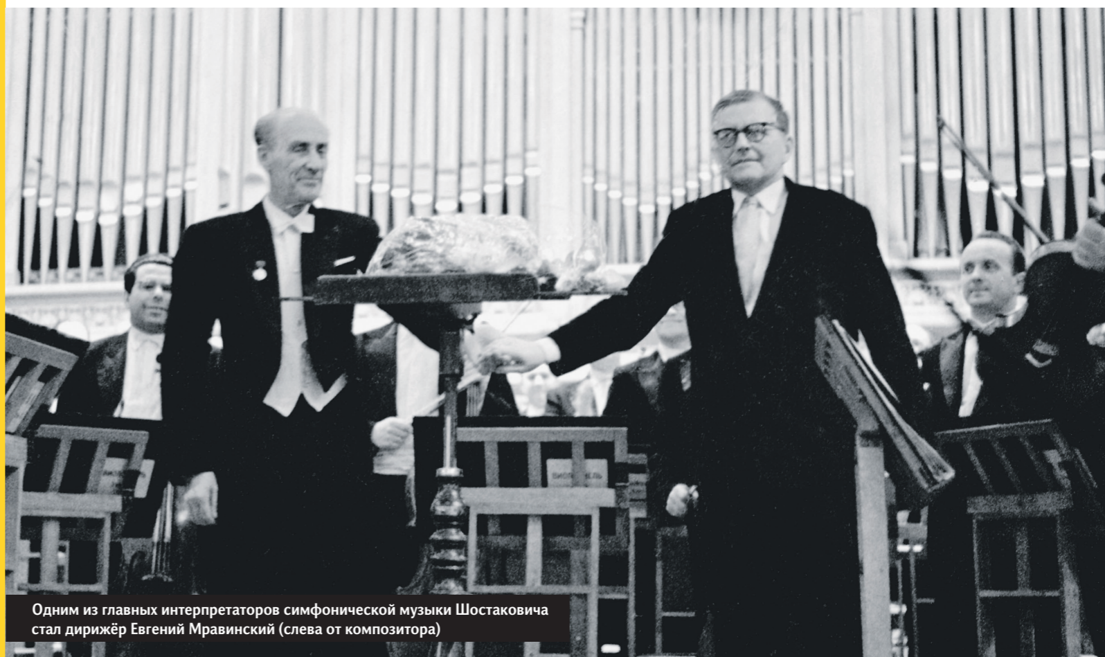
Одним из главных интерпретаторов симфонической музыки Шостаковича стал дирижёр Евгений Мравинский (слева от композитора)

Но именно поэтому «Соль. Легенда» выглядит не как обычный телевизионный конкурс, а как попытка вернуть в эфир живое электричество. Без пластика, стерильности и безопасных интонаций. Потому что рок, как выяснилось, никуда не исчез. Он просто ждал, пока кто-нибудь снова выкрутит усилители на максимум.