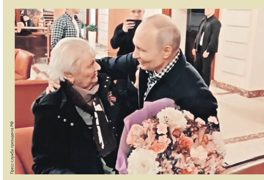
Павел Сидоров / РИА Новости