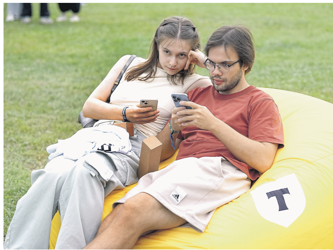
Павел Воронин / Иллюстрация

Сейчас законопроект об использовании искусственного интеллекта находится на стадии межведомственного согласования, отметил источник «Известий», знакомый с ситуацией. По его словам, планируется, что документ внесут в Госдуму до конца текущей весенней сессии, то есть до середины июля.