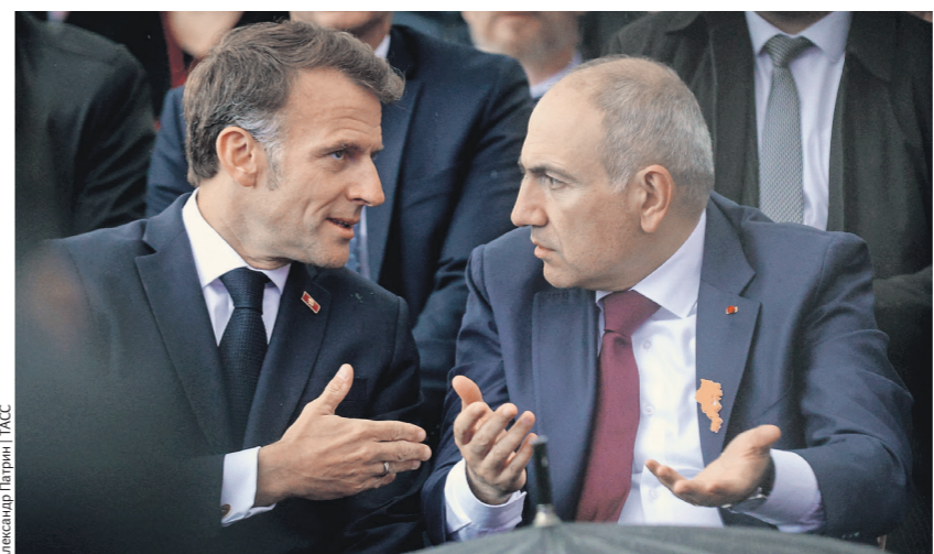
Макрон отрешивается от вмешательства во внутренние дела Армении, а говорит, что просто приехал «содействовать» Пашиняну

При этом эксперт подчёркивает: Армения вряд ли пойдёт по пути Молдавии, поскольку Ереван, в отличие от Кишинёва, имеет слишком тесные торговые, экономические и военные связи с Россией. Армения — активный член Евразийского экономического союза (ЕАЭС) и СНГ.