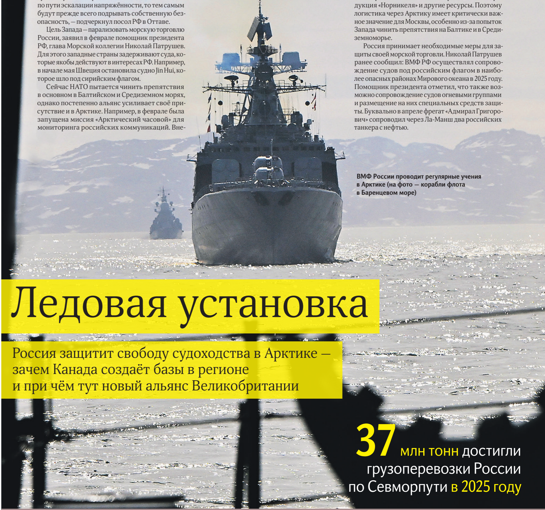
ВМФ России проводит регулярные учения в Арктике (на фото — корабли флота в Баренцевом море)

Судоходству РФ на Крайнем Севере больше угрожают европейские арктические члены НАТО и неарктические страны вроде Великобритании, чем Канада, которая удалена от Северного морского пути, заявил «Известиям» ведущий научный сотрудник Института США и Канады РАН Дмитрий Володин.