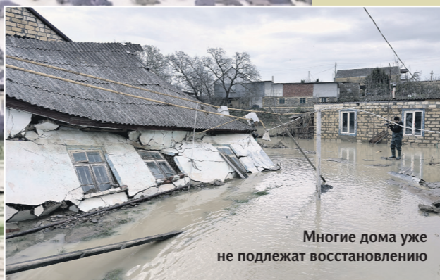
Многие дома уже не подлежат восстановлению

Глава государства дал необходимые поручения всем соответствующим ведомствам по оказанию помощи людям. Кроме того, Владимир Путин поручил провести 7 апреля совещание с участием представителей Дагестана, МЧС, других федеральных ведомств, чтобы детально обсудить положение в республике. Новые дожди стали причиной наводнения и обрушения моста на федеральной трассе «Кавказ» в селе Кала, сообщили 5 апреля власти региона. Спасатели вытащили из воды семь человек, которых унесло течением реки. Врачи не смогли реанимировать беременную женщину и 12-летнего ребёнка. Также после прорыва дамбы в районе села Геджух машину с пятью пассажирами смыло в канал. Погибли двое детей. В том же районе произошёл аналогичный случай с другой машиной — погибли пожилая женщина и её внучка. Тело ещё одной женщины обнаружили под завалами дома, рухнувшего