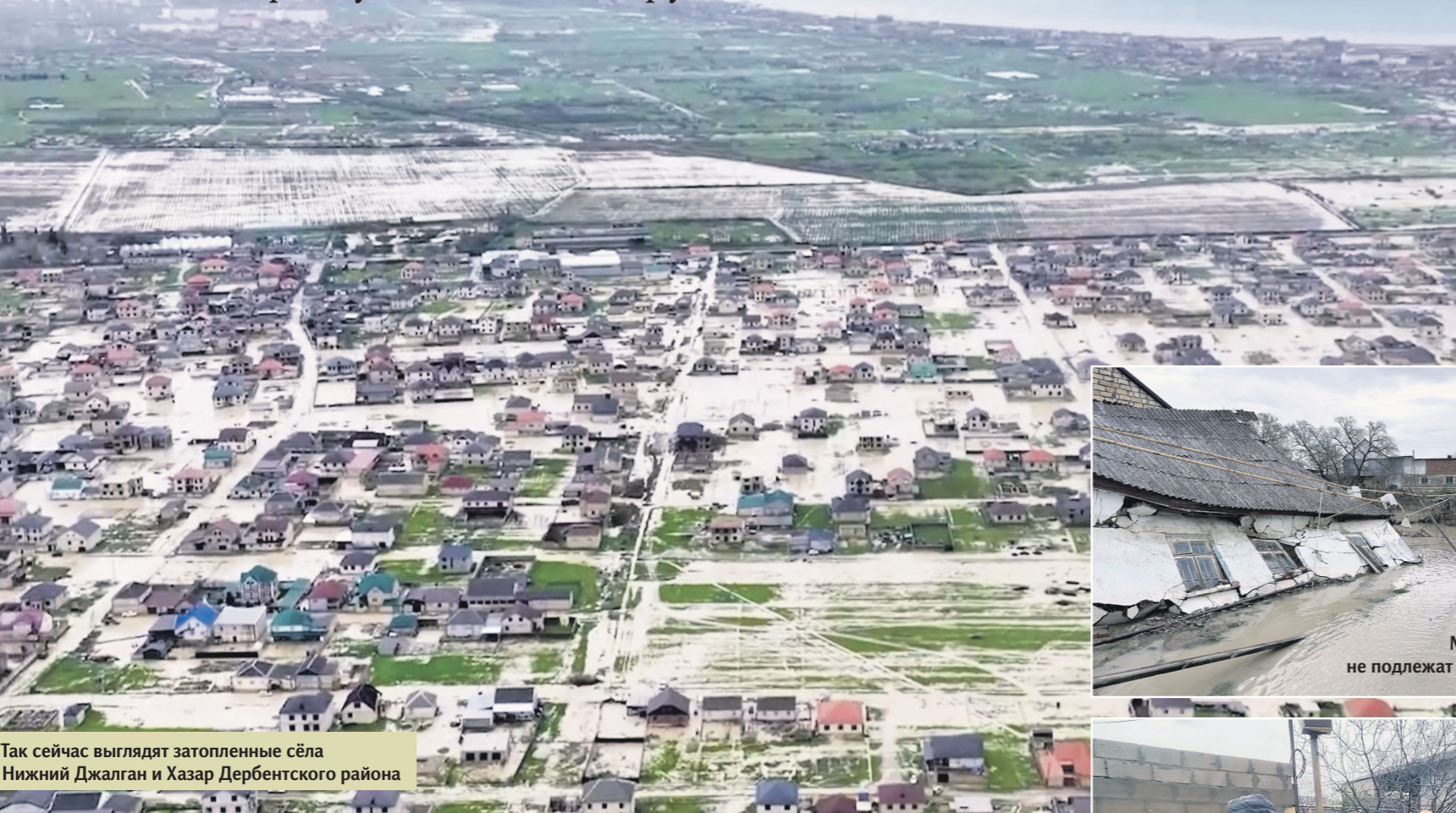
Так сейчас выглядят затопленные сёла Нижний Джалган и Хазар Дербентского района

Наводнение в Дагестане унесло жизни восьми человек — когда закончатся ливни и как в республике ликвидируют последствия стихии