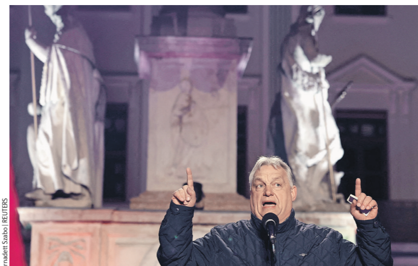
У Виктора Орбана весьма высокие шансы вновь возглавить Венгрию

Обозначившиеся последствия ударов по иранской и российской нефтегазовой инфраструктуре для мировой энергетики ещё раз подтверждают уже давно известную истину: безопасность в современном мире остаётся неделимой. Неделимой как в пространстве, так и во времени. Неделимость безопасности в пространстве означает, что нельзя изолировать региональный конфликт границами одного региона мира, конфликт неизбежно влечёт за собой множественные глобальные последствия. Неделимость безопасности во времени предполагает, что безопасность (военно-стратегическую, энергетическую, продовольственную и любую другую) нельзя обеспечить за счёт ситуативных тактических шагов, оставляя на неопределённое будущее подчас болезненные, но совершенно необходимые стратегические решения.