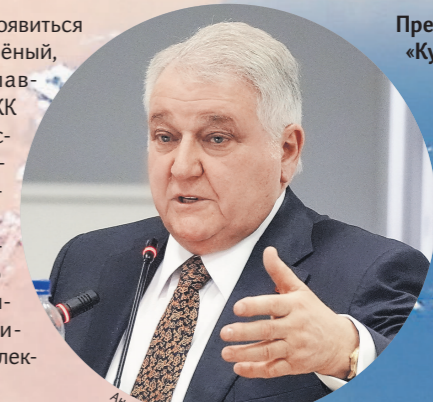
Президент НИЦ «Курчатовский институт» Михаил Ковальчук

где производят все типы исходных порошков для 3D-печати. Также разрабатывают оборудование и технологии, необходимые для этих целей. Отдельно рассматривается вопрос размещения на РОС оборудования для изготовления с помощью аддитивных технологий деталей и узлов для ремонта станции. По словам учёного, выращивание материалов в космосе позволит использовать условия глубокого вакуума и микрогравитации — состояния, близкого к невесомости, чтобы получить белковые кристаллы иде-