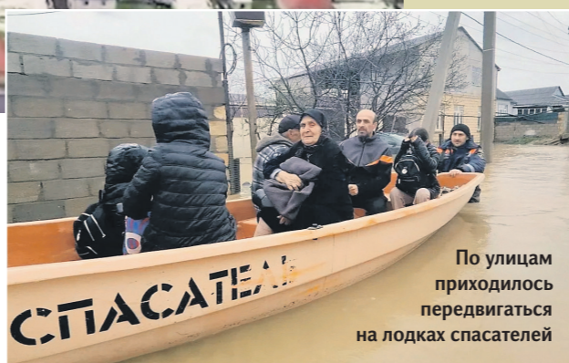
По улицам приходилось передвигаться на лодках спасателей