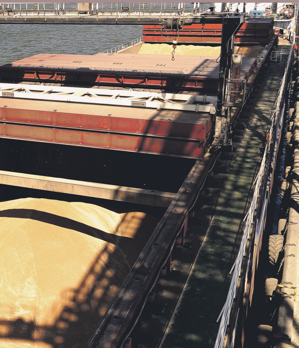
Стивен Вильямс | Иллюстрация

на севере Суэцкого канала. Айн-Сохна ценна как южный, красноморский вход в египетскую логистику. Думьят выглядит сильным кандидатом из-за уже готовой зерновой инфраструктуры: у порта есть специальные причалы, глубоководные подходы, значительные площади под склады, а также канал для барж, связанный с рукавом Нила. Это важно не только для морской разгрузки, но и для вывоза зерна вглубь страны.