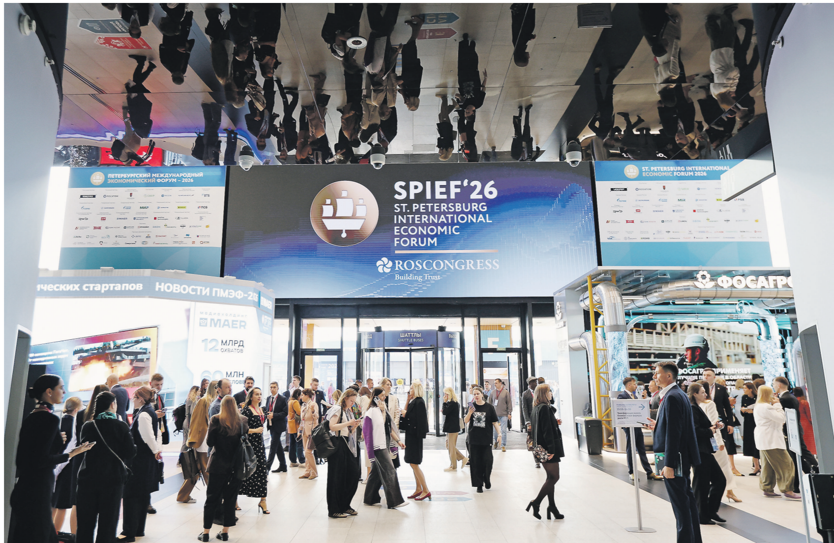
Евгений Грачев / Иллюстрация