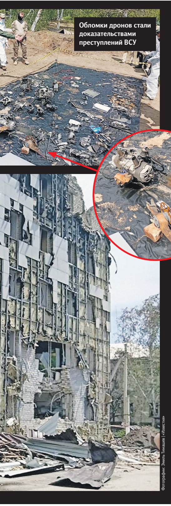
Обломки дронов стали доказательствами преступлений ВСУ

Москва настаивает на выводе украинских войск с территорий России, в то время как Киев хочет вначале зафиксировать существующую линию соприкосновения сторон, а уже затем вести полноценные переговоры. Официальный представитель Кремля Дмитрий Песков ранее заявил: конфликт на Украине можно завершить «до конца текущих суток», если Зеленский отдаст приказ войскам покинуть территорию российских регионов.