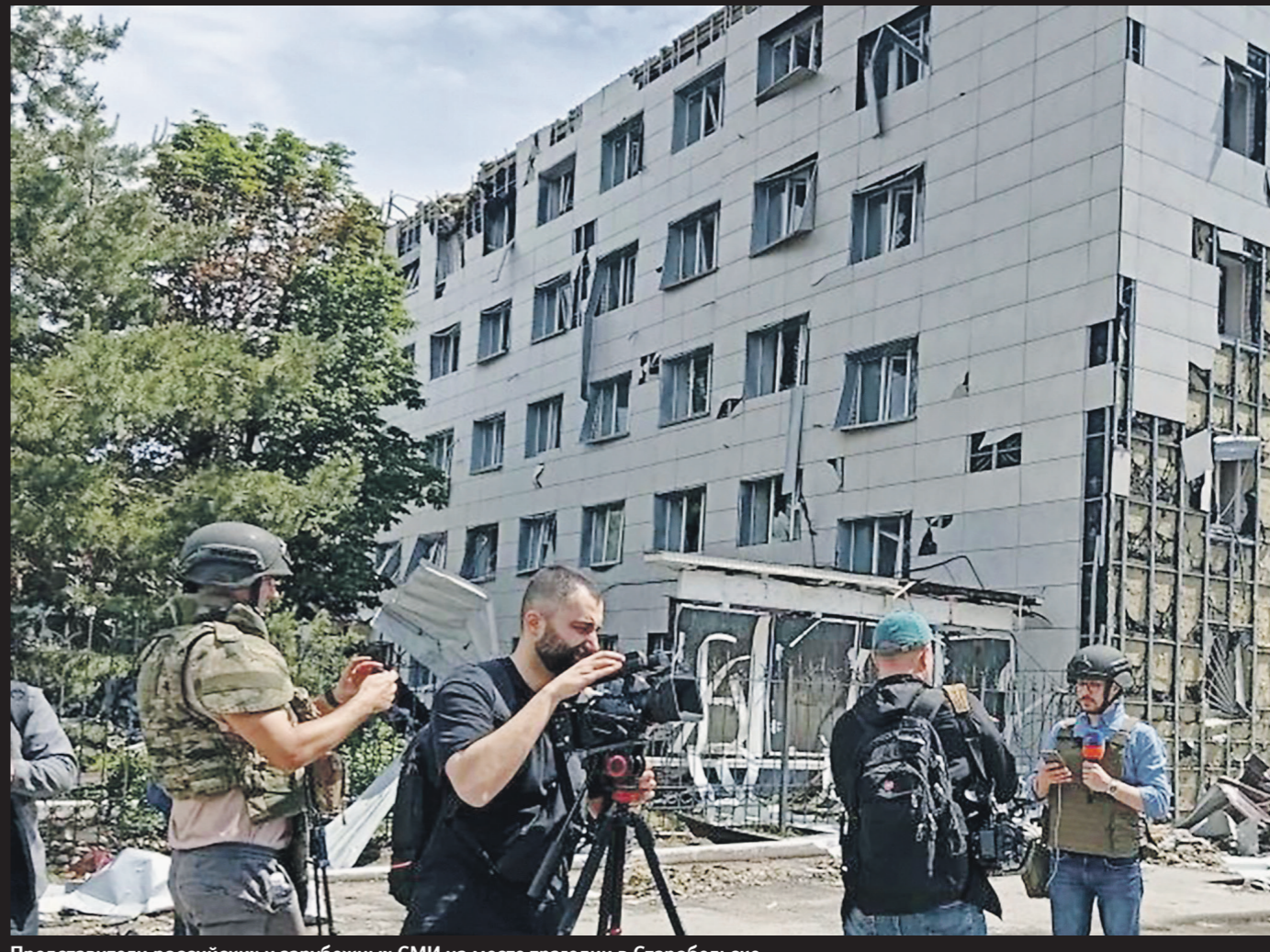
Представители российских и зарубежных СМИ на месте трагедии в Старобельске

РФ работает над трибуналом для украинских военных преступников, Киев усиливает атаки по российским гражданским объектам — как реагирует Москва в условиях паузы в переговорах