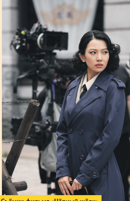
Съёмки фильма «Чёрный шёлк»