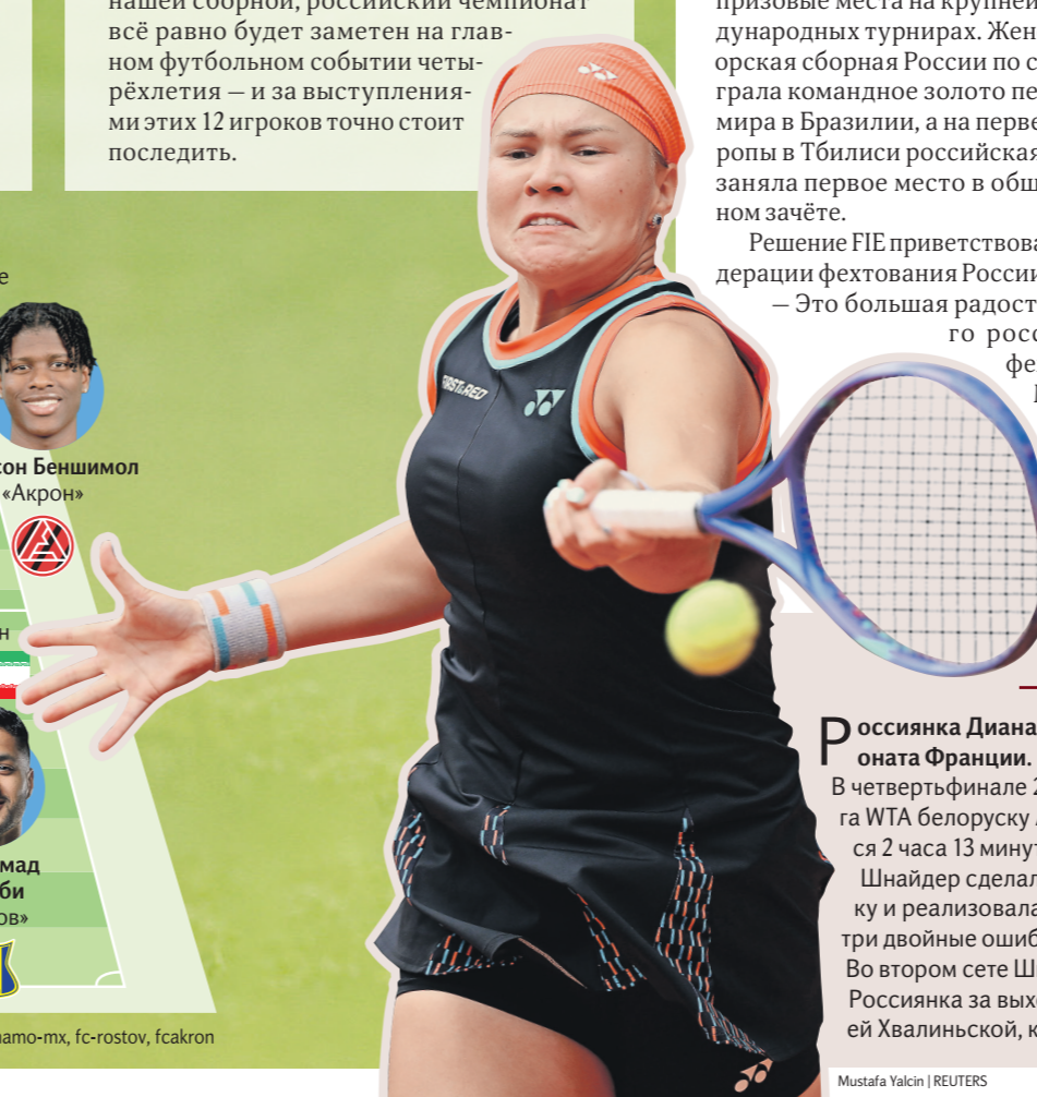
Mustafa Yalcin | REUTERS

Россиянка за выход в финал «Ролан Гаррос» сыграет с полькой Майей Хвалинской, которая победила Анну Калинскую.