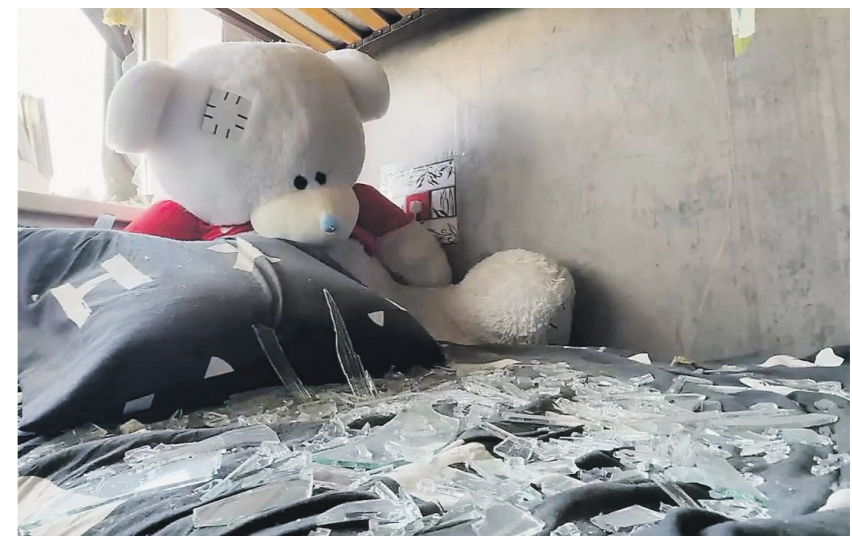
Элина Ткаченко / Иллюстрация

На этой неделе ВСУ также атаковали на железнодорожной станции Джанкой в Крыму пассажирский поезд «Таврида», следовавший в Санкт-Петербург. 02 →