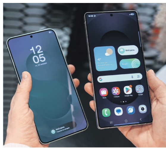
Эльдар Муртазин / Иллюстрация

S25 Ultra — лучший смартфон на Android по качеству съёмки видео, особенно на разных фокусных расстояниях (Samsung по этому параметру превосходит китайских конкурентов), но проигрывает качеству съёмки фото, считает главный редактор портала Fedra.ru Евгений Харитонов.