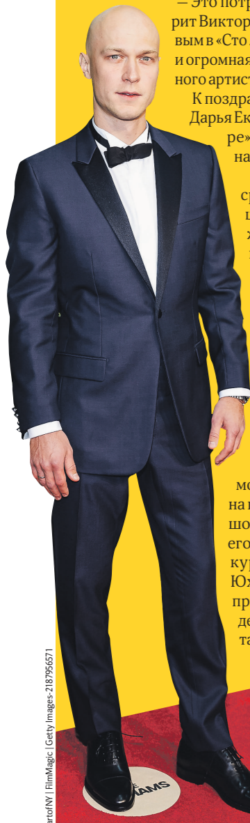
TheShowerman/NT Film/Instagram; Getty Images; 2019/50571