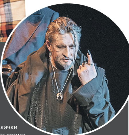
Центральная задвижка: Витер Российский Фрэнк

Текст Булгакова очень кинематографичен. Действие его переносится из СССР на 2 тыс. лет назад и обратно. Но как такие