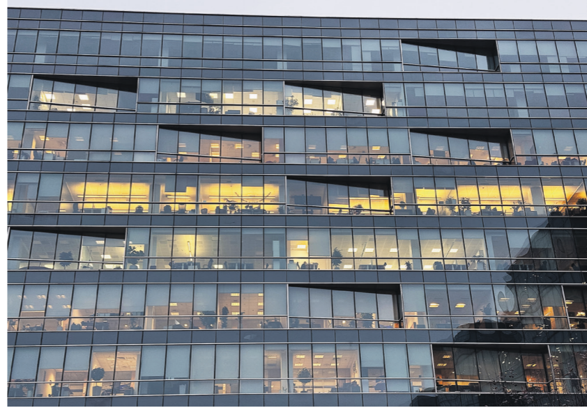
Виктор Бонин / Иллюстрация

— Такие помещения хоть и позиционируются при продаже как офисы, но больше подходят под кофе на вынос, если расположены на первом этаже, а также для мини-склада или просто для регистрации юридического адреса, — сказала она.