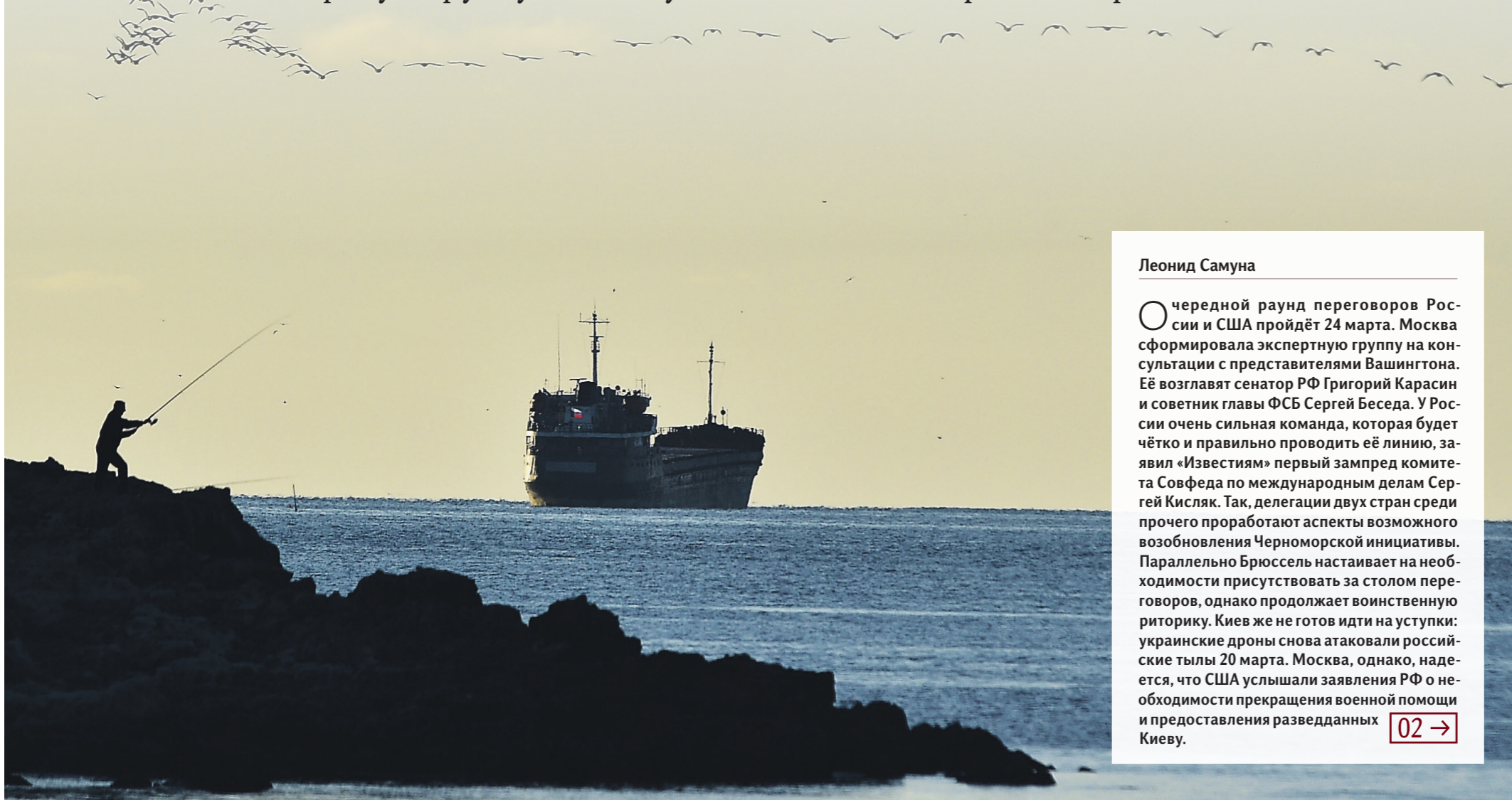
Одна из тем встречи в Эр-Рияде — возможность возрождения Черноморской инициативы, означающей безопасный экспорт зерна и удобрений

Чего будет добиваться Москва на встрече с США в Эр-Рияде — кто вошёл в экспертную группу и почему её состав так не нравится противникам России