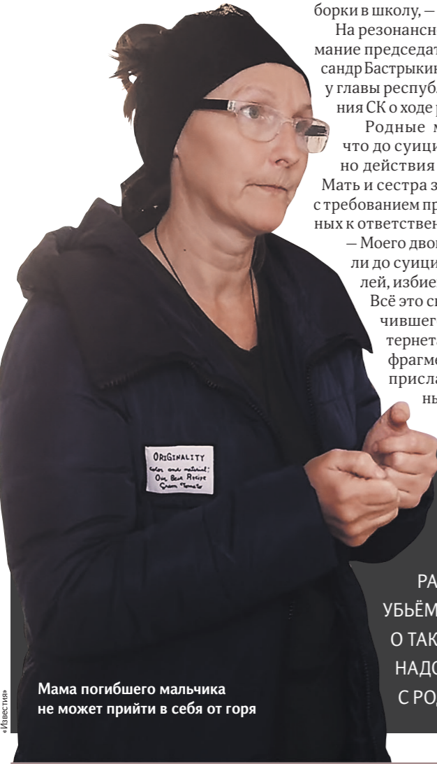
Мама погибшего мальчика не может прийти в себя от горя

Для защиты эксперт рекомендует организациям внедрять квантовоустойчивое шифрование, регулярно тестировать системы на предмет аппаратных закладок и создавать резервные хранилища данных для распределения рисков.