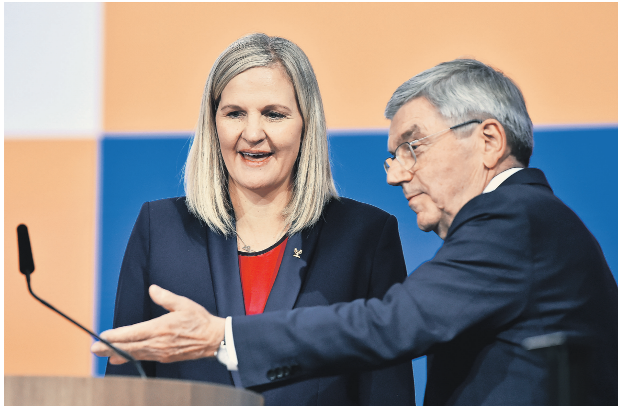
Кирсти Ковентри стала десятым президентом МОК (на фото со своим предшественником Томасом Бахом)

— Это необыкновенный момент, — заявила с трибуны Кирсти Ковентри. — Будучи девятилетней девочкой, я никогда не думала, что однажды буду стоять здесь и отдавать дань этому нашему невероятному движению. Это не только огромная честь, но и напоминание о моём обязательстве перед каждым из вас, что я буду руководить этой организацией с такой гордостью, с ценностями в основе, и я сделаю так, чтобы все вы очень, очень гордились и, надеюсь, были уверены в решении, которое вы приняли сегодня. Благодаря вам от всего сердца, а теперь нам предстоит поработать вместе. И я хотела бы поблагодарить кандидатов. Гон-