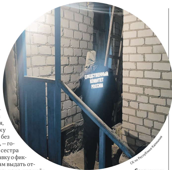
Сотрудники Следственного комитета во дворе дома, где произошла трагедия

Кроме того, по его словам, по факту избивания может быть возбуждено уголовное дело о причинении вреда здоровью.