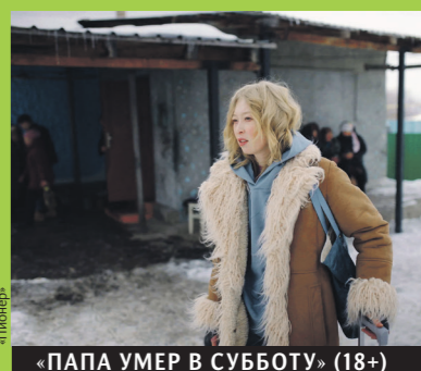
«ПАПА УМЕР В СУББОТУ» (18+)

Главная героиня — одинокая женщина, московский гримёр Айко. Она возвращается в родной Казахстан на похороны отца, который когда-то издевался над её матерью, а после ушёл к молодой жене. Дома