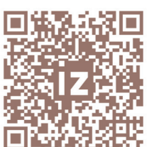
Полный текст читайте на iz.ru

— Испытание медными трубами происходило у меня таким обра-