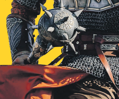
Полный текст читайте на iz.ru