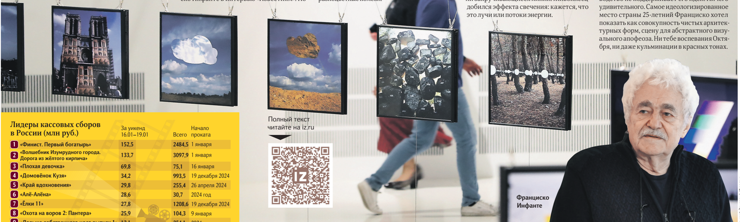
Полный текст читайте на iz.ru

Более 400 работ, многие из которых — фотографии и фотоколлажи (впрочем, необычные), заняло самое большое выставочное пространство Третьяковской галереи, превратив его в тотальную инсталляцию: шестидесятилетнее размышление о тайнах природы, связи естественного и рукотворного. Именно так можно кратко описать масштабную ретроспективу Франциско Инфанте — первый выставочный проект ГТГ в новом году. И символично, что посвящён он творчеству живого классика. «Известия» оценили экспозицию в числе первых.