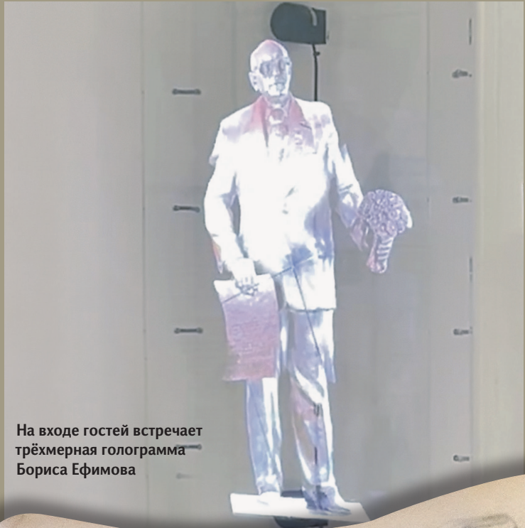
На входе гостей встречает трёхмерная голограмма Бориса Ефимова