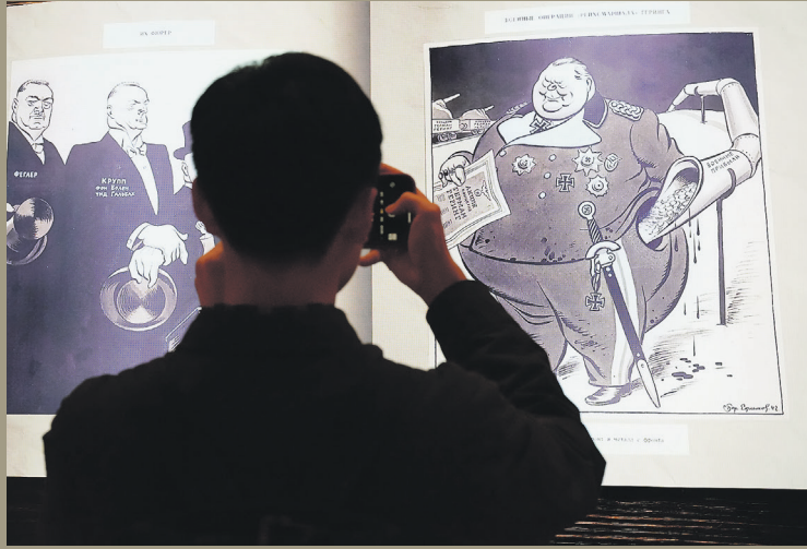
Центральный экспонат — уникальный альбом «Гитлер и его свора»