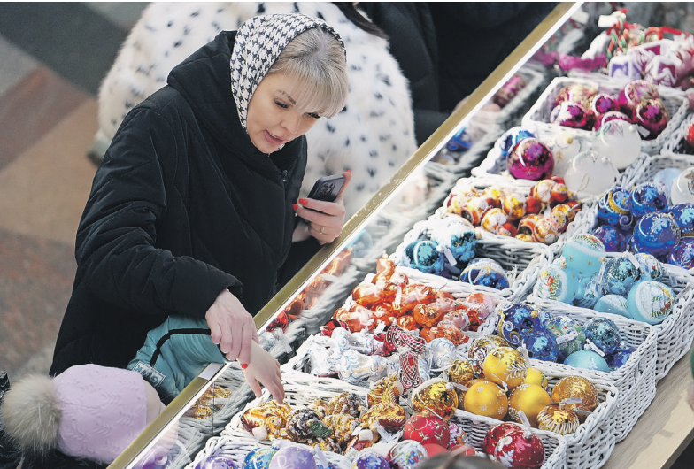
Лидеры продаж — стеклянные ёлочные игрушки в стиле ретро

Кроме того, одним из трендов этого года стали половинки искусственных ёлок, предназначенные для размещения в маленьких квартирах. Множество таких объявлений появилось на маркетплейсах. Цена — около 8 тыс. рублей.