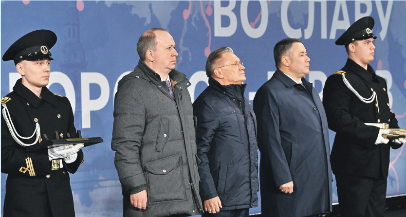
Главе «Росатома» Алексею Лихачёву (в центре) была передана капсула с землёй с Мамаева кургана — она будет храниться на ледоколе

Мы воевали, чтобы у вас, ваших детей, внуков и правнуков всег-