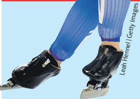
Lean Hemei / Getty Images