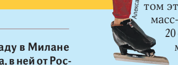
Александр Рокан / ТАСС