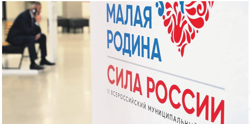
Масштабирование ГРА Новости

«Цель одна — повысить эффективность местной власти, самой близкой к людям, чтобы все вопросы решались оперативно, а качество жизни в городах и сёлах росло. Эффективно решать задачи можно лишь при тесном взаимодействии всех уровней власти, и выстраивание такой системы ведёт Всероссийская ассоциация развития местного самоуправления. Неважно, работаем мы в небольшом селе или в городе-миллионнике — всех нас объединяет слу-