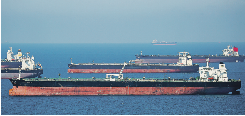
Выгнать Индия ГРА Новости

За последние пять лет товарооборот России и Индии вырос почти в семь раз, заявил в конце этого августа первый вице-премьер РФ Денис Мантуров. Нью-Дели входит в тройку крупнейших внешнеторговых партнёров Москвы. За первое полугодие 2025-го товарооборот достиг $69,2 млрд, утверждает