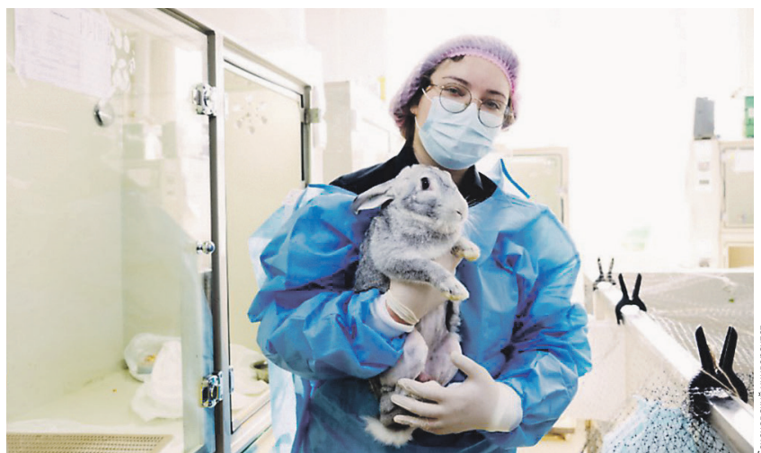
Ухо кролика способно восстанавливаться после травмы без рубца

ся в молоке и слёзной жидкости, — способен ускорять органотипическую регенерацию, то есть качественное безрубцовое восстановление ткани, максимально приближенное к её исходной структуре. Пока речь идёт об ушной хряще, однако потенциально с помощью лактоферрина можно добиться восстановления и других типов тканей, рассказали «Известиям» учёные. В поисках решения исследователи использовали в качестве модели эластичный хрящ ушной раковины кролика. Этот тип ткани — редкий пример у млекопитающих, где при определённых условиях возможно полное качественное восстановление без рубца. Команда продолжила предыдущую работу по установлению необходимых условий для регенерации, проведя поисковое