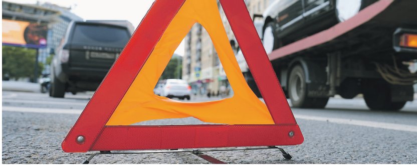
Андрей Зарулин / Иллюстрация

← 01 Кроме того, решено вдвое увеличить территориальный коэффициент для регионов из «красной зоны». В неё входят субъекты с большим количеством недобросовестных действий, например мошенничеств. Сейчас в перечне ЦБ их только два — Ингушетия и Новосибирская область.