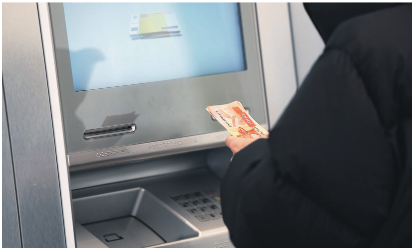
Дмитрий Корнеев / Известия

Это могут быть сети платёжных терминалов, пункты приёма платежей или операторы, подключающие торговые точки и онлайн-сервисы к банку, пояс-