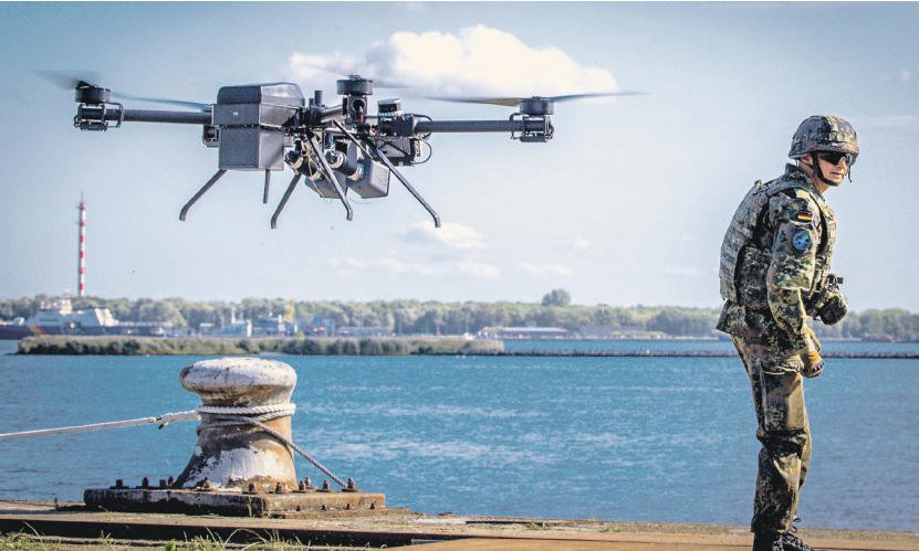
€10 млрд планирует потратить Германия на беспилотники атакующего и защищающего типов в ближайшее время

При этом ранее в СМИ писали, что канцлер Фридрих Мерц был недоволен идеей с беспилотниками. По информации Politico, на саммите в Дании он резко раскритиковал предложение профинансировать проект из европейских фондов. Министр обороны Германии Борис Писториус, хотя и поддержал «стену дронов», отметил, что её создание далеко не в приоритете. Берлин скорее стремится в целом развивать про-