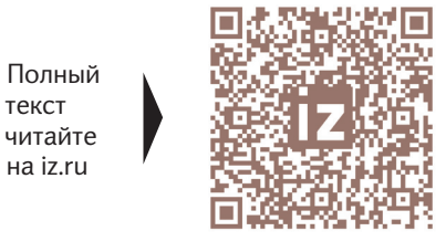
Полный текст читайте на iz.ru

Для наращивания военной мощи ЕС одобрил выделение €150 млрд. Кроме того, предлагается создать совместно с Европейским инвестиционным банком фонд в размере €1 млрд для поддержки оборонных проектов.