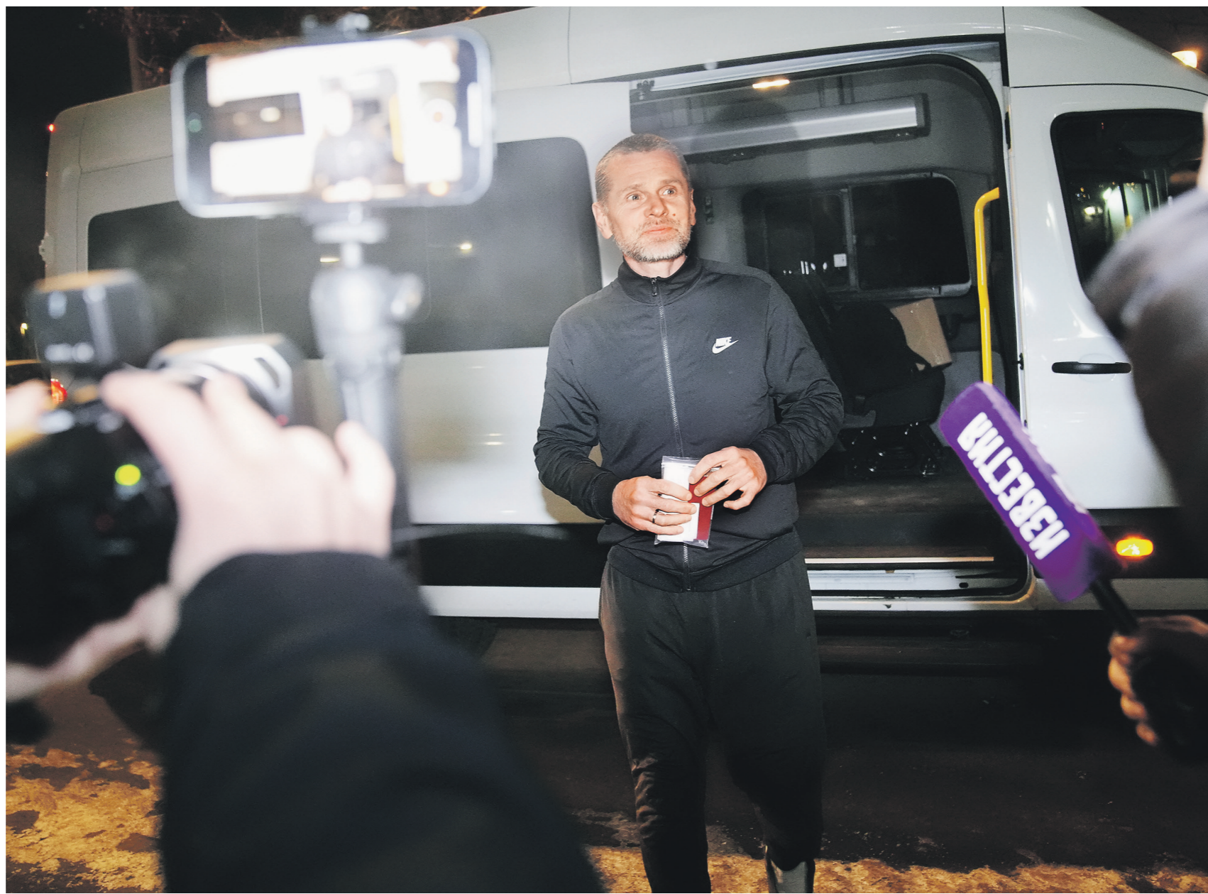
Сергей Виноградов / Известия

Тем временем в социальных сетях распространили информацию о том, что с территории США в РФ направляется американский борт, который заберёт ещё одного гражданина Штатов, чьё имя пока не называется. 02 →