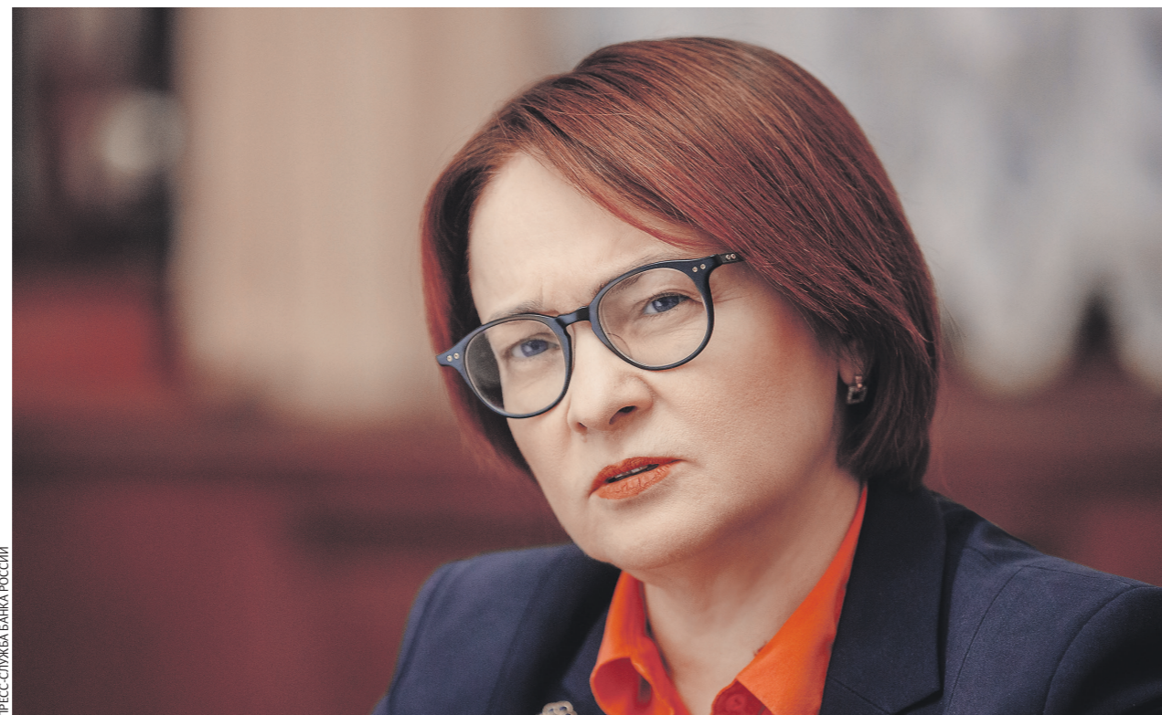
Глава ЦБ Эльвира Набиуллина назвала идею блокировки депозитов граждан бессмыслицей

Тогда свою позицию выражала и глава ЦБ Эльвира Набиуллина. Выступая в Госдуме, она назвала идею блокировки бессмыслицей и подчеркнула, что банки достаточно обеспечены доходами, чтобы расплатиться со вкладчиками.