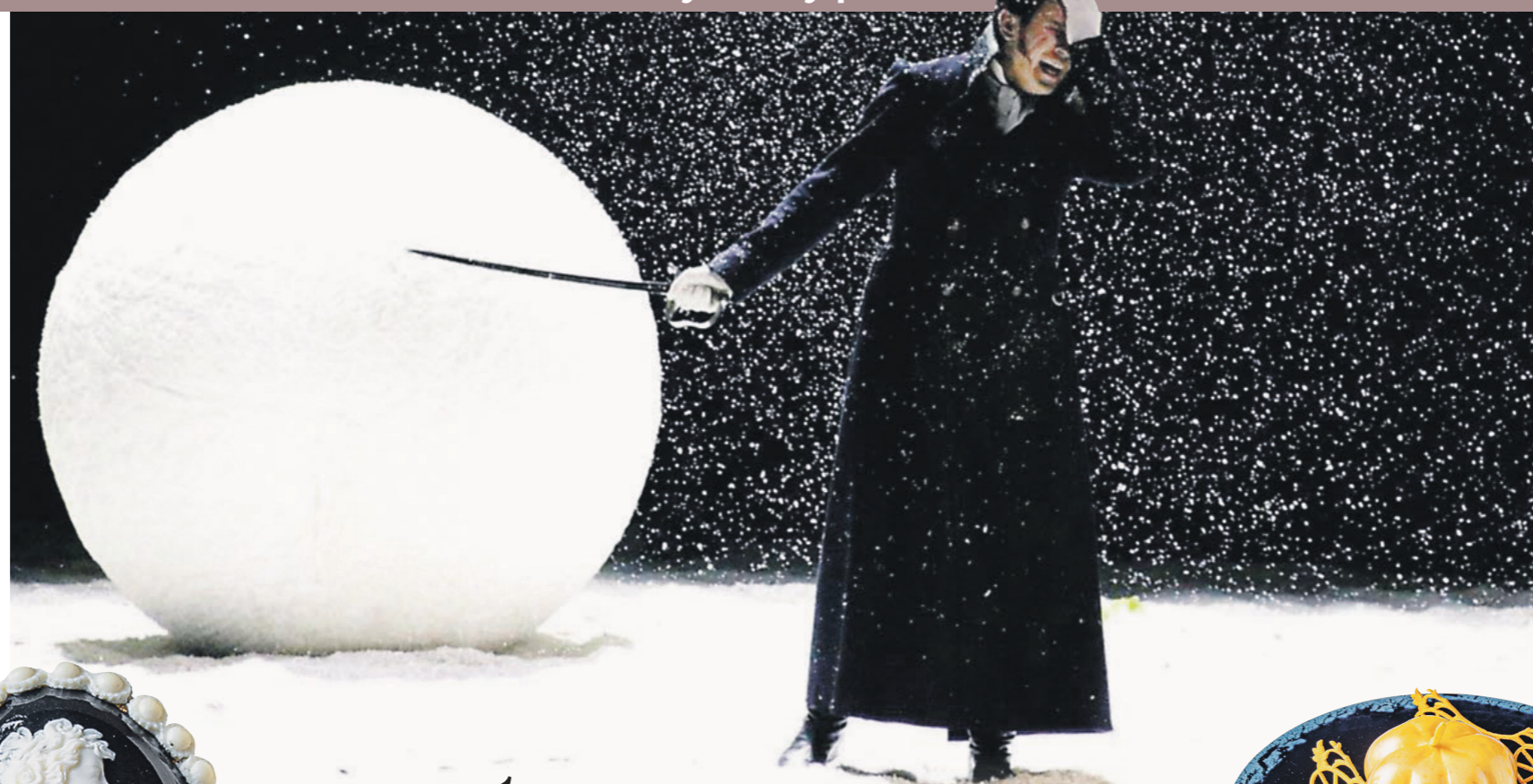
Иллюстрация: Юлиан Сорокин