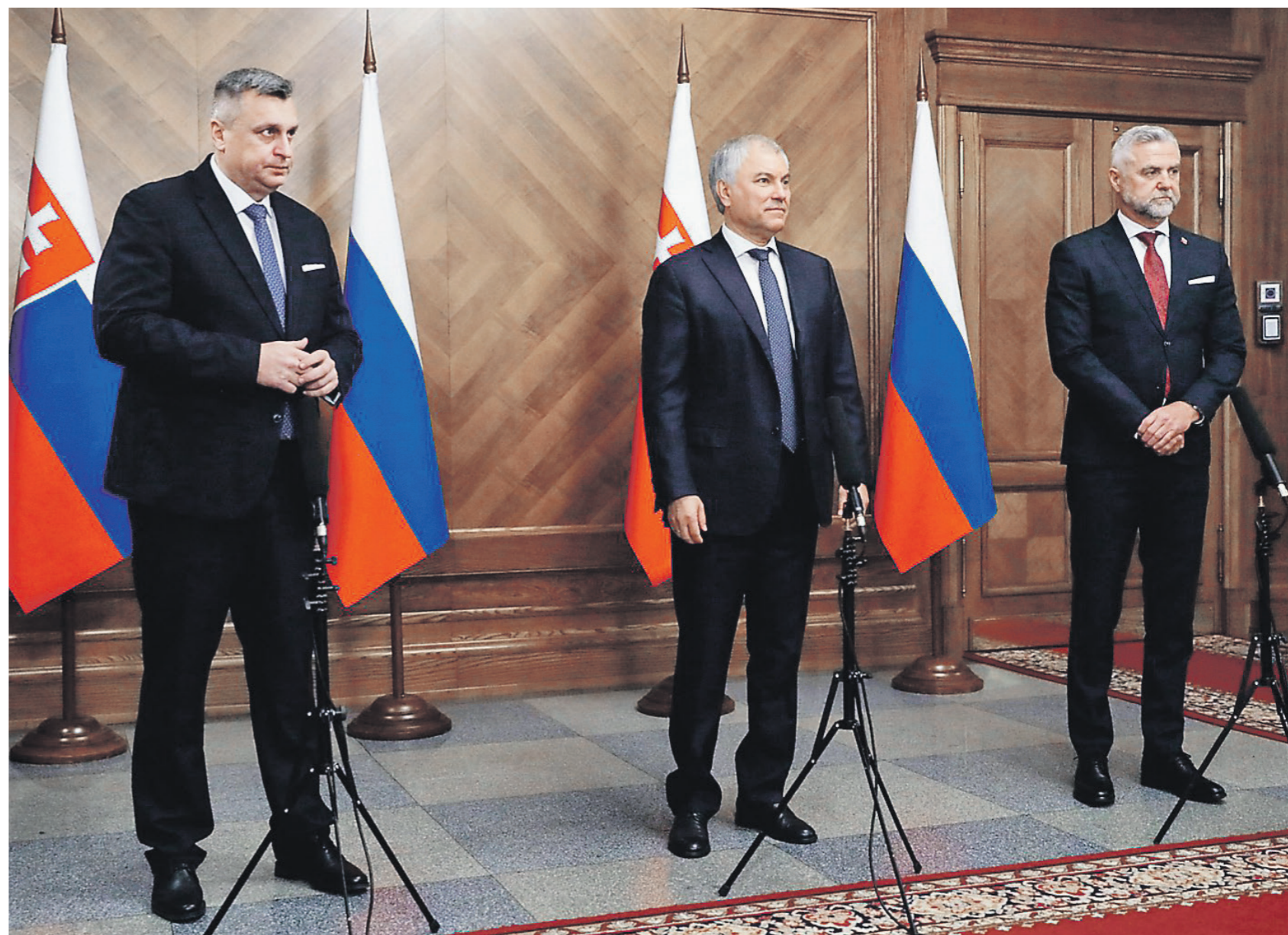
Заместитель председателя национального совета Словакии Андрей Данко, председатель Госдумы РФ Вячеслав Володин и заместитель председателя парламента Словакии Тибор Гашпар (слева направо) во время встречи в Москве

— Трофеев было много, потому что они бросали оружие, они бросали свою форму, передевались в гражданку и уходили, пытались как-то спастись. Их обучение — западные какие-то курсы. Но Англия им не помогла и не поможет. России не нужно чужие земли, мы пришли за своим, это наша земля, Донбасс — это часть России и вся Малороссия, Новороссия. Это часть России, за которую гибли наши предки. И я думаю, что рано или поздно справедливость восторжествует и мы войну эту закончим нашей победой, — завершил свой рассказ Боксёр.