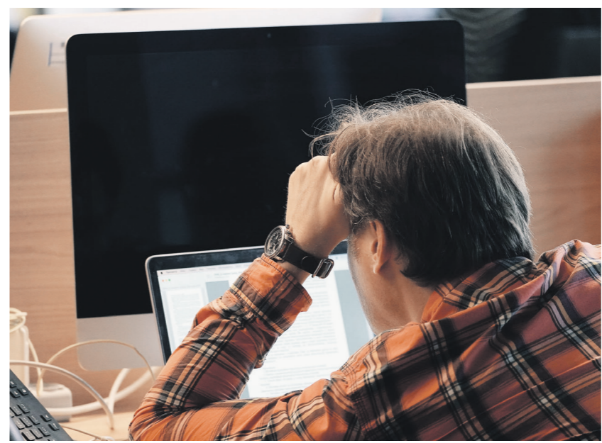
Экран: Корнелиус Гилберт

Оценка частных клиник может учитывать нарушения и признаки нарушений, которые регуляторы уже