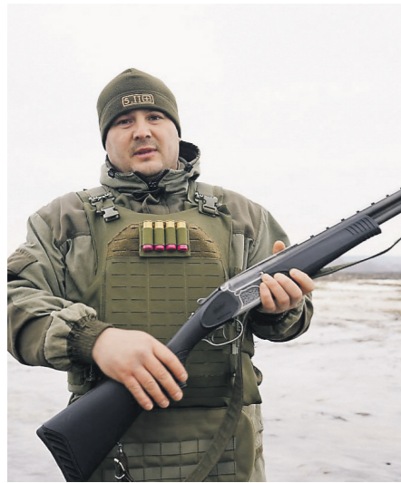
Сергей Прудинов / Иллюстрация