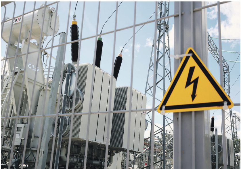
Виталий Белоусов / РИА Новости