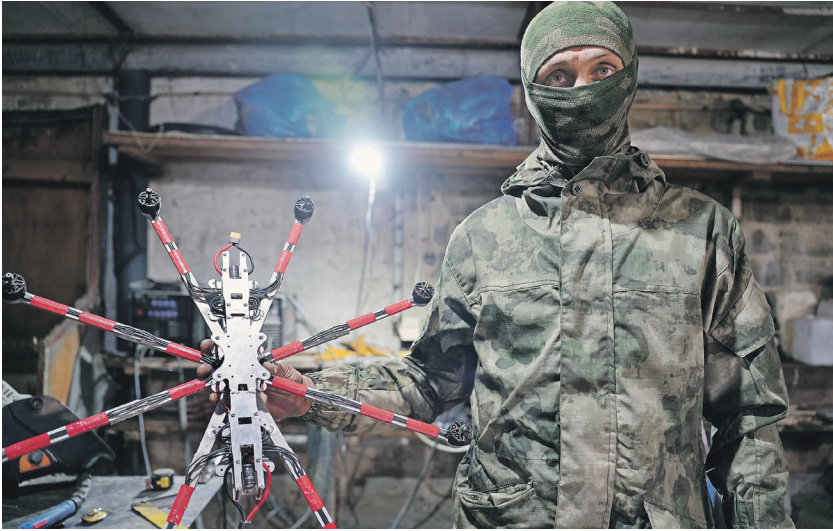
Сергей Громыко / ИА «Саратов»

—Здесь инженеры, операторы, специалисты по ИИ, связи, РЭБ и микроэлектронике смогут испытывать свои разработки в реальных условиях, адаптировать их и мгновенно доводить до нужного уровня, — сказал он. — Такая связка «полевые испытания — доработка — немедленное применение» критически важна для того, чтобы противостоять современным угрозам, прежде всего беспилотным системам противника. Там, где решения должны появляться быстро, мы делаем их быстрее.