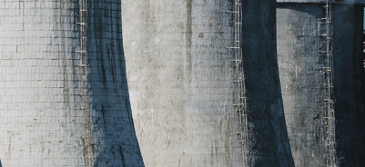
Полный текст читайте на iz.ru

Кроме того, в следующем году ключевым фактором станет скорость, с которой ЦБ будет снижать ключевую ставку, — мы ожидаем смягчения ДКП только к середине весны или к началу лета. В конце 2025 года курс доллара может оказаться в районе 84 рублей, а в 2026-м будет ещё выше.