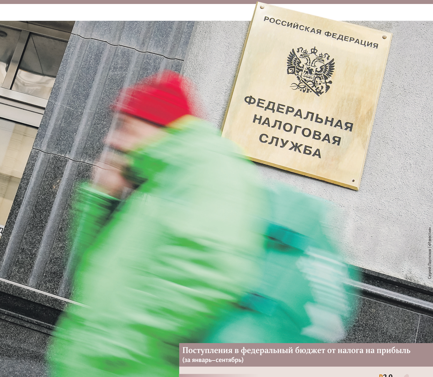
Поступления в федеральный бюджет от налога на прибыль (за январь–сентябрь)