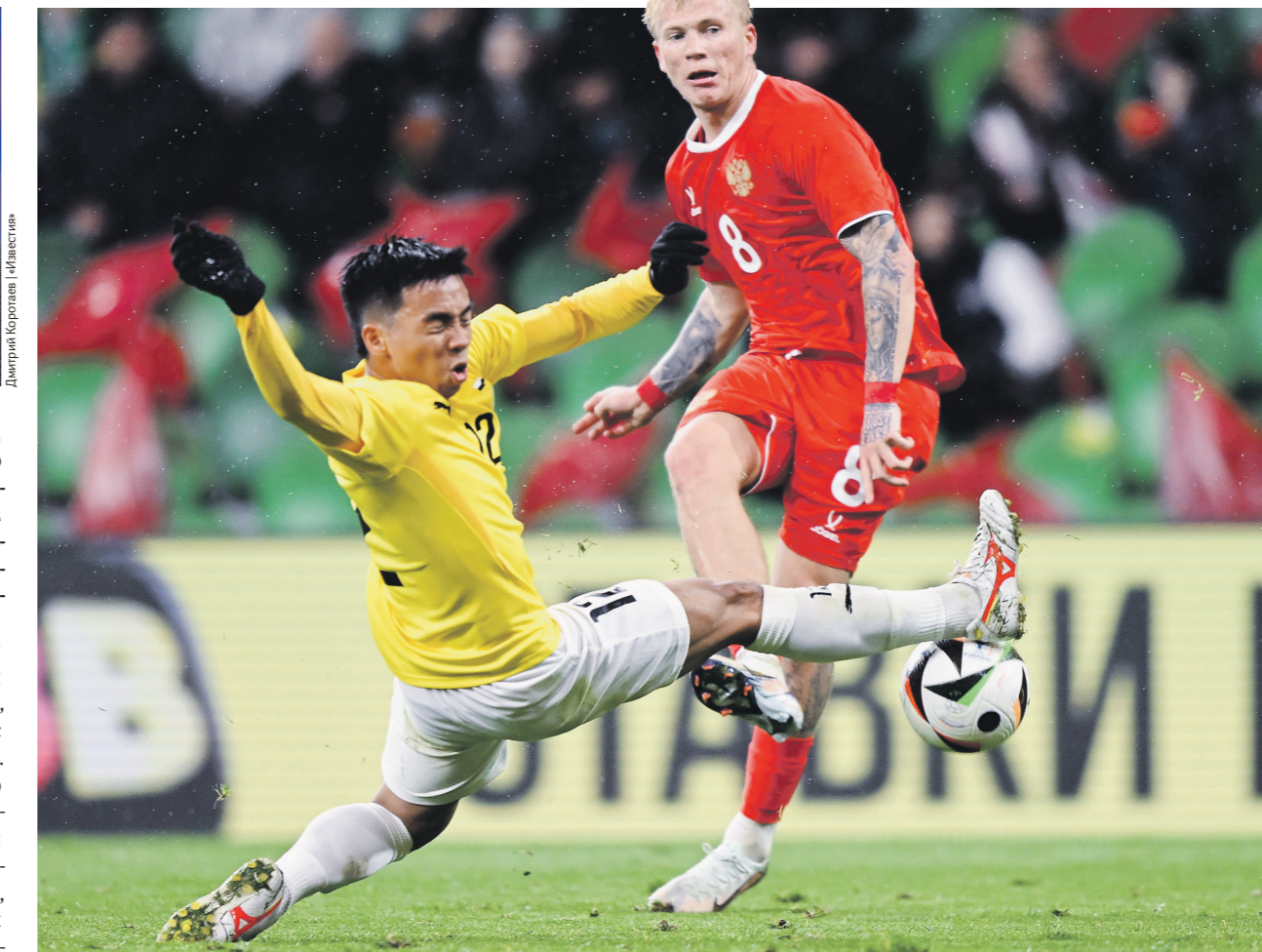
В матче с Брунеем сборная России одержала рекордную победу 11:0

но из-за позиции некоторых звёзд их сборной во главе с Эдином Джеко и Миралемом Пьяничем встреча сорвалась. Теперь, когда Пьянич в ЦСКА и фактически откестился от нежелания иметь дела с Россией, есть возможность снова вступить в переговоры с местной федерацией?