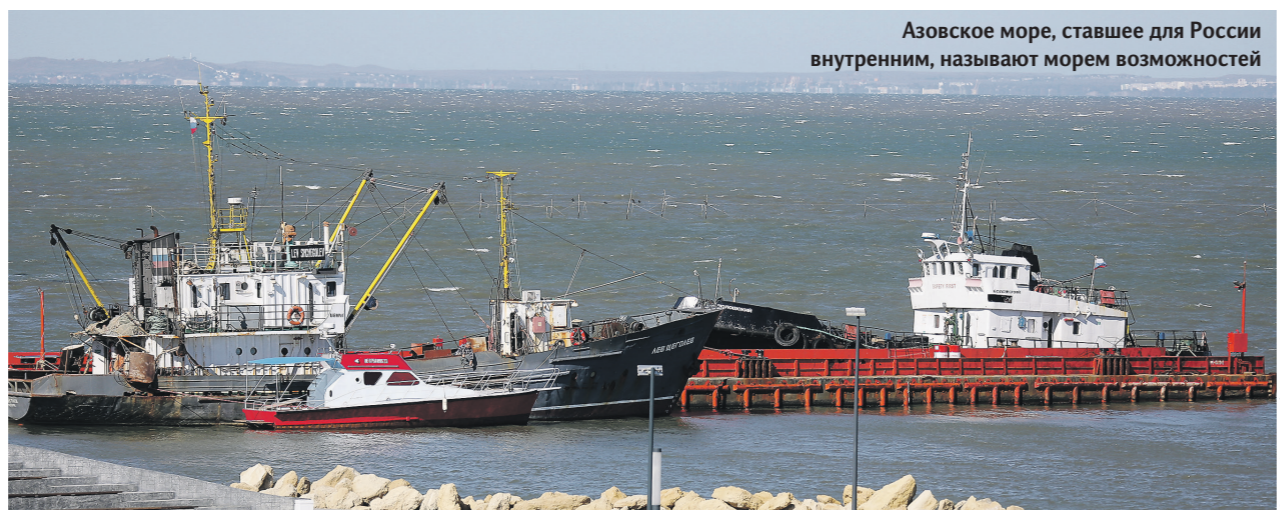
Азовское море, ставшее для России внутренним, называют морем возможностей

В подготовке материала участвовали: Наталья Ильина, Ольга Анасьева, Марина Кравцова, Наталия Котлярова