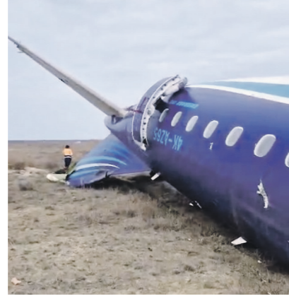
ЧП в Казахстане.

— Всё самолёт молился. У него шестеро детей. Двое только родились, — отметила она. — Семья в Екатеринбурге.