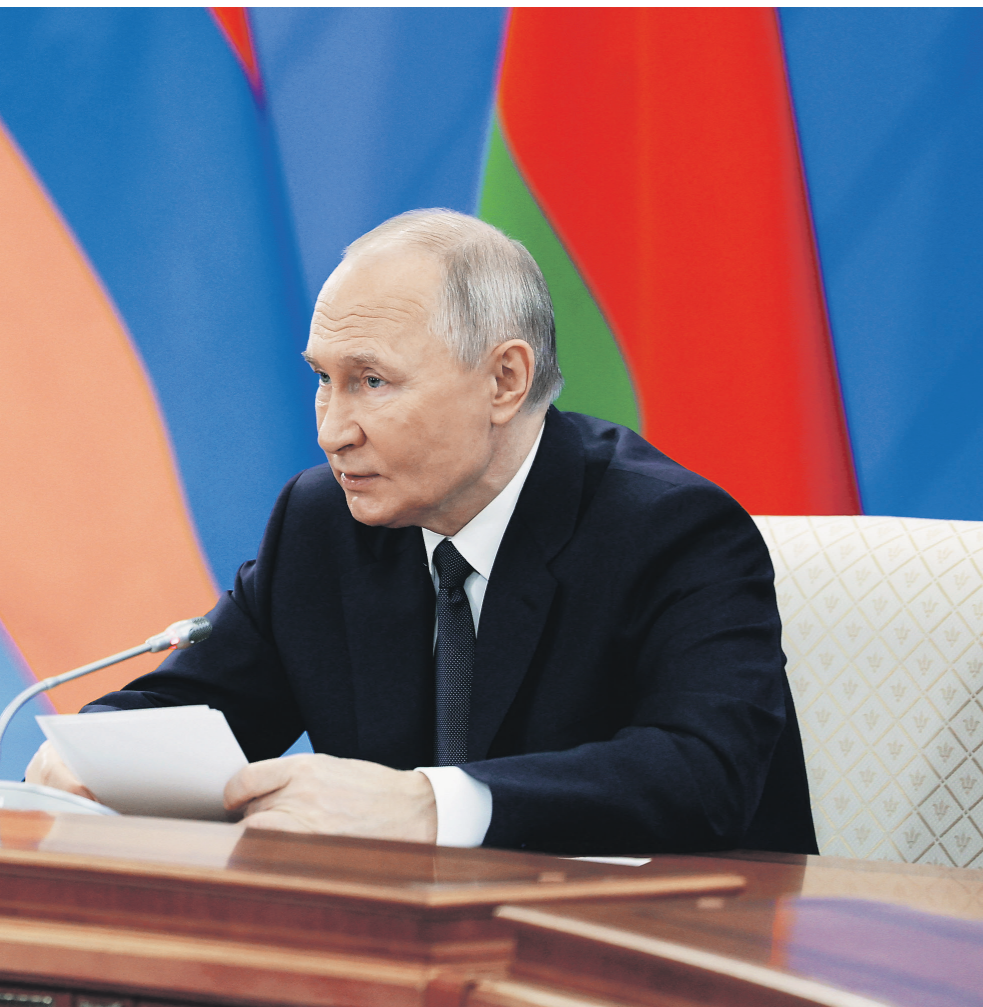
Владимир Путин.

запланировано на следующий день — 26 декабря здесь же, в «Игоре», — на заседании Высшего экономического совета ЕАЭС. Дмитрий Песков выразил надежду, что премьер-министр Армении всё же примет участие в саммите ЕАЭС в режиме видеоконференции.