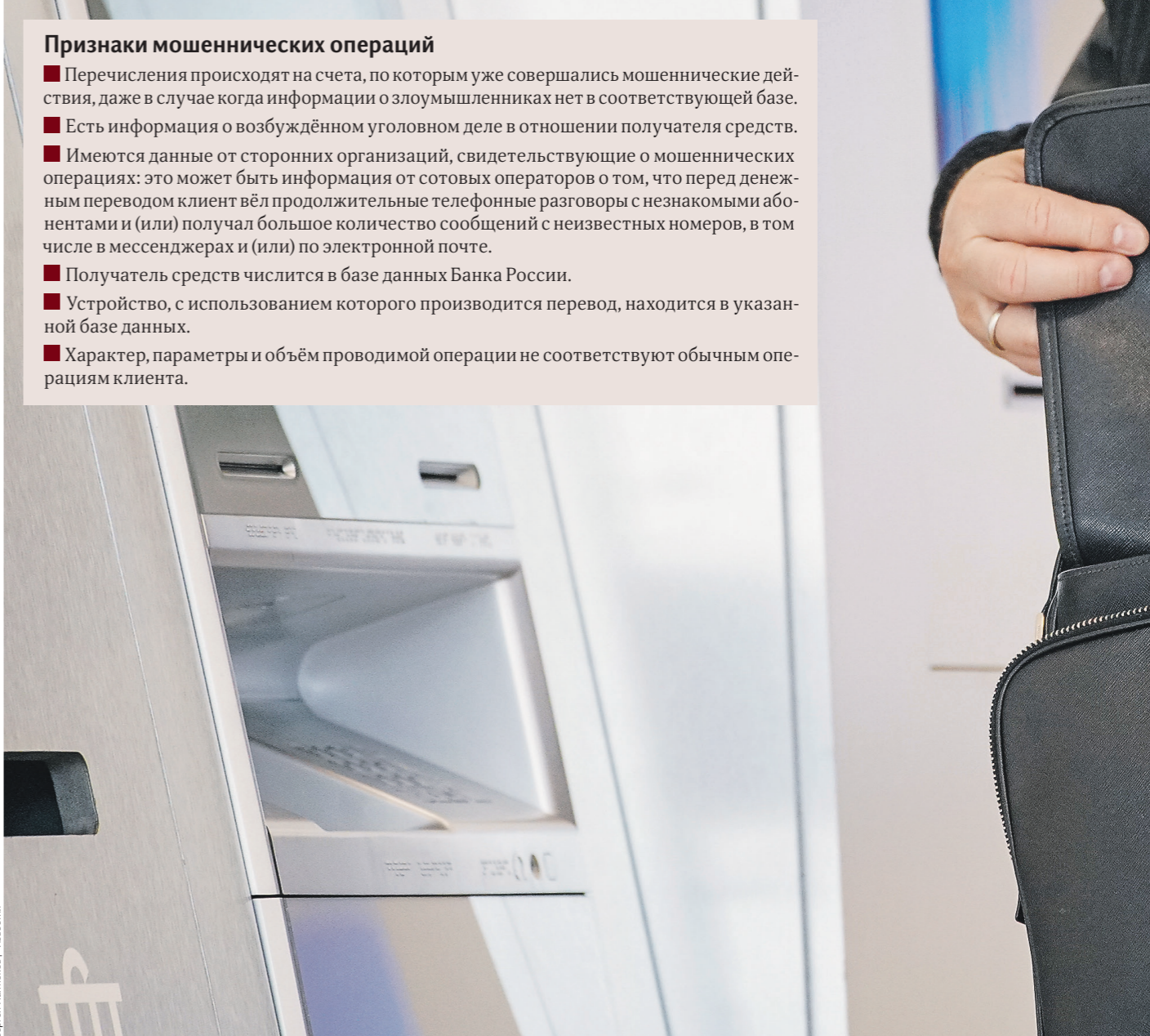
Сергей Панов / Иллюстрация

Фактически же этот перечень не защищает граждан с точки зрения идеологии нового закона. Как пояснил 24 июля регулятор, наличие этих признаков должно стать причиной для приостановки транзакции.