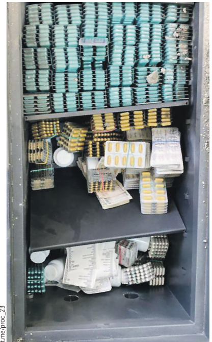
Елена Балаева / Иллюстрация

Сейчас надзорное ведомство организовало проверку по фактам участия в случаях поступления в медицинские учреждения несовершеннолетних, в том числе в тяжёлом состоянии в результате токсического действия психоактивных веществ, а также противозипелитических препаратов. Возбуждено уголовное дело по факту сбыта организованной группой фальсифицированных лекарственных средств, повлекшего смерть несовершеннолетнего (ст. 2387.1 УК РФ).