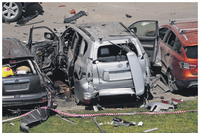
Яна Штурма / Иллюстрация

Днём 24 июля в турецком Бодруме задержали человека, который подозревался в том, что несколькими часами ранее в Москве организовал покушение на российского военнослужащего — заложил взрывное устройство в его машину. В результате взрыва пострадали владелец автомобиля и его супруга.