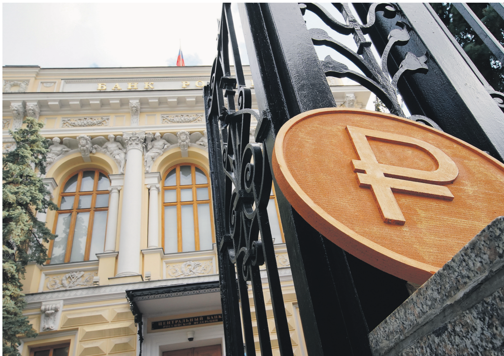
Правообладатель из России в лице Центробанка может обратиться в суд РФ, если у него необоснованно изъяли имущество в США