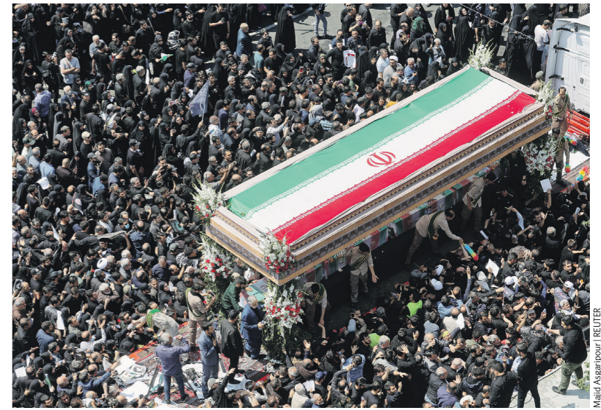
Медиа Группы «Известия»

— Безусловно, гибель иранского президента [Эбрахима Раиси] и главы МИДа страны [Хосейна Амира Абдоллахияна] — большая потеря для всего исламского мира. У них была очень большая роль в поддержке палестинской проблемы и «оси сопротивления» (название для проиранских прокси-сил в Ливане, Сирии, Йемене и Ираке. — «Известия»), — сказал Наср ад-Дин Амар.