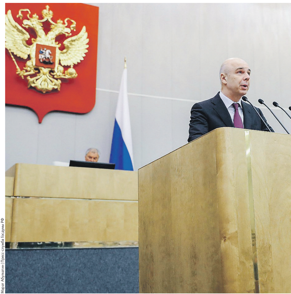
Мария Абрамова / Пресс-служба Госдумы РФ

Прогрессия в налогообложении не инновация, добавил министр. В некоторых странах верхняя граница шкалы доходит до 25–55%, напомнил он. Одна-