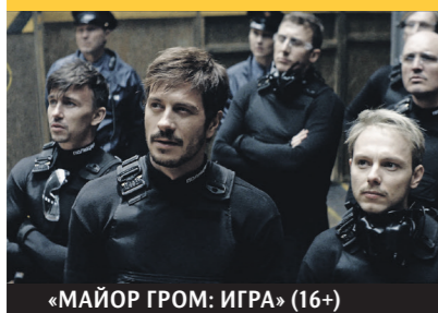
«МАЙОР ГРОМ: ИГРА» (16+)