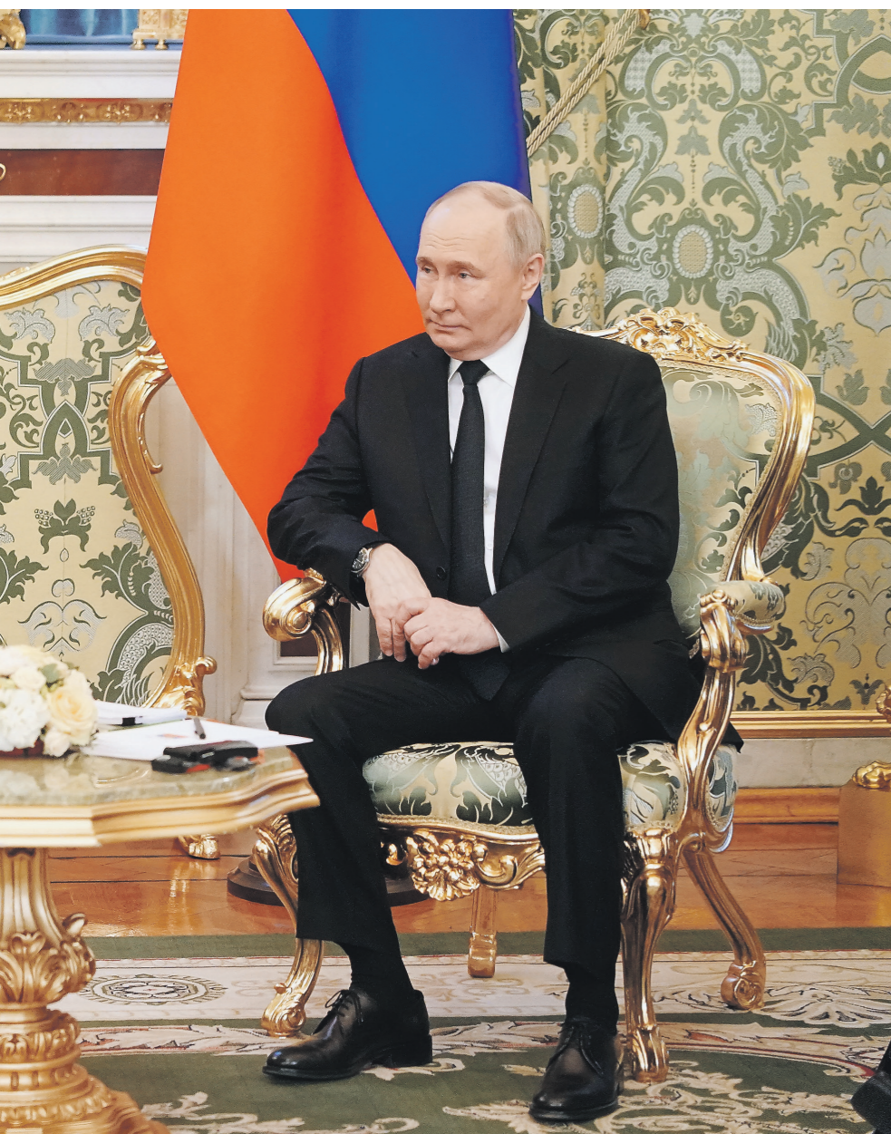
Путин Владимир / Иллюстрация

ключено, что теперь Бахрейн хочет услышать и позицию Москвы как постоянного члена Совбеза ООН. В открытой части встречи Хамад бен Иса Аль Халифа обратился к Владимиру Путину с просьбой поддержать проведение мирной конференции по урегулированию палестино-израильского конфликта. — Россия будет первой страной, к которой я обращусь с призывом поддержать проведение этой конференции, потому что Россия играет важную роль — может ей посдействовать — и одна из наиболее влиятельных стран