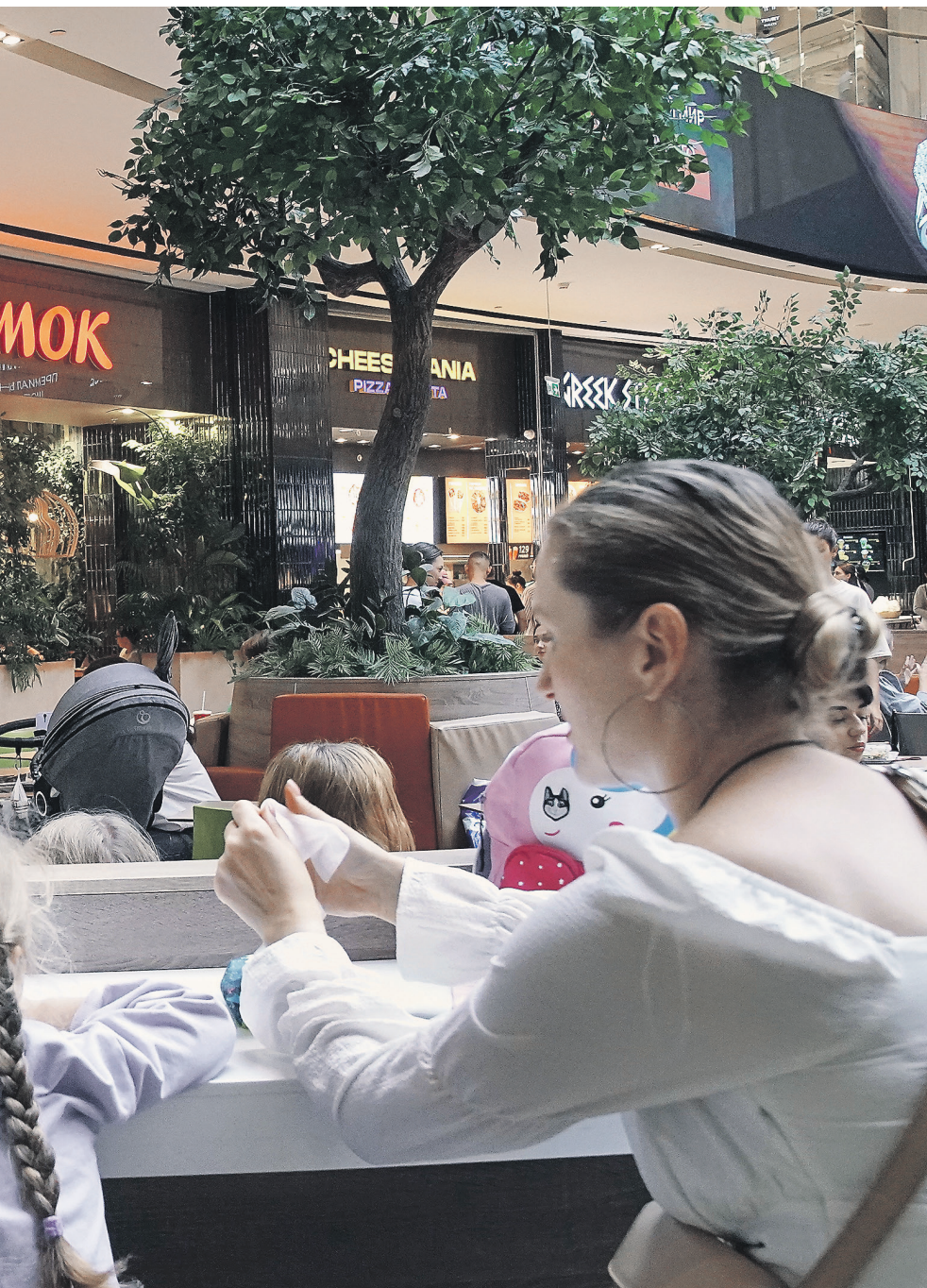
Элла Корниенко / Иллюстрация