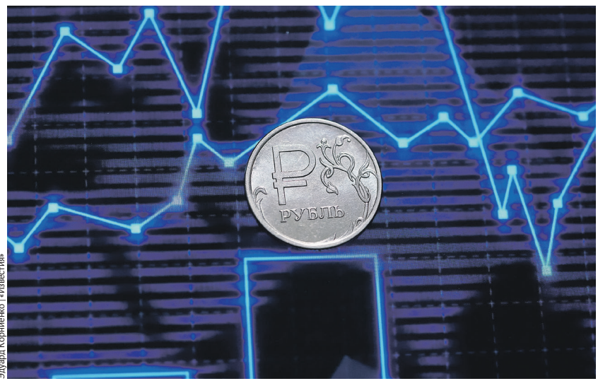
Элла Корниенко / Иллюстрация

До конца года рубль с этим значением, при прочих равных условиях, вернётся. То есть в ближайшие месяцы нацвалюта будет укрепляться. Оправданный курс рубля сейчас — в коридоре 88–90 за доллар.