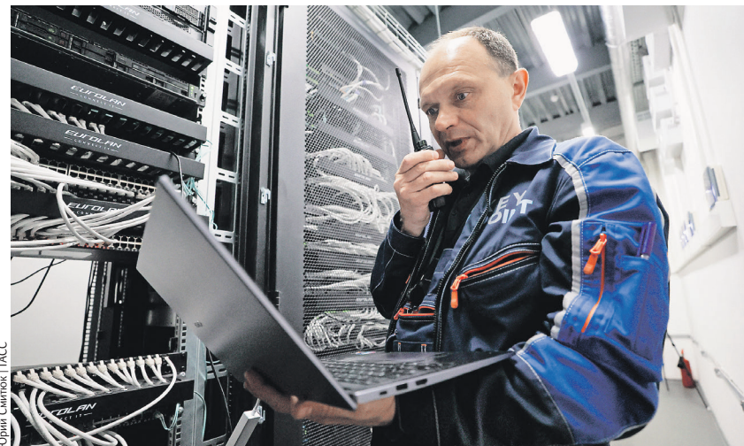
Первый и пока единственный на Дальнем Востоке и в Восточной Сибири коммерческий центр обработки данных международного уровня (TOP «Надеждинская»)

В международную TOP хотят привлечь всего 20 компаний