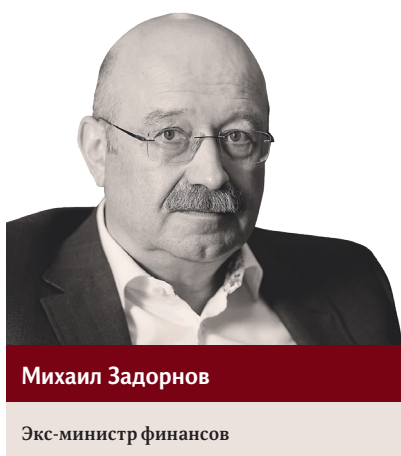
Михаил Задорнов Экс-министр финансов

Национальная валюта в последние недели торгуется около 91 рубля за доллар, 100 рублей за евро и 12,5 рубля за юань. До этих уровней она ослабла в середине августа — из-за окончания двухмесячного льготного периода по расчётам с Мосбиржей, который американцы дали после введения санкций в День России, 12 июня.