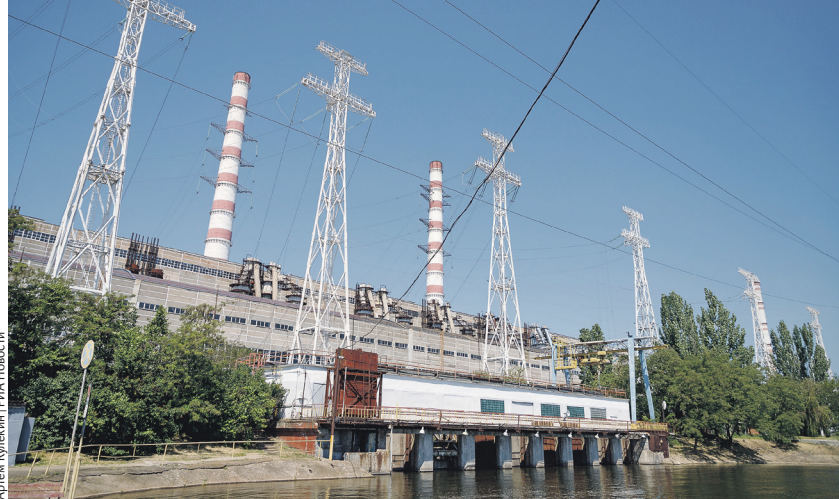
Электричество от Приднестровской ГРЭС (на фото) получает большая часть Молдавии

Нерешённость приднестровского вопроса неоднократно вызвала озлобленность в Кишинёве. Так, 16 сентября президент Молдавии Майя Санду заявила, что республика намерена войти в ЕС даже без территории непризнанного Приднестровья. «Надеемся, у нас будет возможность решить приднестровскую проблему. Но если у нас не получится быстро в последующие несколько лет, то это не означает, что мы будем откладывать европейскую интеграцию на 10 или 20 лет. Это для нас не решение. Мы хотим все [интегрироваться] вместе. Если не все вместе, это будет в два шага», — сказала она.