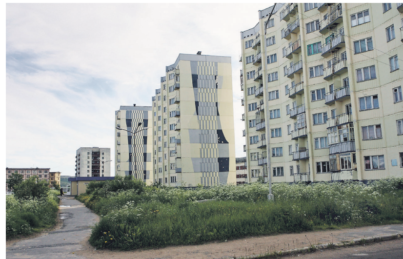
Благодаря льготной ипотеке на Дальнем Востоке и в Арктике новое жильё приобрели более 117 тыс. россиян (на фото — Заозёрск, Мурманская область)

Благодаря льготной ипотеке на Дальнем Востоке и в Арктике более 117 тыс. россиян уже построили или купили новое жильё, рассказали «Известиям»