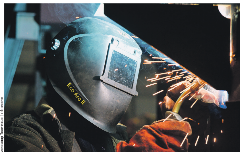
Александр Пучков / Иллюстрация