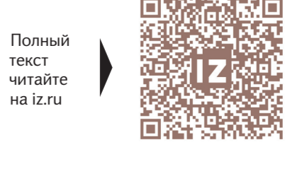
Полный текст читайте на iz.ru

Особое внимание на переходном этапе будет уделено определению статуса курдов, что считается одним из самых сложных вопросов в политическом ландшафте страны. Сирийские курды — крупнейшее этническое меньшинство страны, компактно проживающее на северо-востоке, — долгое время сталкивались с дискриминацией и ограничением прав. До начала внутреннего вооружённого конфликта в 2011 году многие курды в Сирии оставались без гражданства, а их культурные и политические права существенно ограничивались. К 2008-му число сирийских курдов, не имеющих гражданства, составляло более 300 тыс. При этом безработица в этих районах достигала 60%, а на руководящие должности в местных компаниях, занимающихся добычей сырья, назначались алавиты (некоторые увязывают это с тем, что Асад по происхождению алавит), а не курды. Только после начала масштабных протестных действий в 2011 году Башар Асад приказал выдать курдам паспорта.