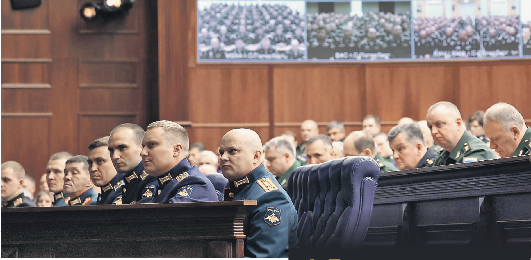
Рис: Сергей Пронин/РИА Новости