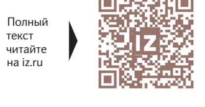
Полный текст читайте на iz.ru