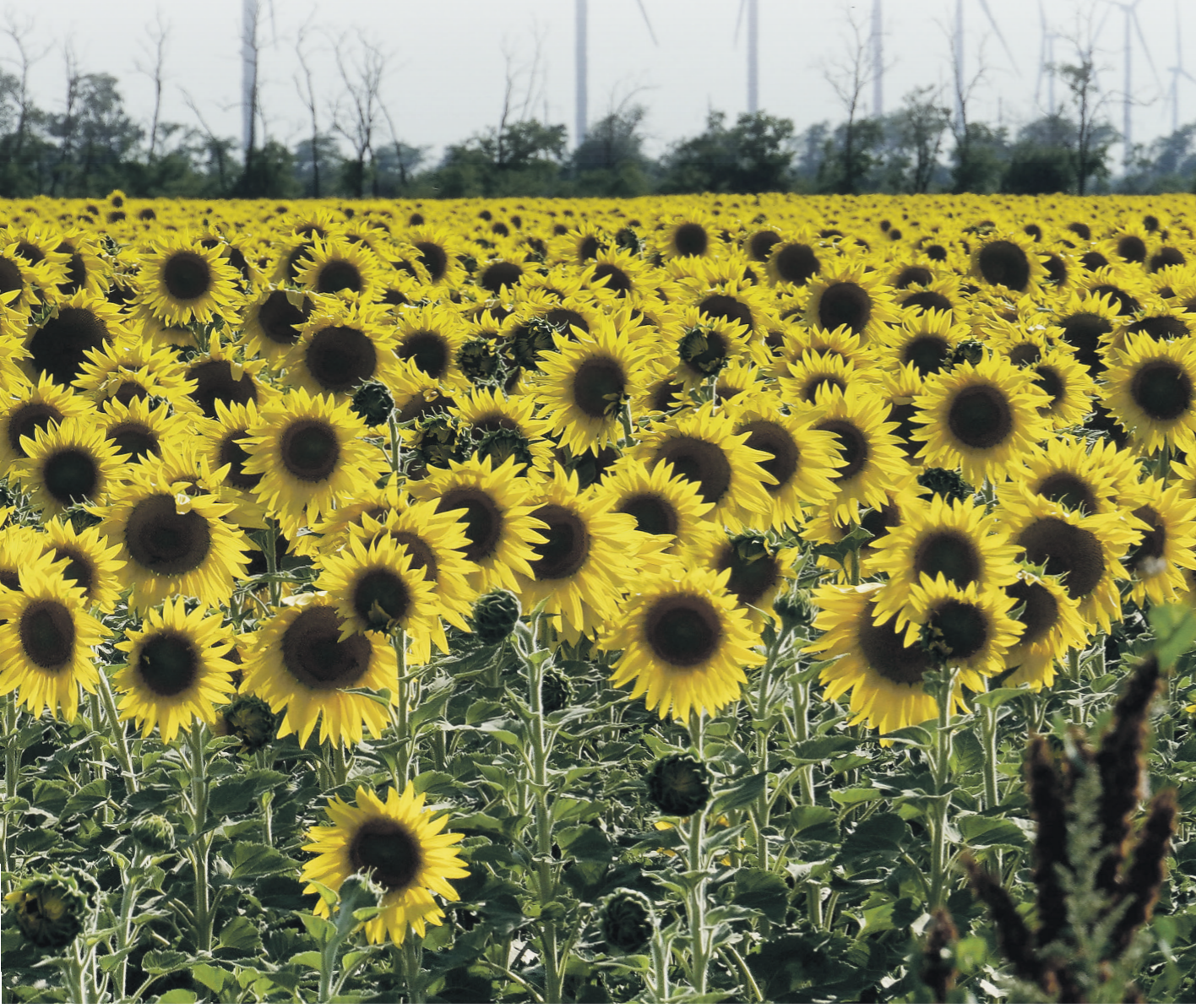
Сергей Вельский / Известия

Таким образом, будет не только обеспечен спрос, но и сформирован профицит, что гарантирует стабильность поставок, резюмировал он.