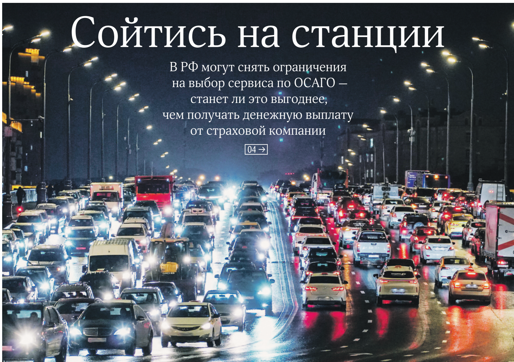
Сергей Липинский / Иллюстрация