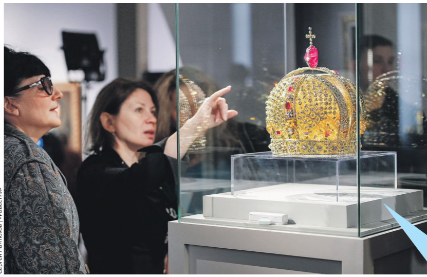
Сергей Лисицкий / Иллюстрация

Это бурный и драматичный период в истории России, последовавший за смертью Петра Великого, когда