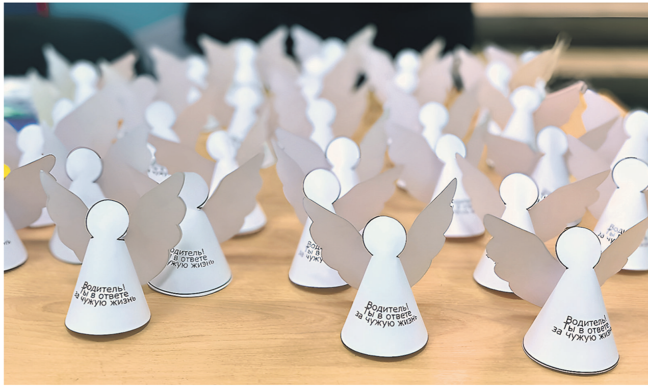
Госавтоинспекция МВД России

В российской Госавтоинспекции отмечают: Всемирный день памяти жертв ДТП является важной составляющей в профилактике аварийности и пропаганде безопасности дорожно-