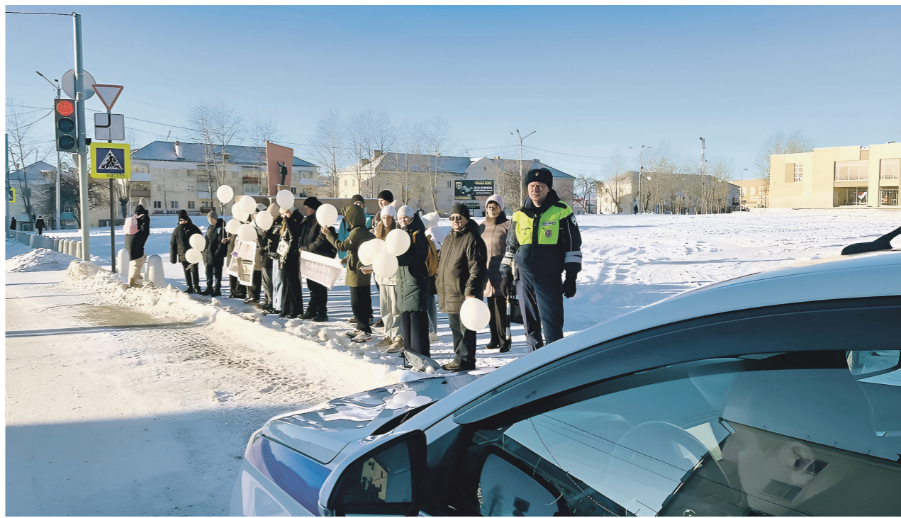
Госавтоинспекция МВД России

Материал подготовлен в рамках реализации федерального проекта «Безопасность дорожного движения» национального проекта «Безопасные качественные дороги».