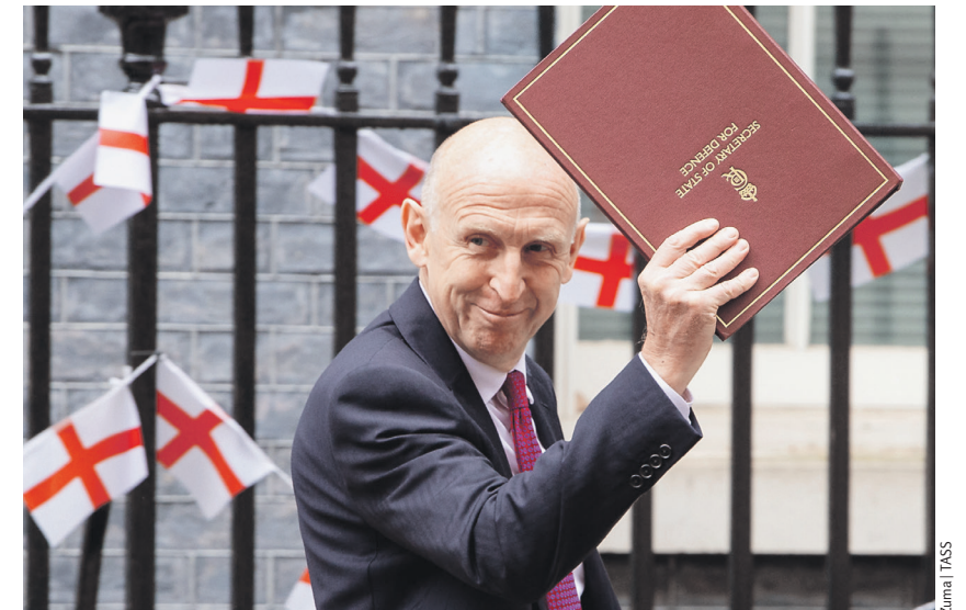
Джон Хили заявил, что Британия продолжит поддержку Украины

— Российско-британские связи по военной линии были установлены 90 лет назад, в 1934 году. В 1941-м при содействии военных атташатов было заключено соглашение о совместных действиях против нацистской Германии. Контакты между военными ведомствами были чрезвычайно важны для двух стран, но Лондон решил разорвать и этот, один из последних каналов связи. Полагаем, что теперь он будет восстановлен нескоро, — прокомментировали текущее положение дел в диппредставительстве РФ.