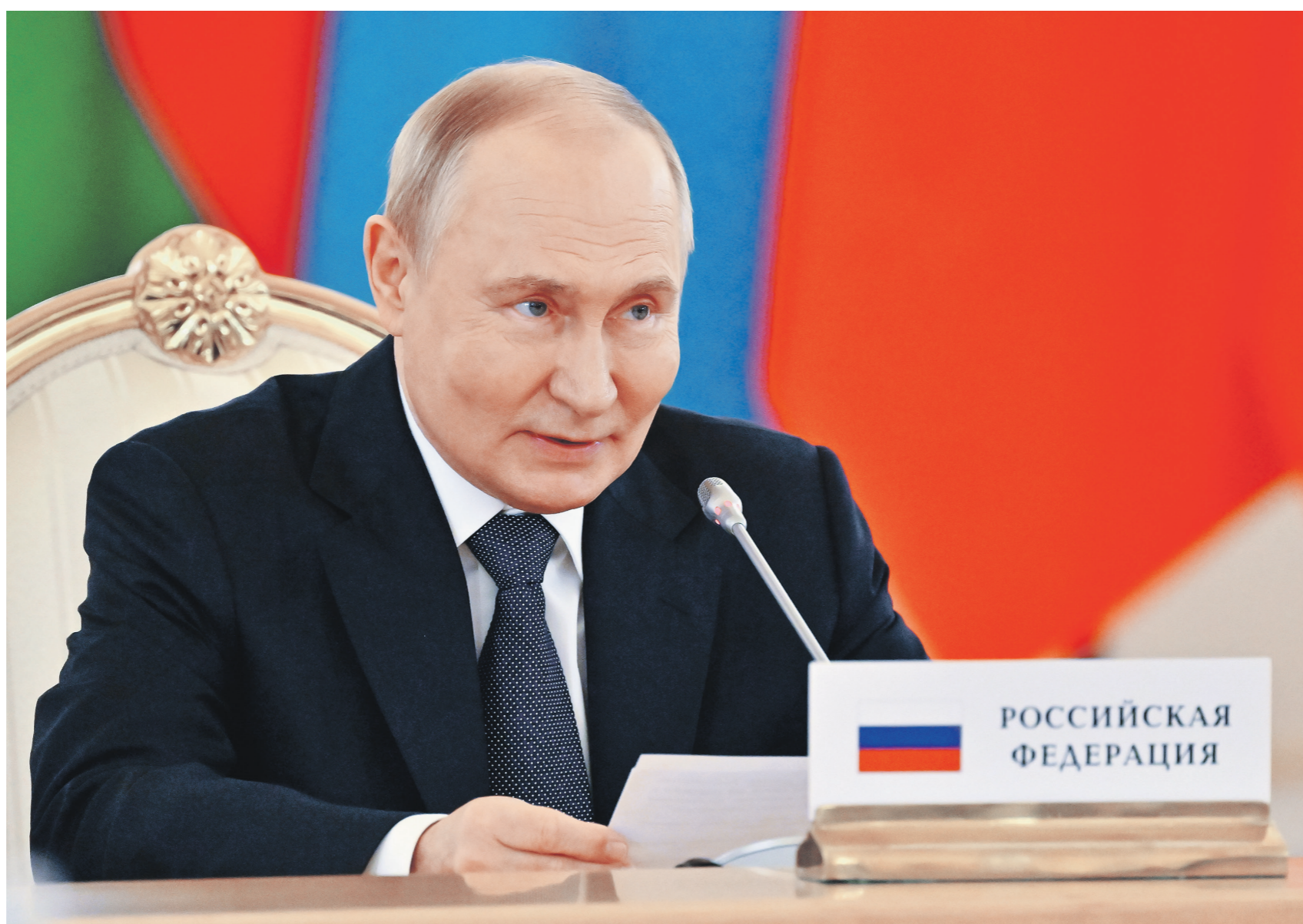
Владимир Путин провёл главное мероприятие в год председательства России в СНГ — заседание Совета глав государств Содружества (8 октября, Кремль)

В Кремле 8 октября Владимир Путин провёл главное мероприятие в год председательства России в СНГ — заседание Совета глав государств Содружества. На саммит прибыли лидеры Азербайджана, Армении, Белоруссии, Казахстана, Киргизии, Таджикистана, Туркмении и Узбекистана. Несмотря на то что все главы государств накануне уже виделись в резиденции российского президента в Ново-Огарёво в день его рождения, где могли пообщаться неформально, саммит растянулся более чем на три часа. При этом политики готовились к заседанию по-разному. Например, Александр Лукашенко в Москве решил перед мероприятием поколоть дрова, сообщают СМИ. А Никол Пашинян и вовсе в дождливое утро вторника прокатился на велосипеде по берегу Москвы-реки. «Очень хорошая велодорожка, и сегодня у нас была велосипедная прогулка», — говорит он на видео в соцсетях. 02 →