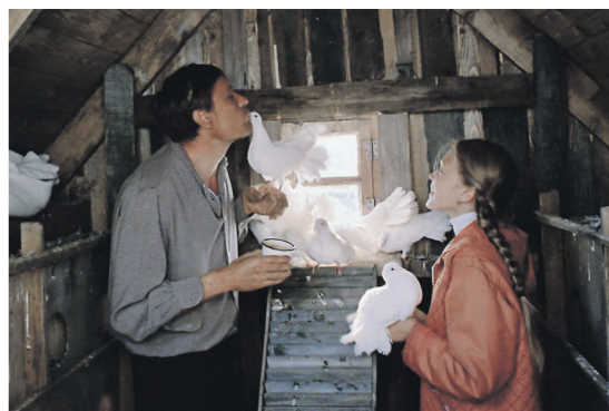
«Любовь и голуби» (1984)