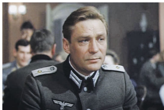
«Отряд специального назначения» (1987)