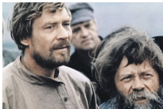
«Очарованный странник» (1990)