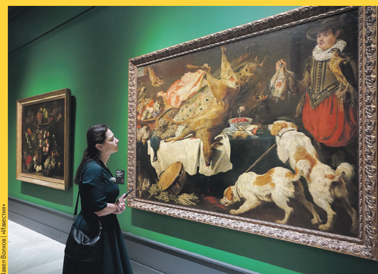
Писет Витторио / Иллюстрация

Весной этого года Пушкинский музей показал выставку «Цветы, плоды, музыкальные инструменты в итальянской живописи эпохи барокко», ставшую для многих зрителей открытием прежде всего потому, что Италия совсем не ассоциируется с натюрмортом. Тем не менее благодаря ГМИИ мы могли убедиться в том, что на Апеннинском полуострове создавались прекрасные образцы — и некоторые из них хранятся в России. Теперь в том же самом экспозиционном пространстве — Белом зале и вдоль колоннады у парадной лестницы — разместились произведения из страны, для которой, наоборот, натюрморт стал фирменным жанром. Но важно понимать, что в ту эпоху изображения фруктов, цветов, дичи, домашней утвари вовсе не воспринимались как единое направление. И выставка под кураторством Вадима Садова как раз показывает стиливую, сюжетный и эмоциональный диапазон подобных работ.