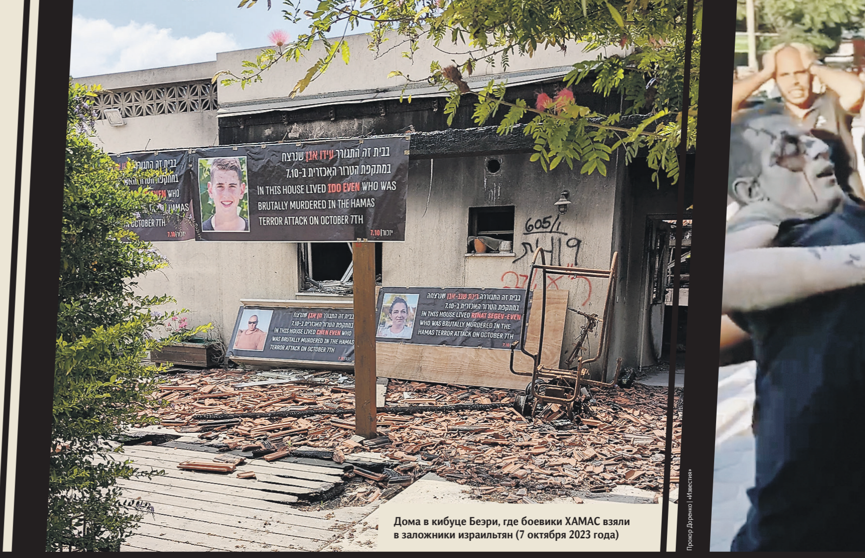
Дома в кибуце Беэри, где боевики ХАМАС взяли в заложники израильтян (7 октября 2023 года)