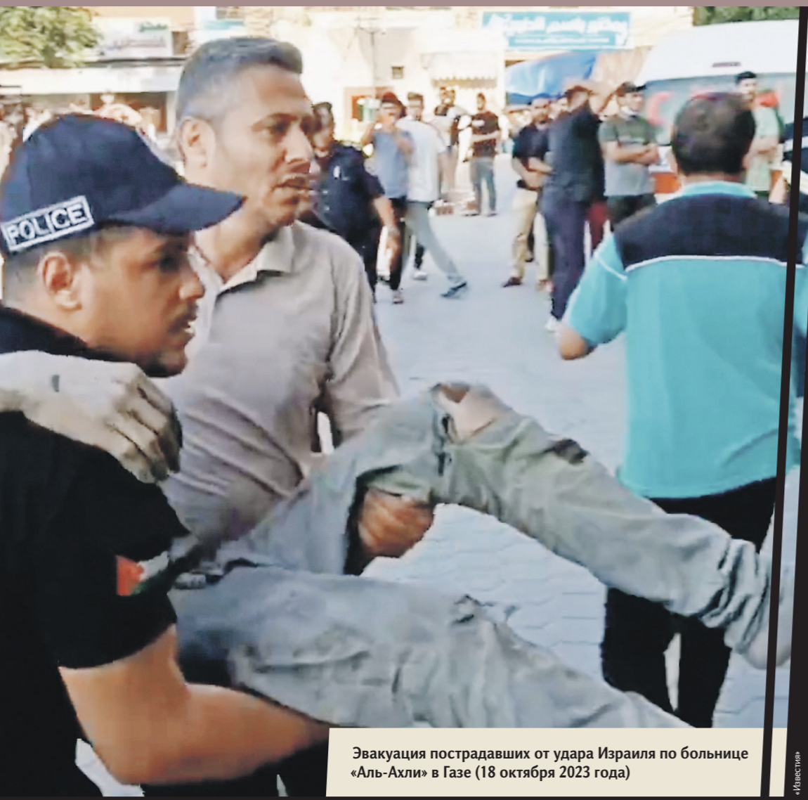
Эвакуация пострадавших от удара Израйля по больнице «Аль-Ахли» в Газе (18 октября 2023 года)