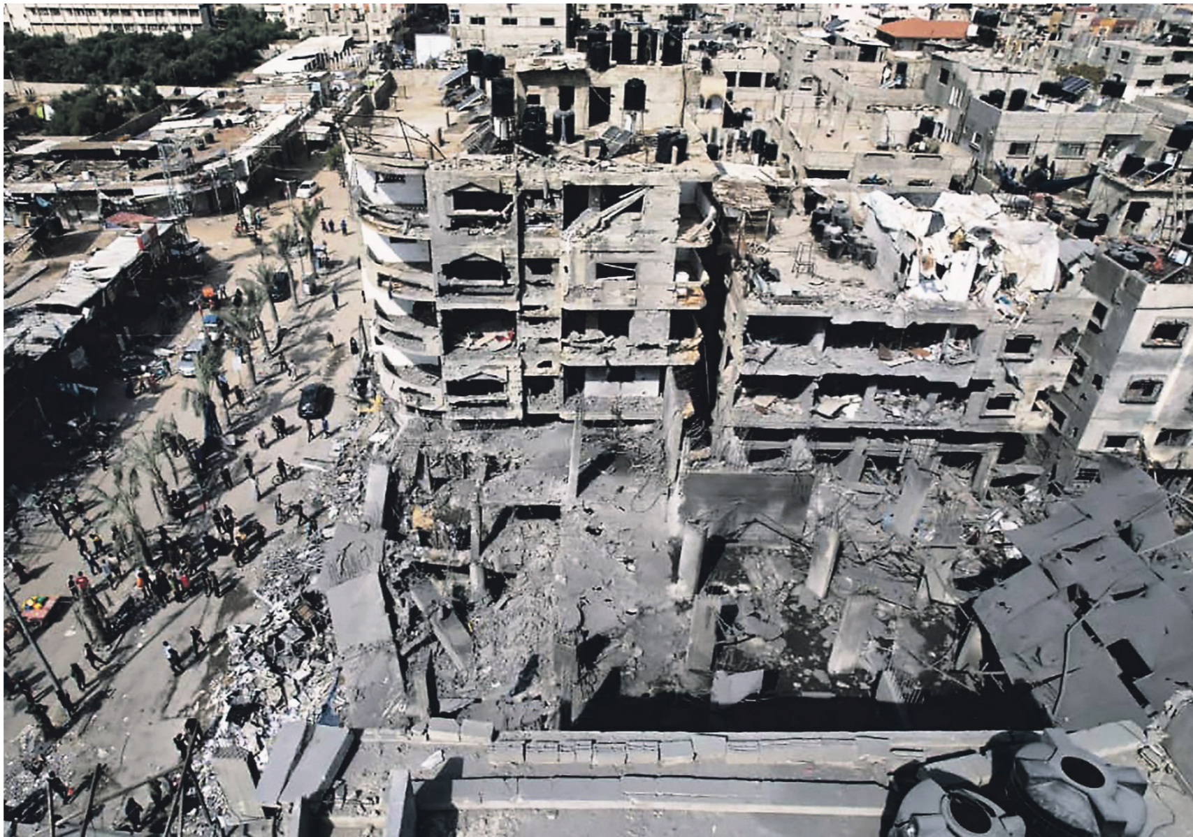
Ближний Восток оказался на грани крупномасштабной войны (на фото — разрушенный в результате обстрела рынок в секторе Газа)