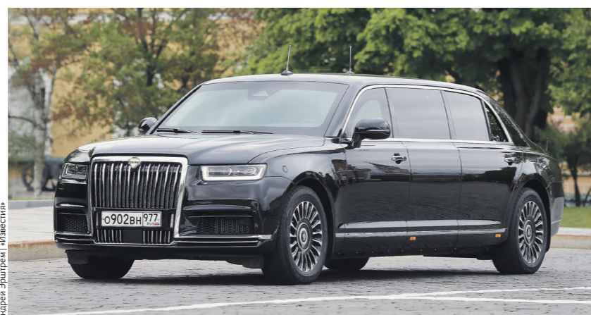
Владимир Путин приедет на инаугурацию на обновлённой версии президентского автомобиля Aurus Senat

Однако и до полудня в залах дворца обстановка будет оживлённой. К моменту появления в нём президента свои места на подиуме рядом с ним уже должны занять спикеры обеих палат парламента — Валентина Матвиенко и Вячеслав Володин, а также глава Конституционного суда РФ Валерий Зорькин как представители законодательной и судебной ветвей власти. Перед началом церемонии знаменосцы устанавливают слева государственный флаг, а справа — штандарт президента. Следом военнослужащие роты почётного караула вносят символы президентской власти: знак президента Российской Федерации и главный документ страны — специальное издание Конституции, на котором президент спустя несколько минут и принесёт присягу.