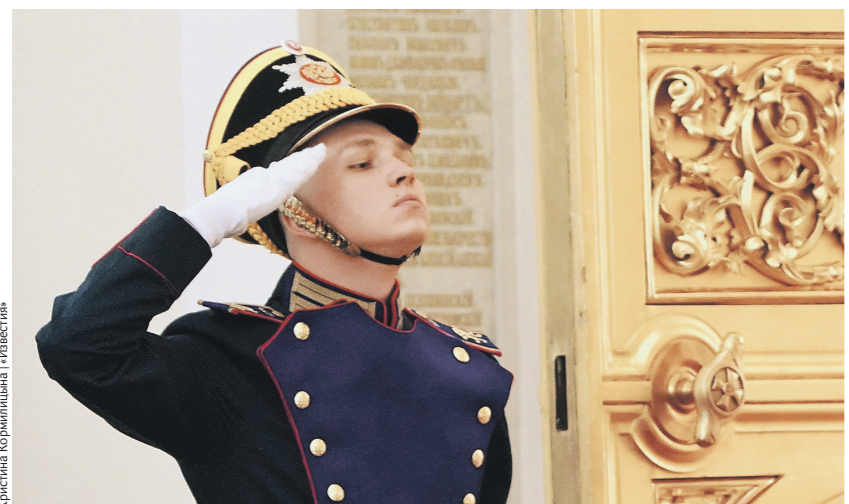
Кристина Курочкина / «Известия»

В стенах Большого Кремлёвского дворца идут последние приготовления к торжественной церемонии инаугурации главы государства: военнослужащие Президентского полка и знаменосцы проводят итоговые репетиции, конная кавалерия оттачивает шаг. 02 →