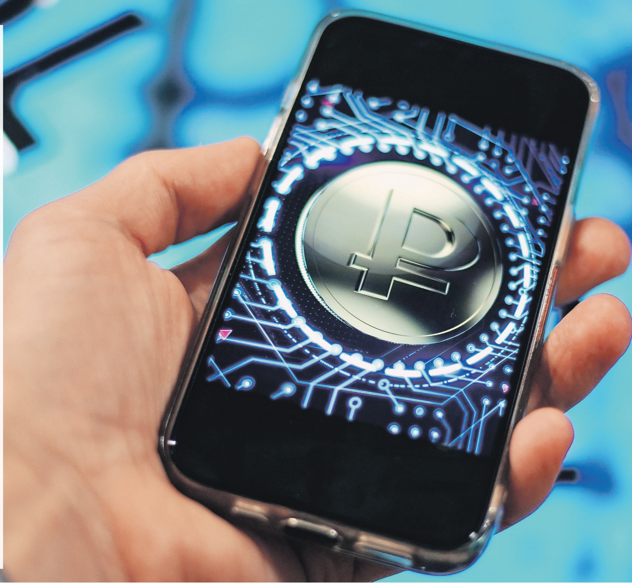
Сергей Липинский / Известия