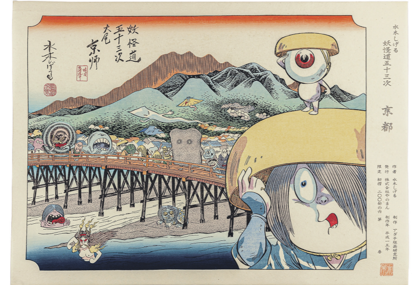
Сигэру Мидзуки в своих работах нередко обращался к японскому фольклору и изображал нечисть из мифов и легенд

На подготовку выставки понадобилось больше трёх лет. Для этого