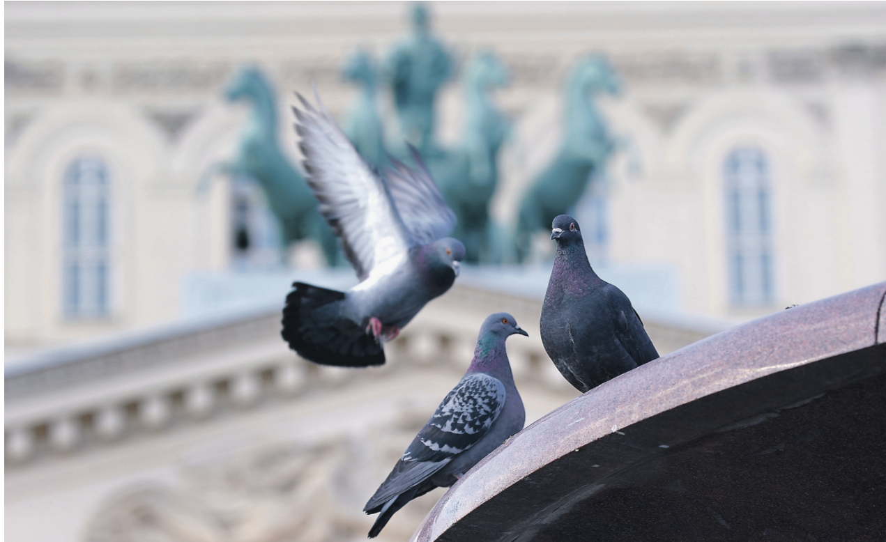
Элла Корткина / Известия