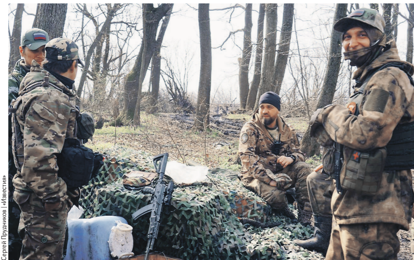
Степан Пуринкин / Иллюстрация