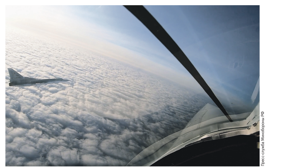
Роснефтегаз / Минобороны РФ

Министр обороны КНР подтвердил, что Россия для первого его зарубежного визита выбрана неслучайно: поездка призвана продемонстрировать внешнему миру высокий уровень развития ки-