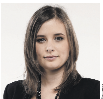
почему шесть депутатов от Mi Hazánk Mozgalom (движение «Наша Родина») не поддерживают расширение НАТО и в парламенте голосуют против, в отличие от всех других партий.

27 марта венгерский парламент одобрил вступление Финляндии в НАТО, при этом депутаты от вашей партии во время голосования высказались против такого решения. Почему же «Наша Родина» не поддерживает расширение Североатлантического альянса? Сейчас США используют НАТО для защиты своей глобальной роли в мире, вынуждая расширить организацию за счёт ещё двух игроков, а именно Швеции и Финляндии. При этом обе страны традиционно были независимыми и на протяжении 200 лет сохраняли нейтралитет на международной арене. После вступления в альянс независимость и суверенитет будут потеряны. Я уже не говорю о том, что референдум по этому вопросу не проводился, так что это решение не граждан, а только правящих партий. Вот