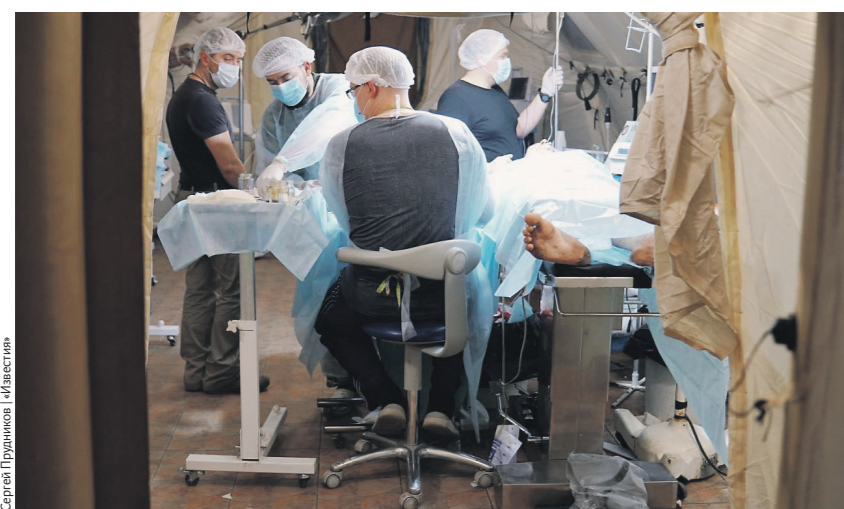
Раненный осколком навылет солдат был успешно прооперирован

Через распахнутые ворота въезжаем в минеральные недра. Десятки километров катакомб, очень легко заблудиться, — объясняют мне сопровождающие бойцы, пока мы петляем, освещая путь фарами, по лабиринтам. — В январе тут стояли ВСУ. Но как только мы заняли пригород, они покинули подземелье и ушли. Хотя держаться тут можно бесконечно. И добавляют, что ушли, вероятно, всего боясь, что входы-выходы им заблокируют и путь после долгого сидения останется один — плен. — В первый же день они отсюда что-то грузовиками вывозили, — рассказывают парни. — Мы думали, боекомплекты. А потом выяснилось — вино! Видимо, поступил приказ сверху спасти наиболее ценную продукцию. Внутри, в коридорах, всё напоминает о недавнем прошлом. Стеллажи с розовым, красным и белым игристым. Доска почёта. Картины с девчатами, собирающими виноград. Скульптура Диониса. Сами бойцы говорят, что к бутылкам они не притрагиваются — сухой закон: если кого-то уличат, накажут крупным штрафом, а то и вовсе отправят на вольные хлеба. Свообразным исключением, по их словам, стало 8 Марта, когда они отвезли две фуры с праздничным напитком в Луганск, где бесплатно раздавали всем женщинам. Над головой — 80 м земли. В катакомбах находятся казармы, штаб, пункты управления, госпиталь, кухни, даже стрельбище. В жилые помещения проведены водопровод, тепло. А в самих штольнях прохладно, как в пещере.