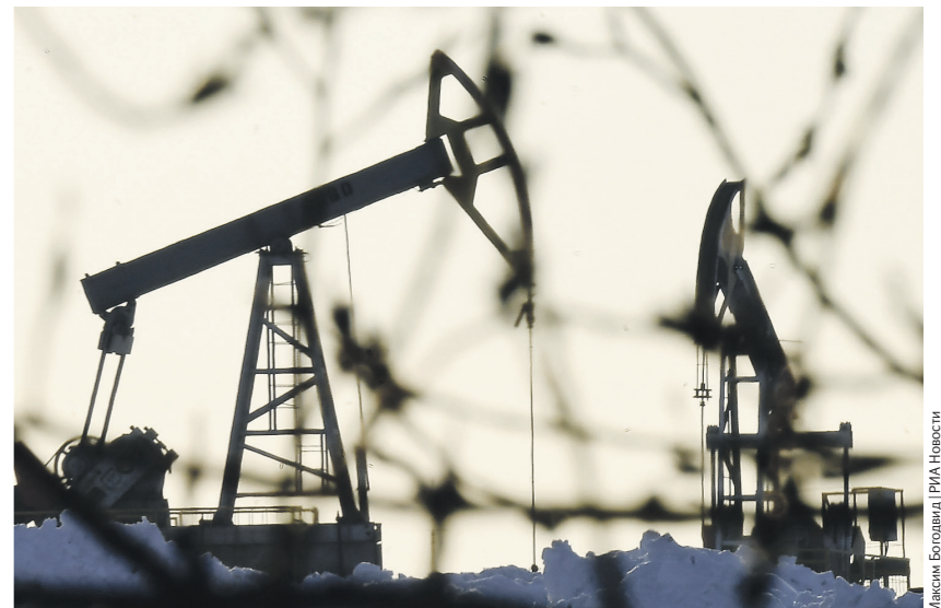
Михаил Болотов / РИА Новости

На этом фоне ряд источников Reuters сообщил, что перенос даты заседания связан с разногласиями по поводу уровня добычи для африканских производителей. 06 →