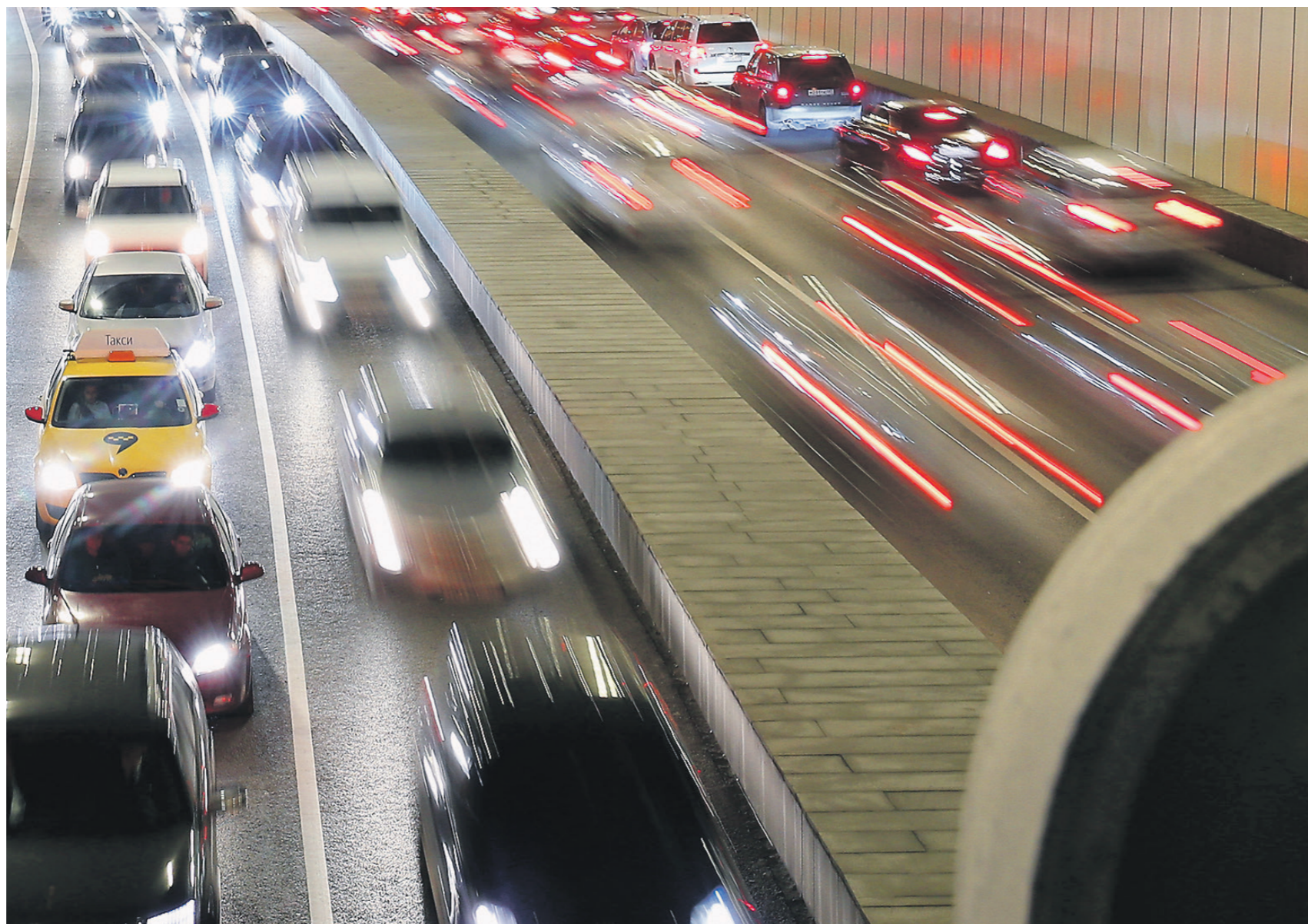
Александр Калашов / Иллюстрация

Рекордное увеличение средней суммы займа также подтвердили в Национальном бюро кредитных историй. Там сообщили «Известиям»: за год показатель вырос на 47%, до 1,56 млн рублей. 05 →