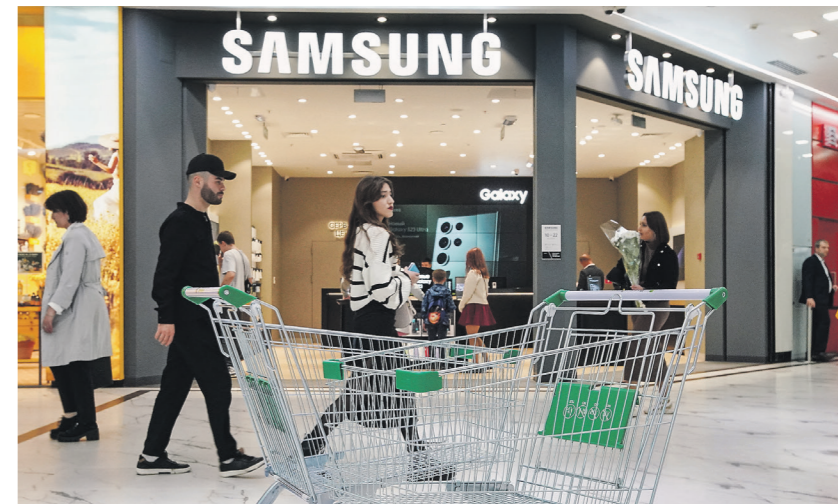
Сергей Шумков / Иллюстрация

— Деятельность компании не претерпела никаких изменений, — прокомментировали ситуацию в пресс-службе российской Samsung.