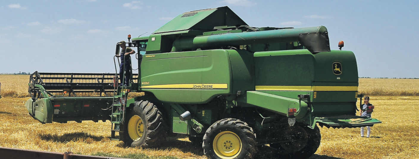
Экспорт сельхозпродукции из России

Тем более страны этого региона часто выступают в роли хабов для дальнейшего распределения ресурсов. К примеру, Турция перерабатывает зерно в муку, которая далее следует в Африку и более бедные страны, резюмировал он.