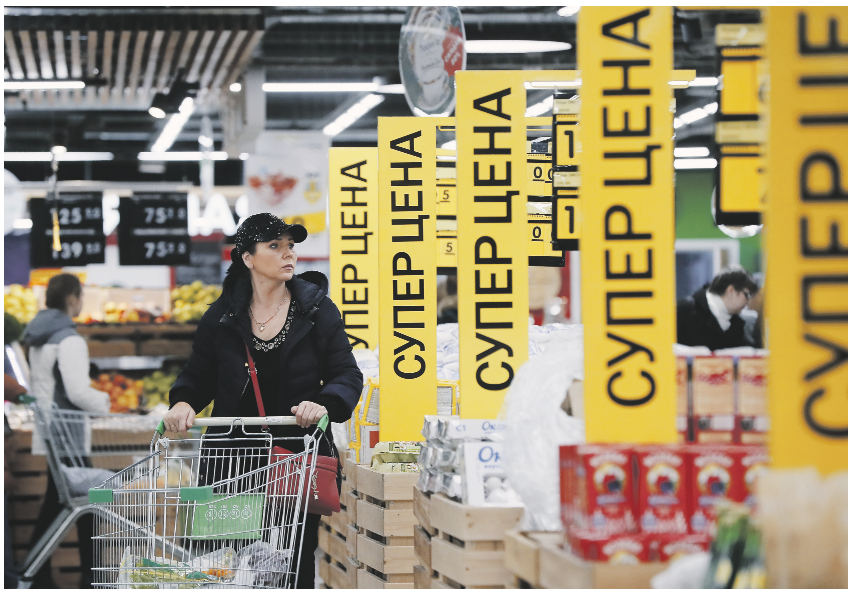
Алексей Мухомов | Известия

Комплекс принятых правительством и Банком России мер позволил укротить инфляцию. 04 →