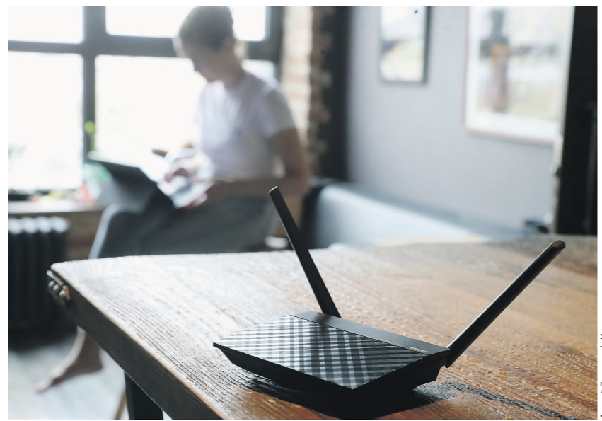
Андрей Златовский / «Известия»