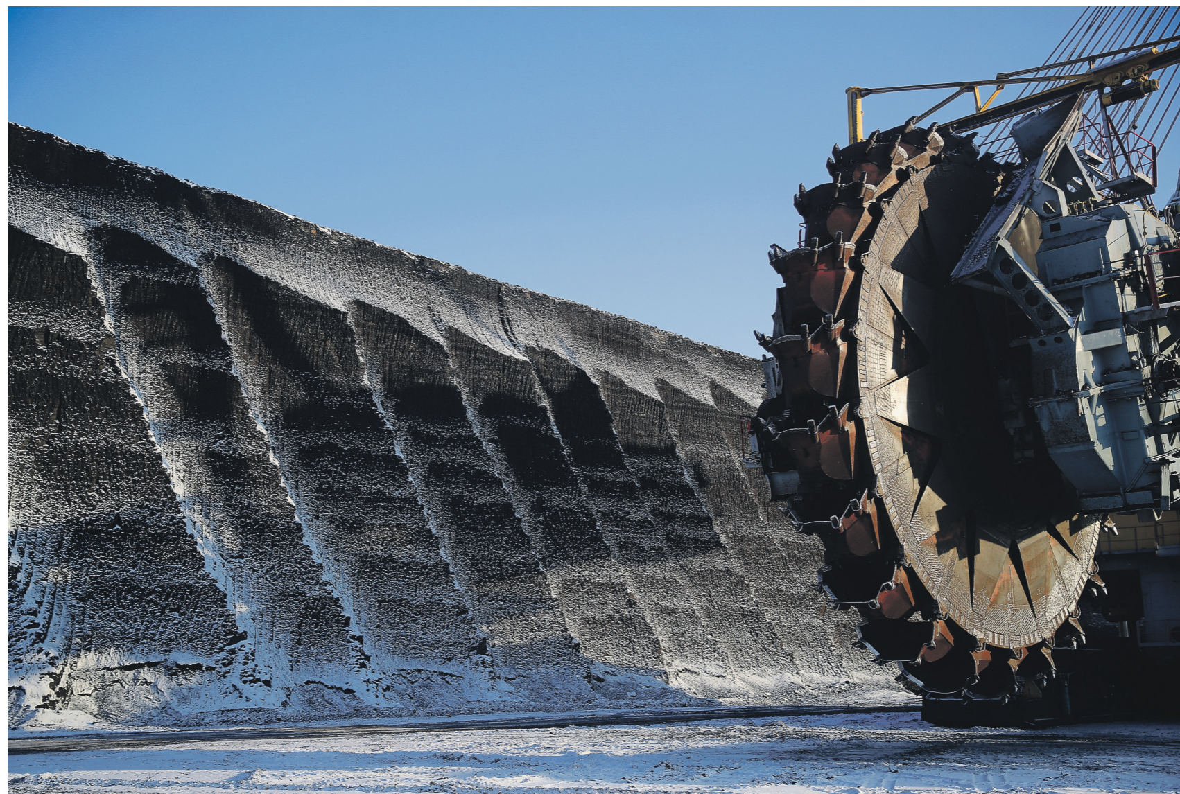
Наибольший рост доходов бюджета ожидается от налога на добычу полезных ископаемых