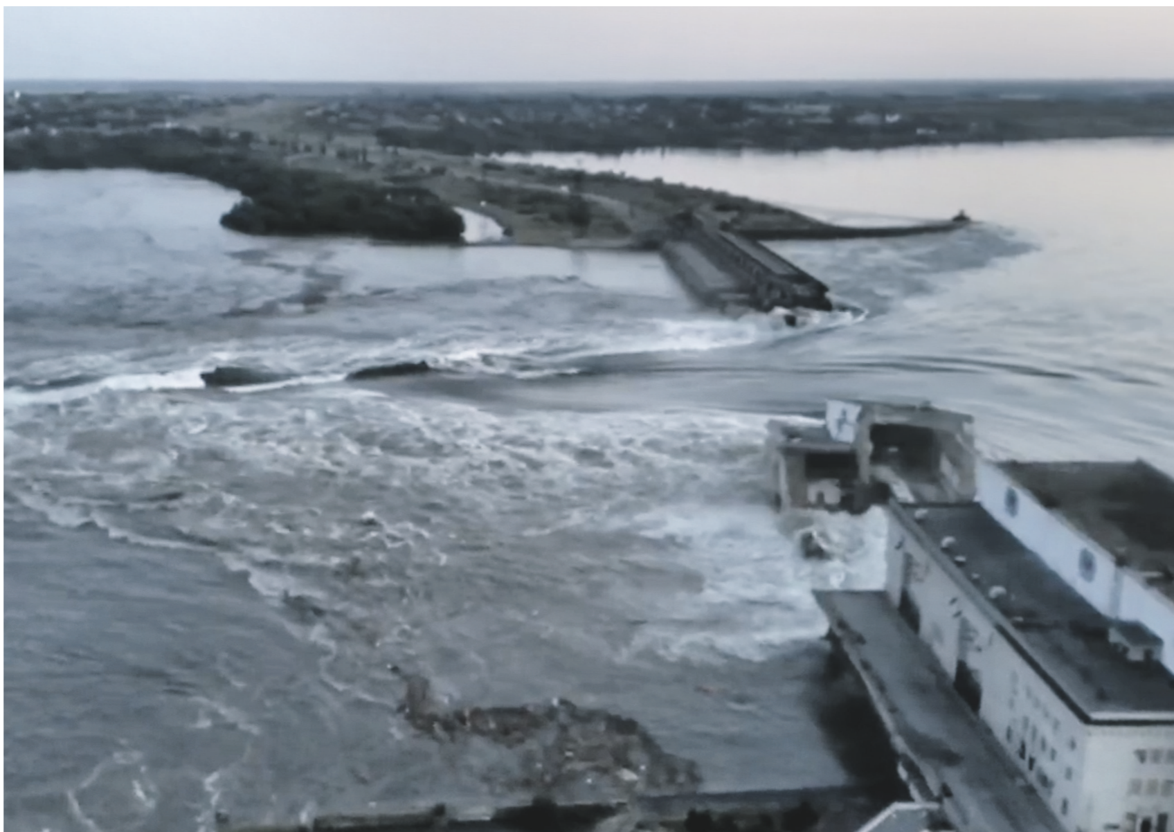
Власти региона заявили, что к разрушению ГЭС привели обстрелы со стороны украинских террористов