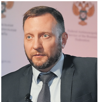
Дмитрий Корняков | Известия

В этих условиях у нас появился пробел в антимонопольном регулировании достаточно крупных инфраструктурных цифровых монополий, которые