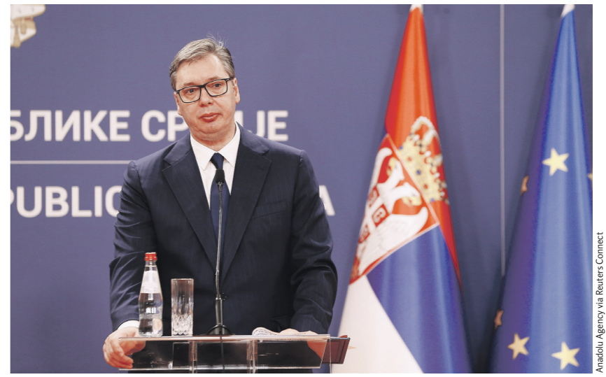
Александр Вучич заявил, что Приштина демонстрирует намерение «морить голодом сербский народ в Косово»

Зачем Приштине новый виток эскалации в Косово