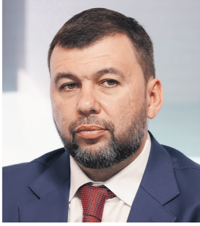
Александр Рюмин / ИКС

Для территорий Донбасса характерны активные действия практически по всей линии соприкосновения, но наступление ВСУ на этих участках в сжатые сроки нивелируется ВС РФ. Об этом в интервью «Известиям» заявил врио главы ДНР Денис Пушилин. По его словам, переговоры с противником сегодня нецелесообразны из-за потери Украиной своей субъектности, а Запад, который мог предотвратить конфликт, затаил время лишь для подготовки к выборам, Денис Пушилин рассказал на ПМЭФ-2023.