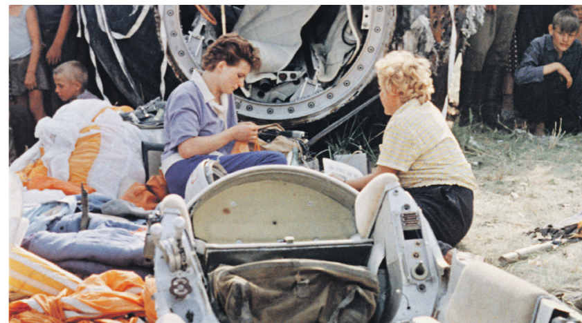
Валентина Терешкова после приземления (Алтайский край, 1963 год)

Полёт Валентины Терешковой вошёл в историю. Помимо статуса первой женщины, покорившей околоземную орбиту, за ней зафиксирован уникальный рекорд: она остаётся единственной из женщин-космонавтов и женщин-астронавтов, кто летал в одиночку, без экипажа. И этого достаточно для того, чтобы признать её подвиг.