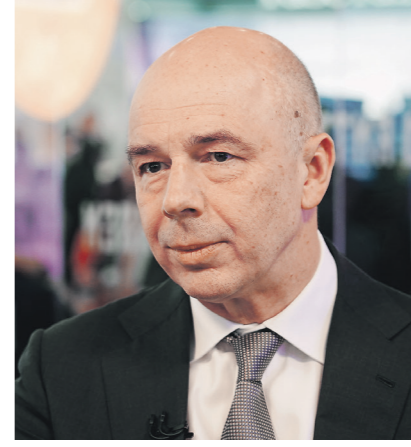
Антон Силуанов / Иллюстрация

Минфин не планирует больше выпускать народные ОФЗ. Но при этом готов рассмотреть возможность сохранения индивидуальных инвестиционных счетов первого типа (ИИС-1) после появления ИИС-3, чтобы стимулировать граждан за счёт большего количества инструментов вкладывать средства в финансовый рынок. Об этом в интервью «Известиям» на ПМЭФ рассказал министр финансов Антон Силуанов. Он также заявил: доминированию доллара в связи с утечкой к нему доверия и появлением цифровых валют и активов придёт конец, хотя это и не произойдёт быстро. И ответил на вопрос, есть ли риск, что до конца года Фонд национального благосостояния может опустеть.