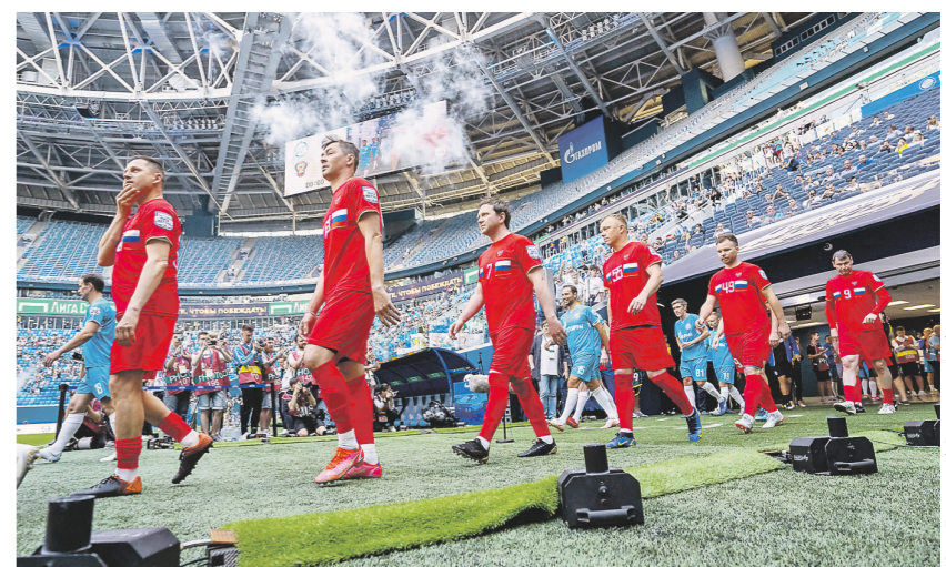
Юлия Пелопризова / Российский футбольный союз