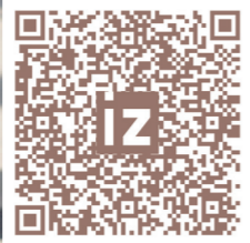
Павел Вохов / Иллюстрация