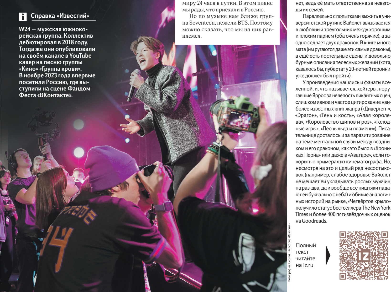
Фотографы: Сергей Ланской / Иллюстрация

W24 — мужская южнокорейская группа. Коллектив дебютировал в 2018 году. Тогда же они опубликовали на своём канале в YouTube кавер на песню группы «Кино» «Группа крови». В ноябре 2023 года впервые посетили Россию, где выступили на сцене Фандом Феста «ВКонтакте».